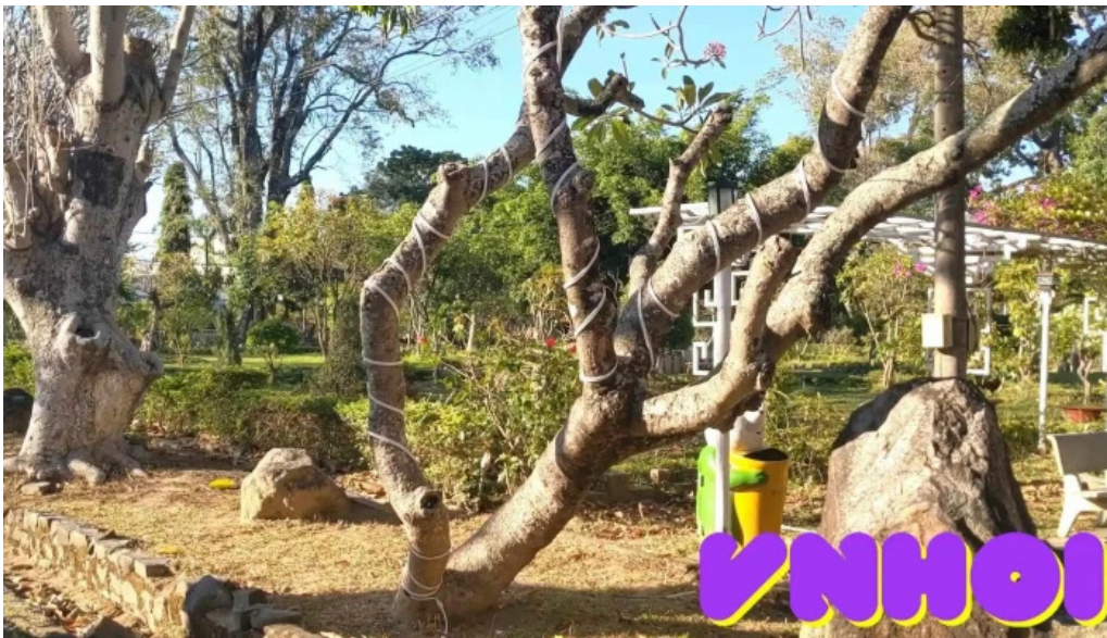
Toa giam muc kon tum video