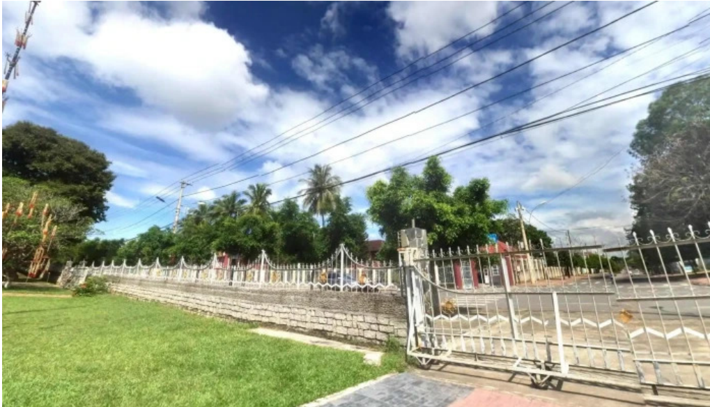
Toa giam muc kon tum che do xem pho va 360deg