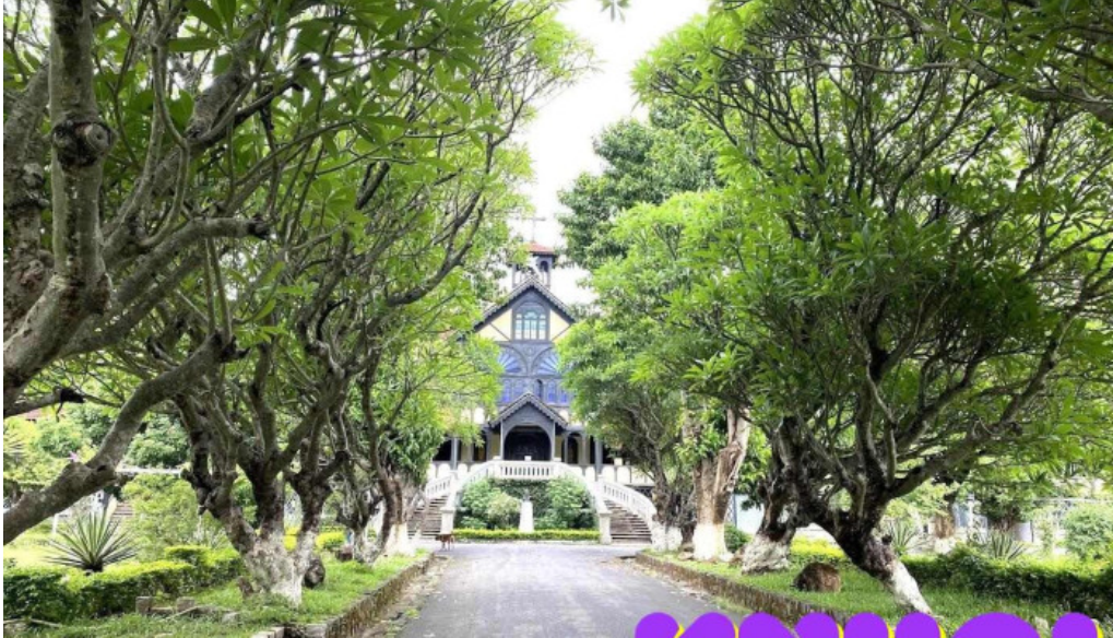
Tòa giám mục kon tum kon tum