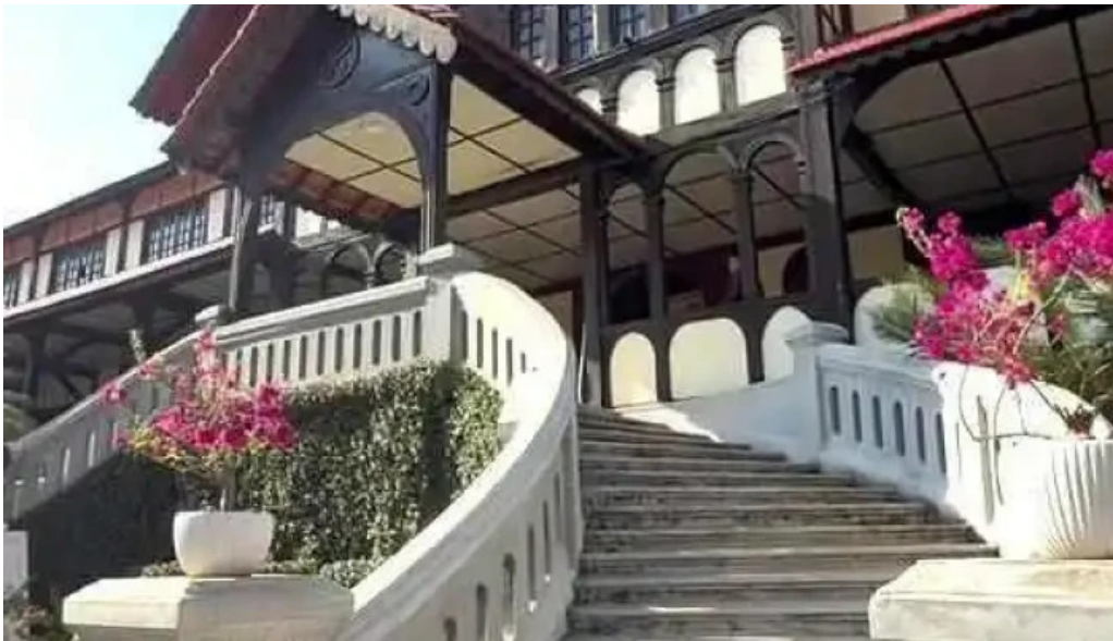
Toa giam muc kon tum moi nhat