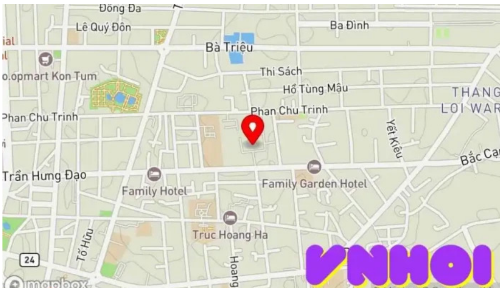
Toa giam muc kon tum b?n ??