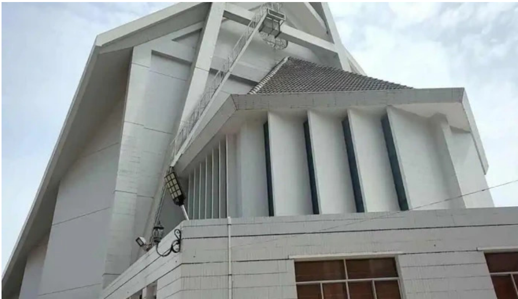
Nha tho giao xu ben da video