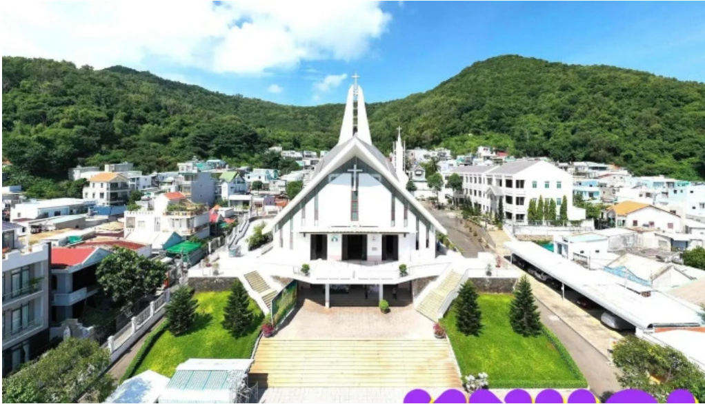
Nha tho giao xu ben da tat ca