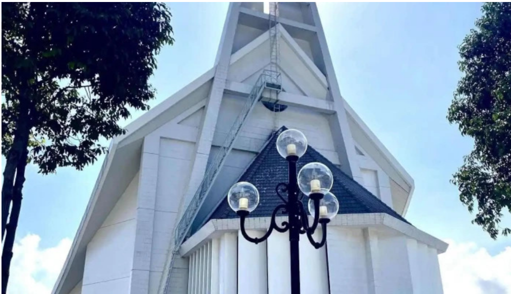
Nha tho giao xu ben da nha tho kito giao