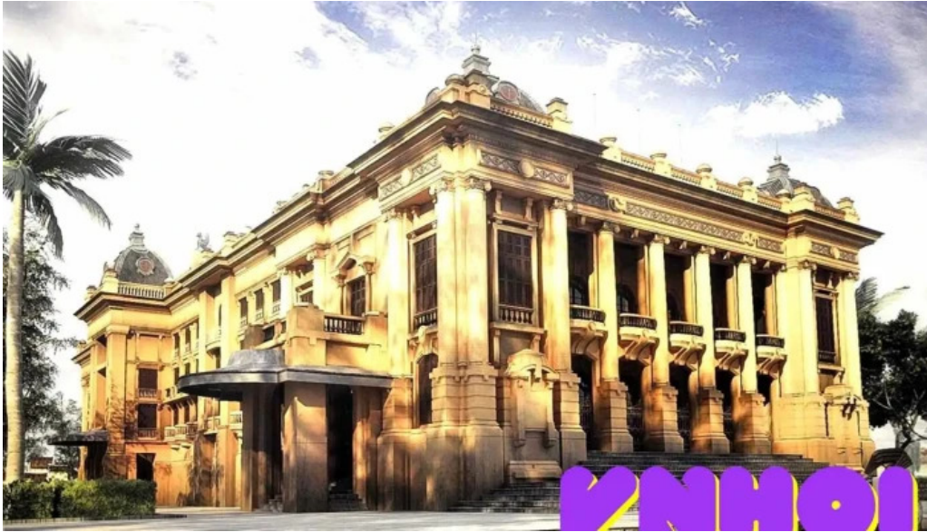
Nha hat lon ha noi tat ca