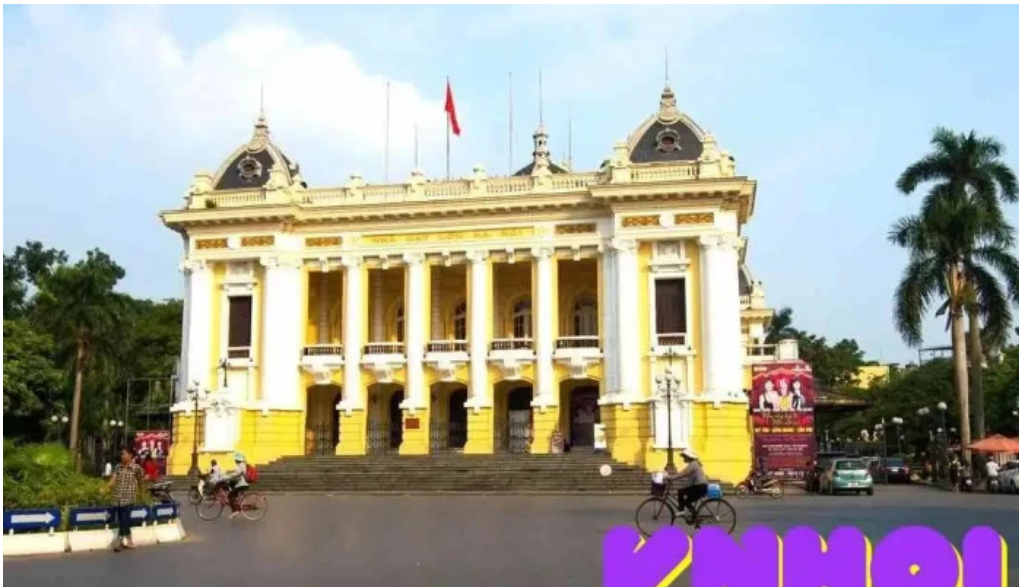
Nha hat l?n ha n?i ha n?i