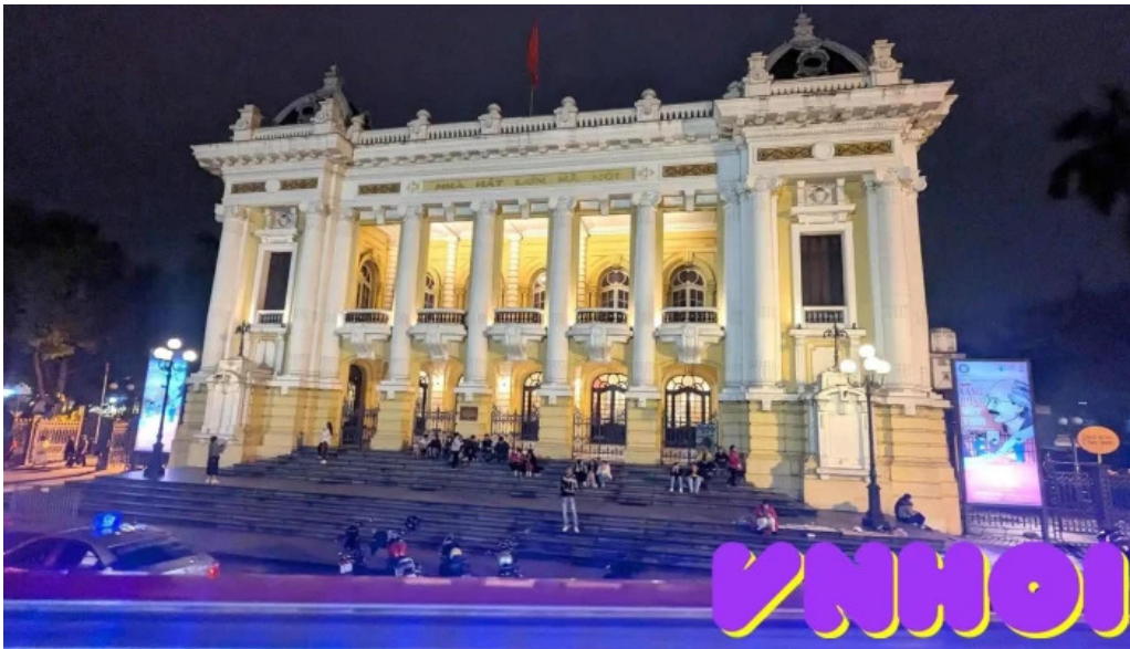
Nha hat lon ha noi moi nhat