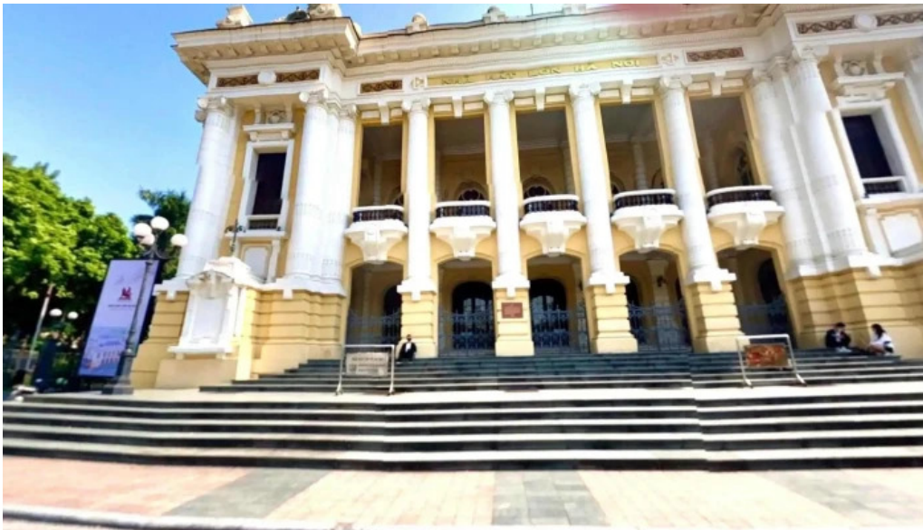
Nha hat lon ha noi che do xem pho va 360deg