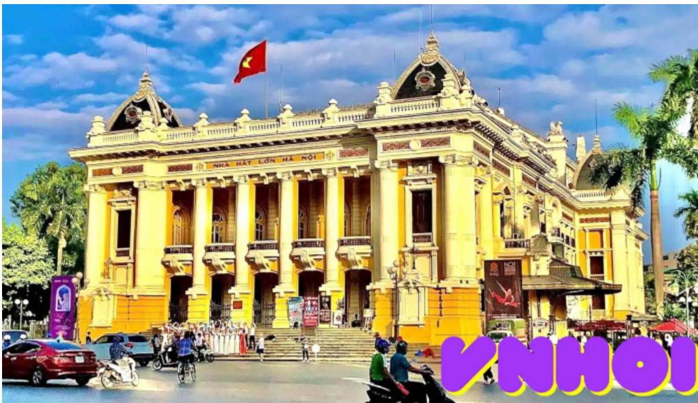
Nha hat lon ha noi video