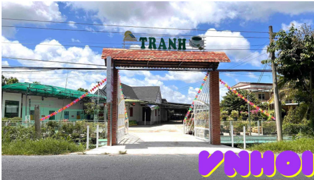
Diem tham quan tranh tat ca