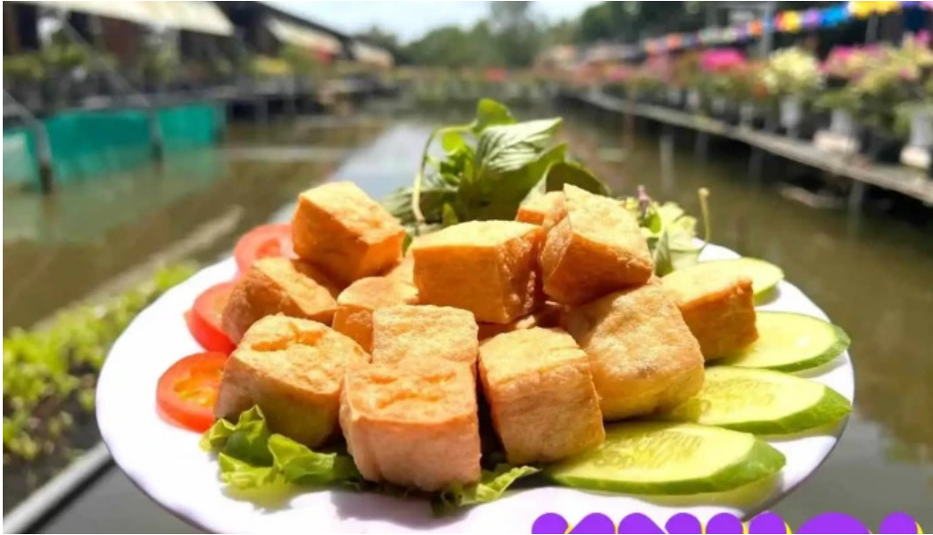
Diem tham quan tranh dau phu