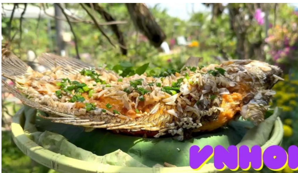
Diem tham quan tranh video