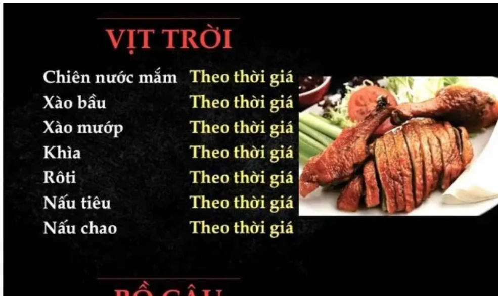
Diem tham quan tranh thuc don