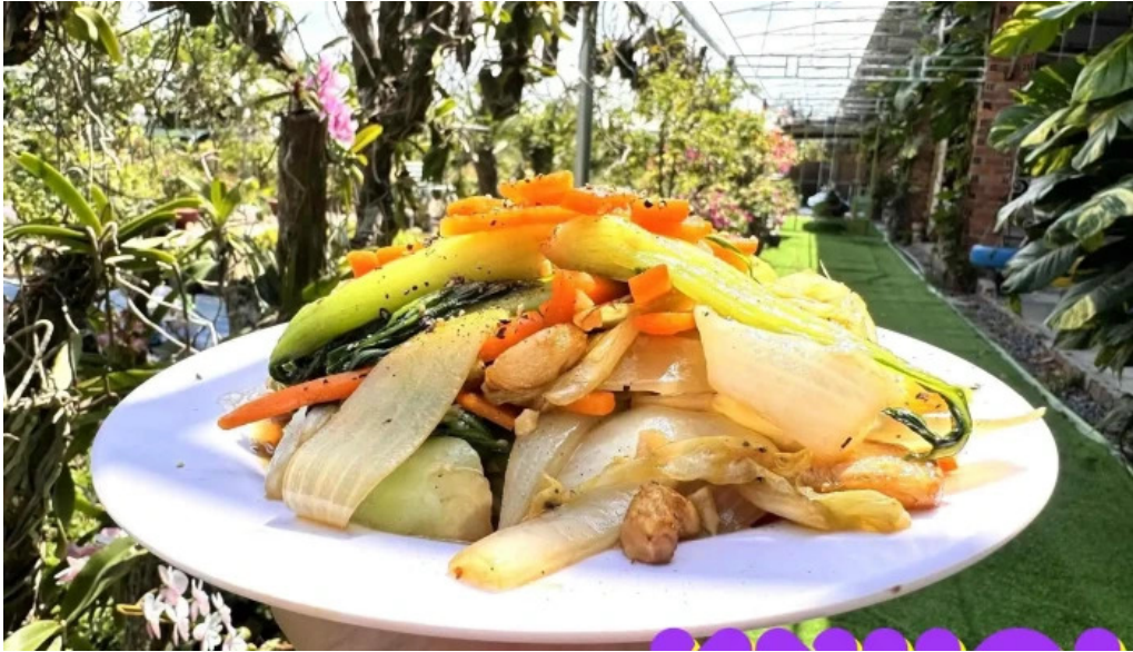
Diem tham quan tranh thuc pham va do uong