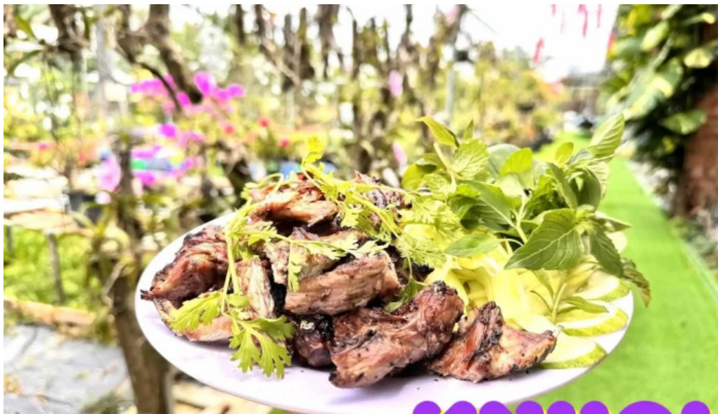
Diem tham quan tranh moi nhat