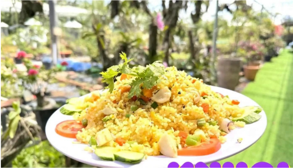
Điểm tham quan tranh cơm couscous