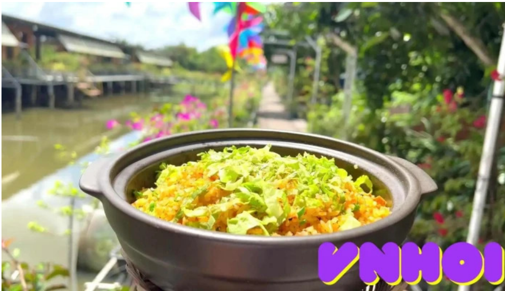
Diem tham quan tranh cua chu so huu