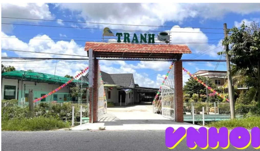
?i?m tham quan tranh ??ng thap