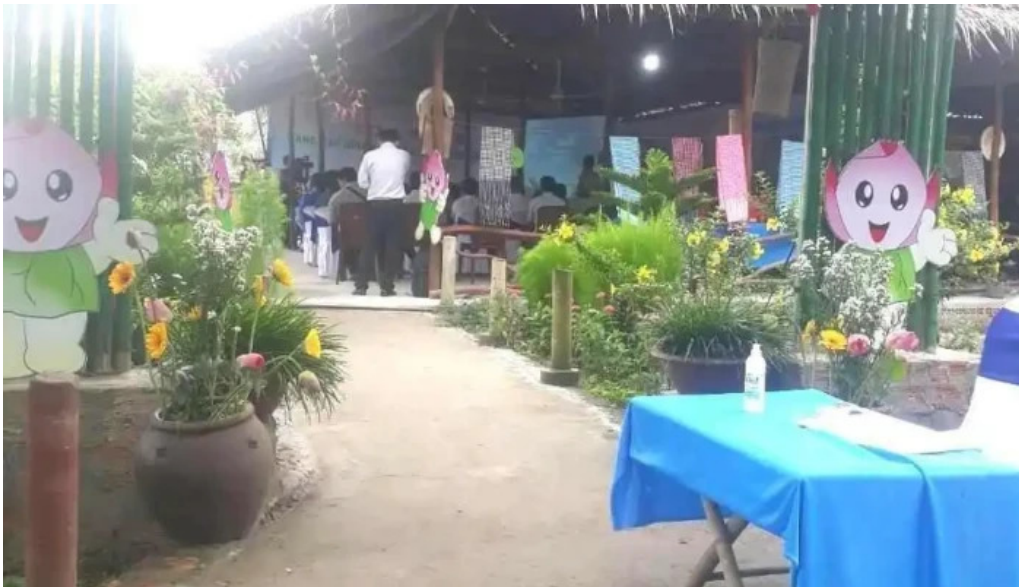
Khu du lịch dong sen thap muoi tat ca