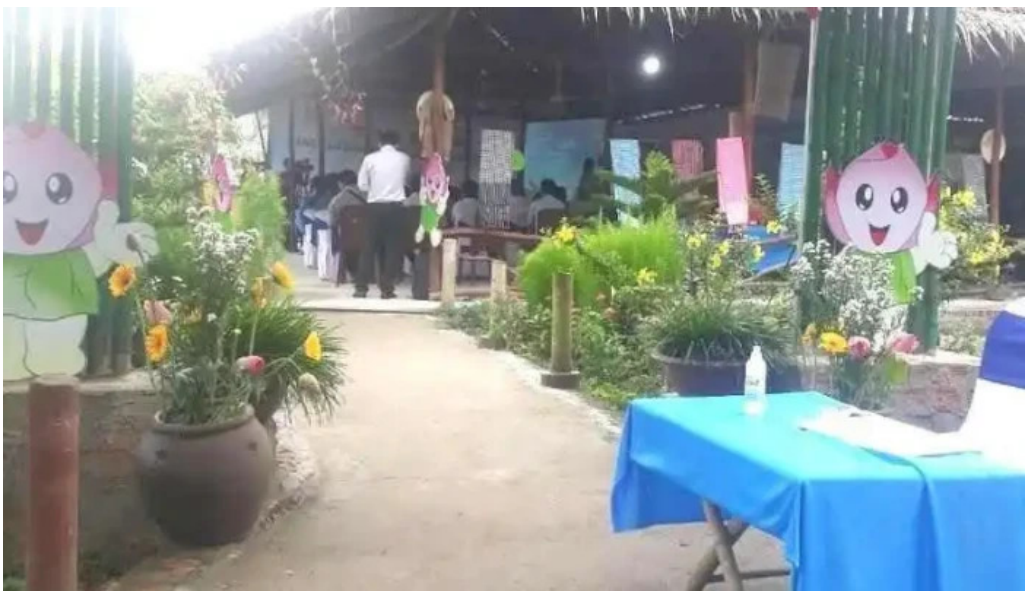
Khu du l?ch ??ng sen thap m??i ??ng thap