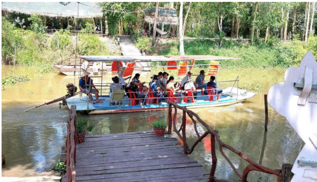
Khu du lịch dong sen thap muoi bau khong khi