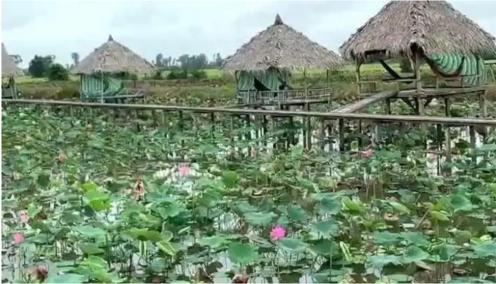
Khu du lich dong sen thap muoi video