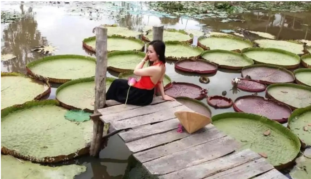
Khu du lịch dong sen thap muoi cua chu so huu