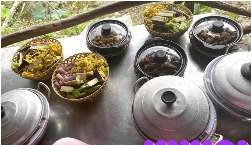
Khu du lich dong sen thap muoi thuc pham va do uong