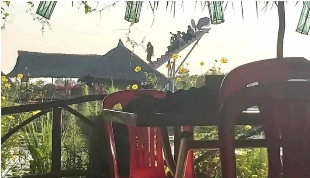
Khu du lịch sinh thái sen hồng bau không khi