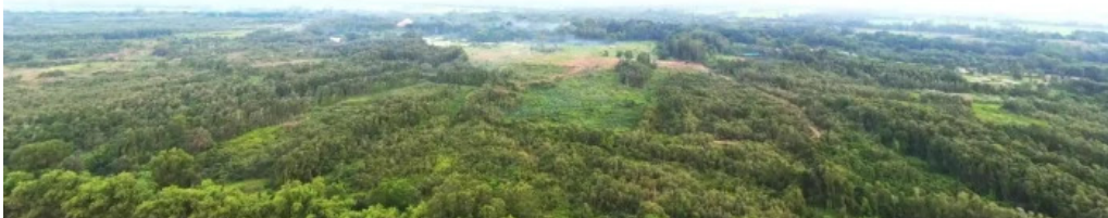
Khu du lich sinh thai sen hong che do xem pho va 360deg