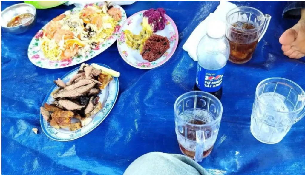
Khu du lịch sinh thái sen hồng thực phẩm và đồ uống