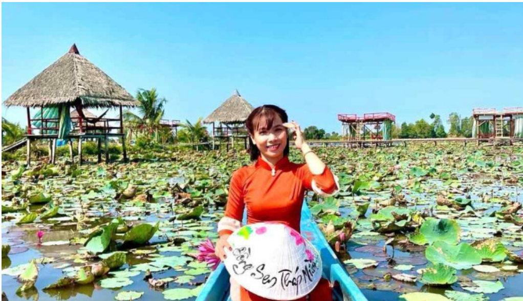
Khu du lịch sinh thái sen hồng mọi nhat