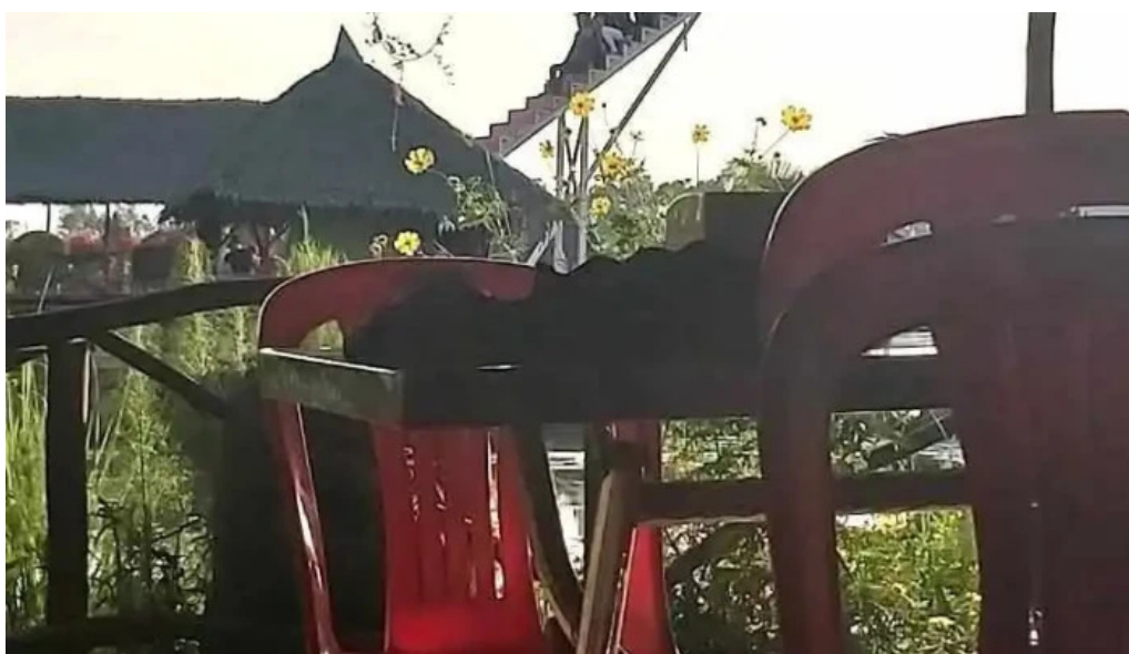
Khu du l?ch sinh thái sen h?ng ??ng th?p