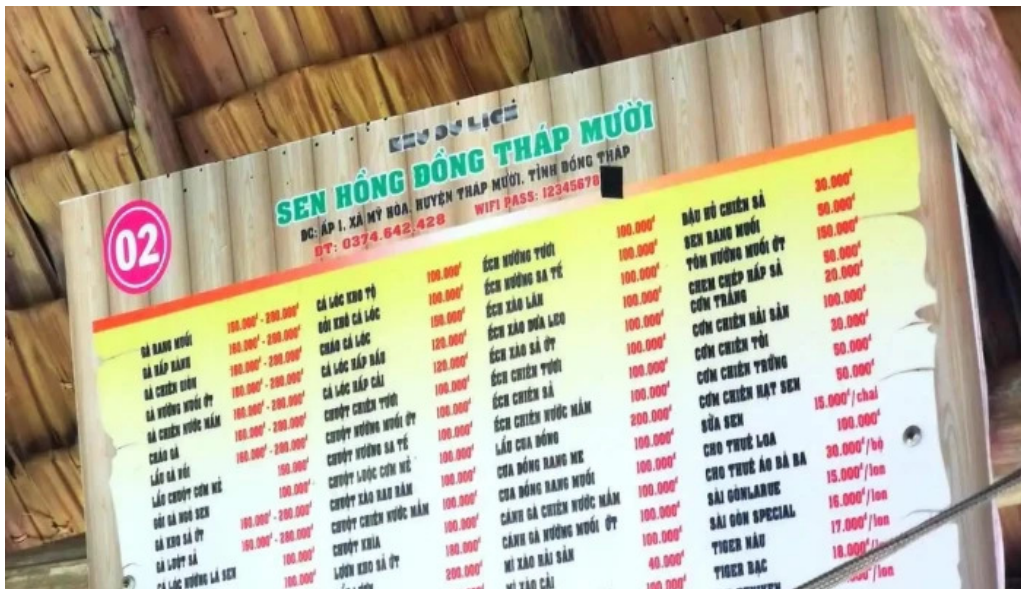
Khu du lịch sinh thái sen hồng thực đơn