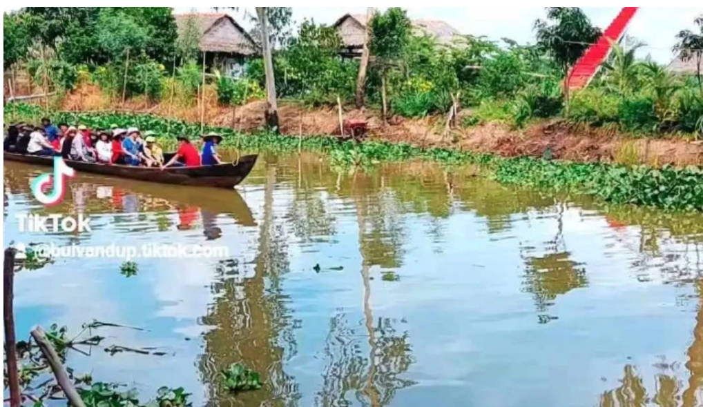
Khu du lịch sinh thái sen hồng video