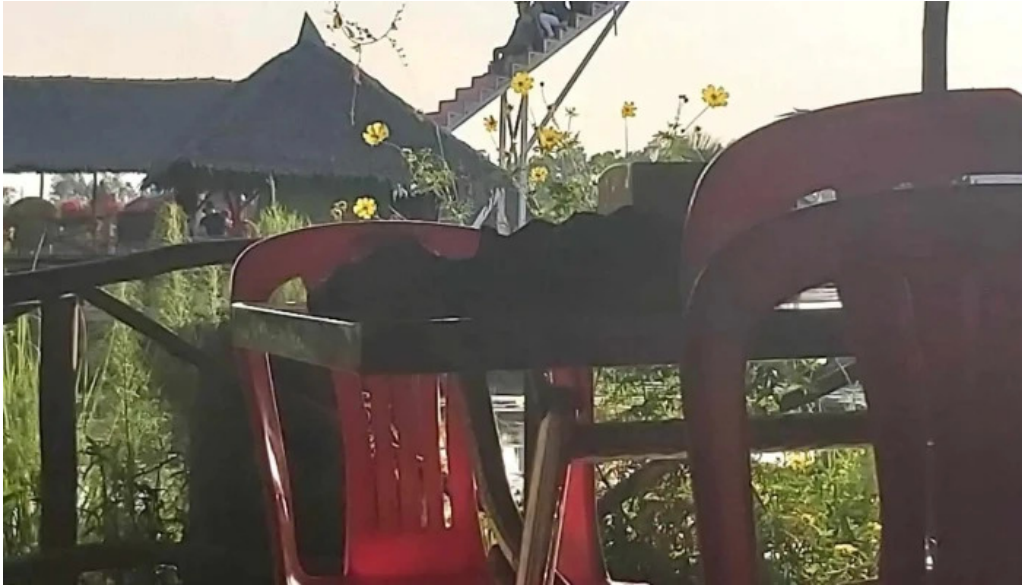
Khu du lịch sinh thái sen hồng tát cá