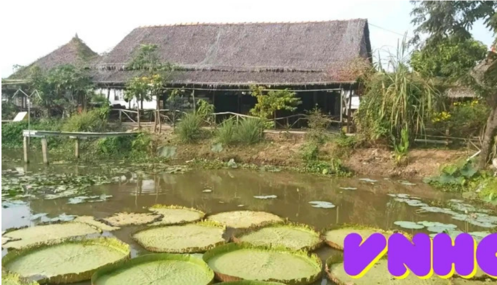
Khu du lich sinh thai sen hong cua chu so huu