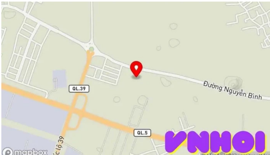
Làng du lịch sinh thái sen hồ b?n ??