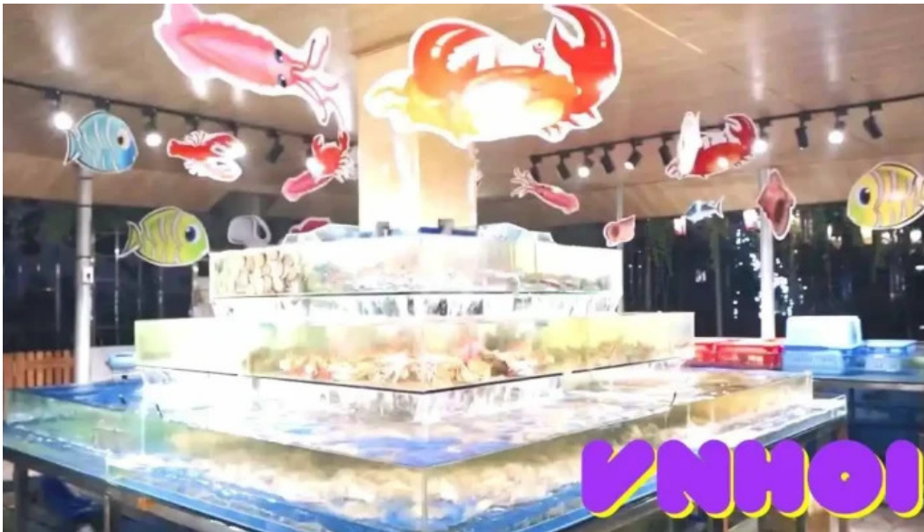
Lang du lich sinh thai sen ho video