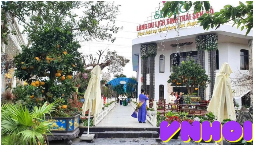
Làng du lịch sinh thái sen hồ mới nhất