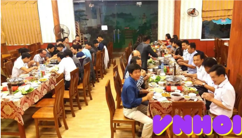
Lang du lịch sinh thái sen hồ bàu không khí