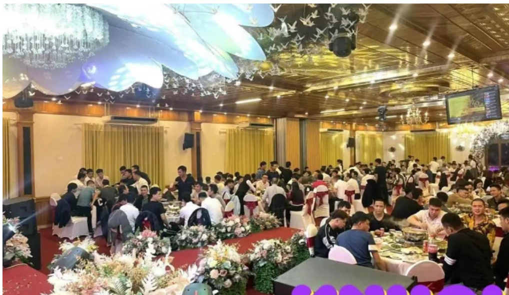
Làng du lịch sinh thái sen hồ hồ ng yên