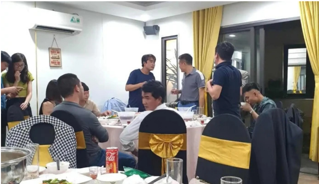
Lang du lich sinh thai sen ho thuc pham va do uong