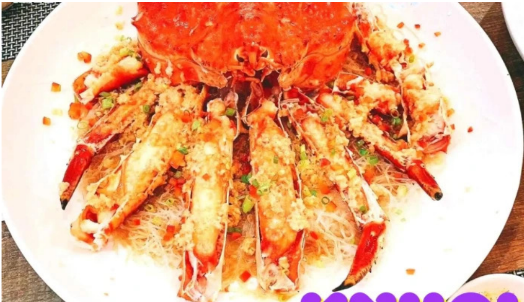
Làng du lịch sinh thái sen hồ hai san