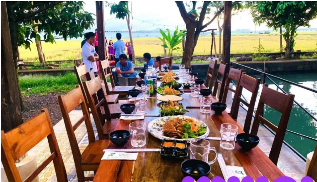
Am thuc dong que tu phuong that dao bau khong khi