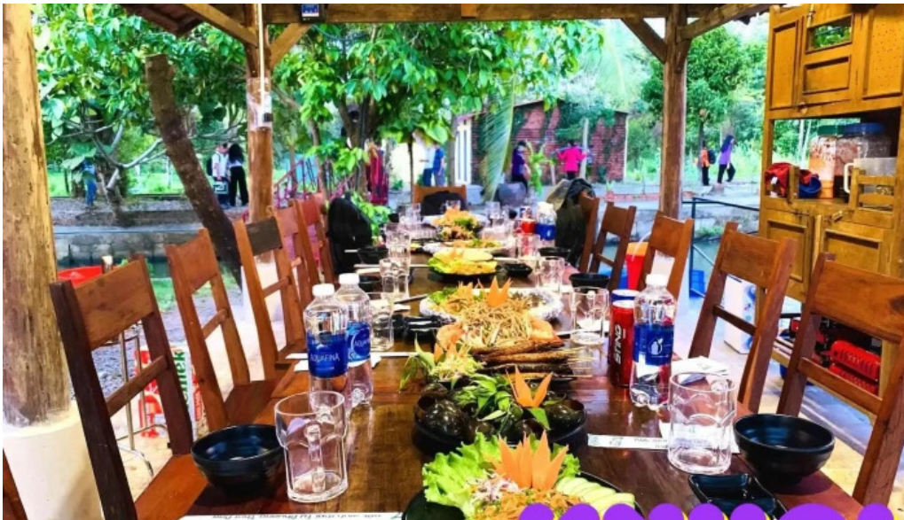
Am thuc dong que tu phuong that dao thuc pham va do uong