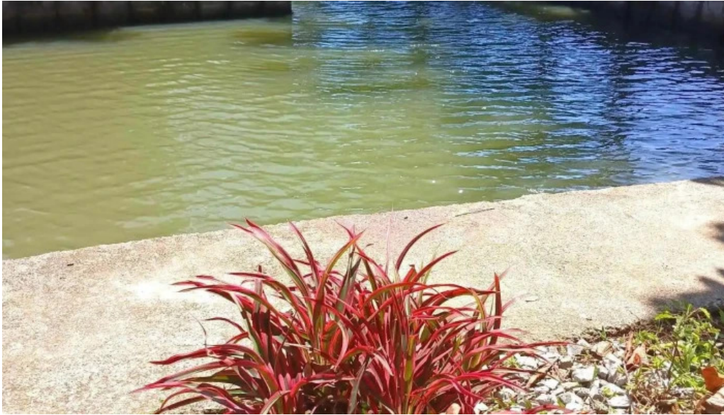
Am thuc dong que tu phuong that dao moi nhat