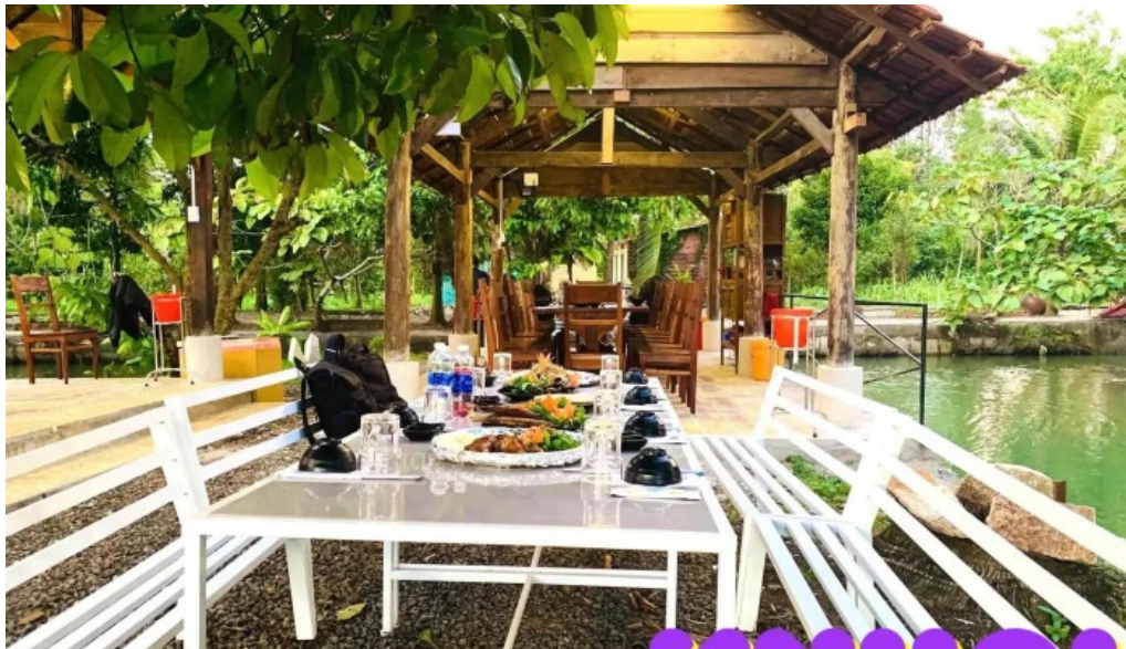
Am thuc dong que tu phuong that dao tat ca