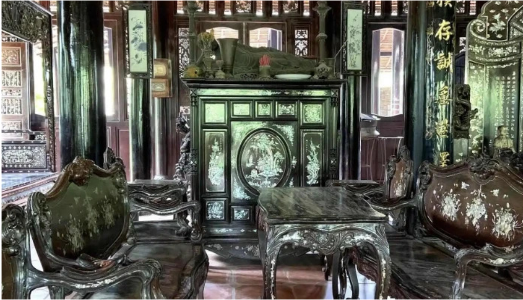
Lang co phuoc loc tho tat ca