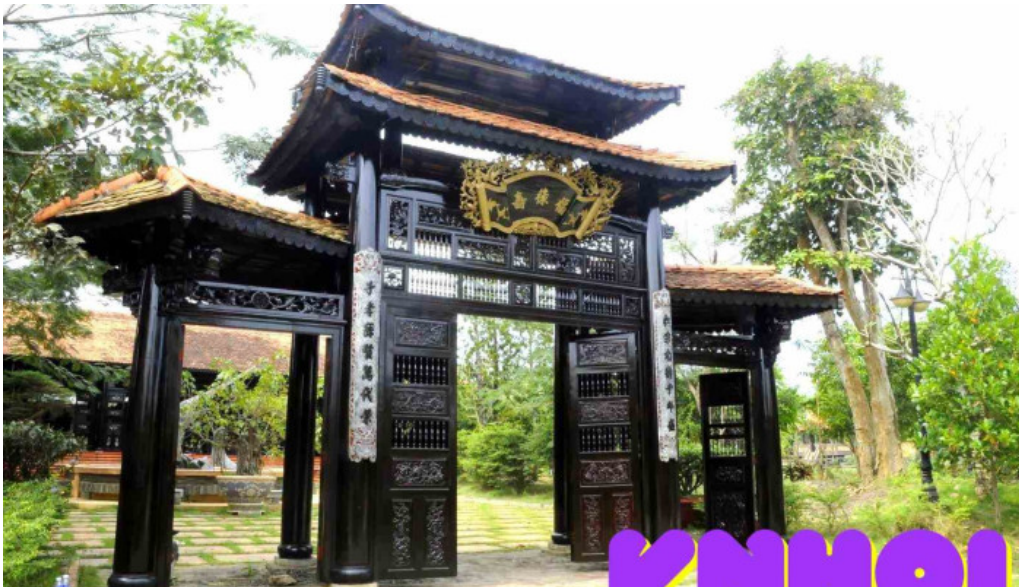
Lang co phuc loc tho cua chu so huu