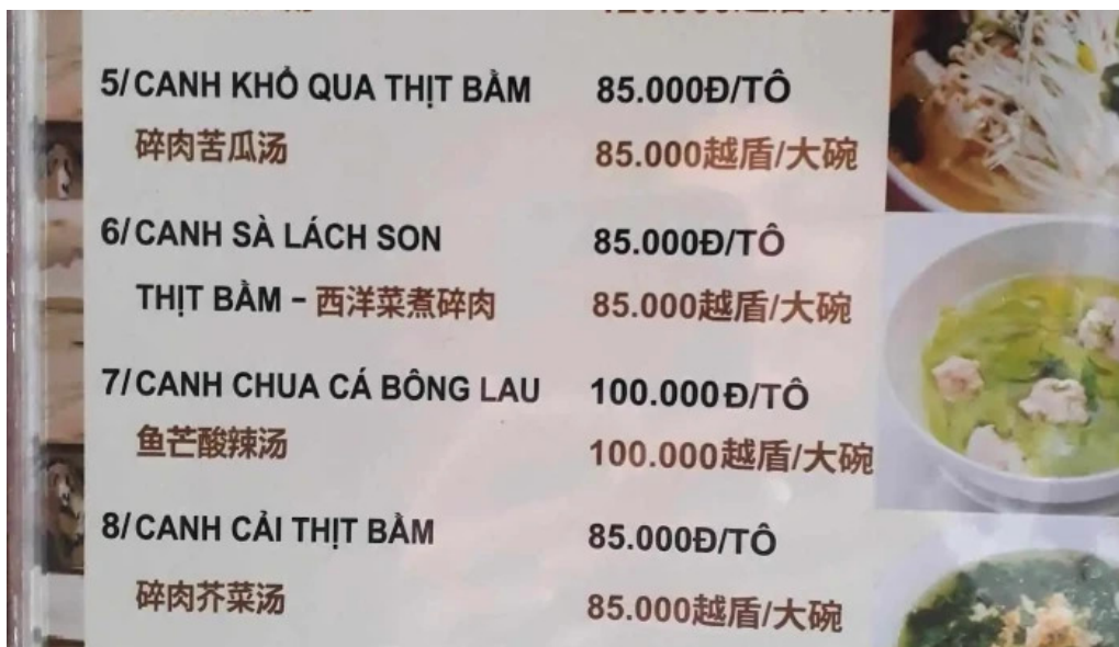
Lang co phuoc loc tho thuc don