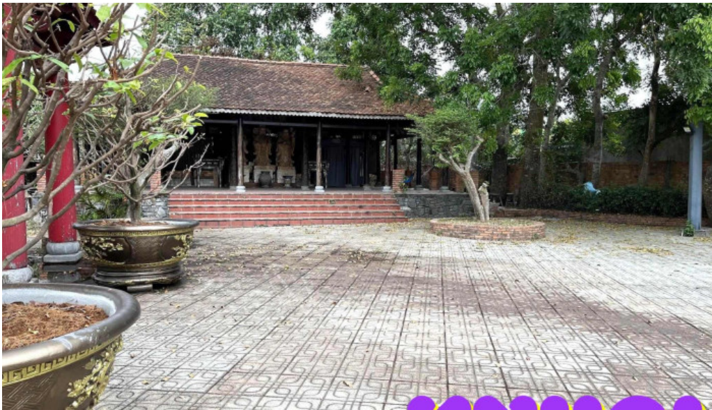
Lang co phuoc loc tho moi nhat