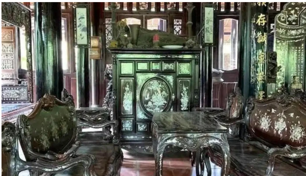
Lang c? ph??c l?c th? long an