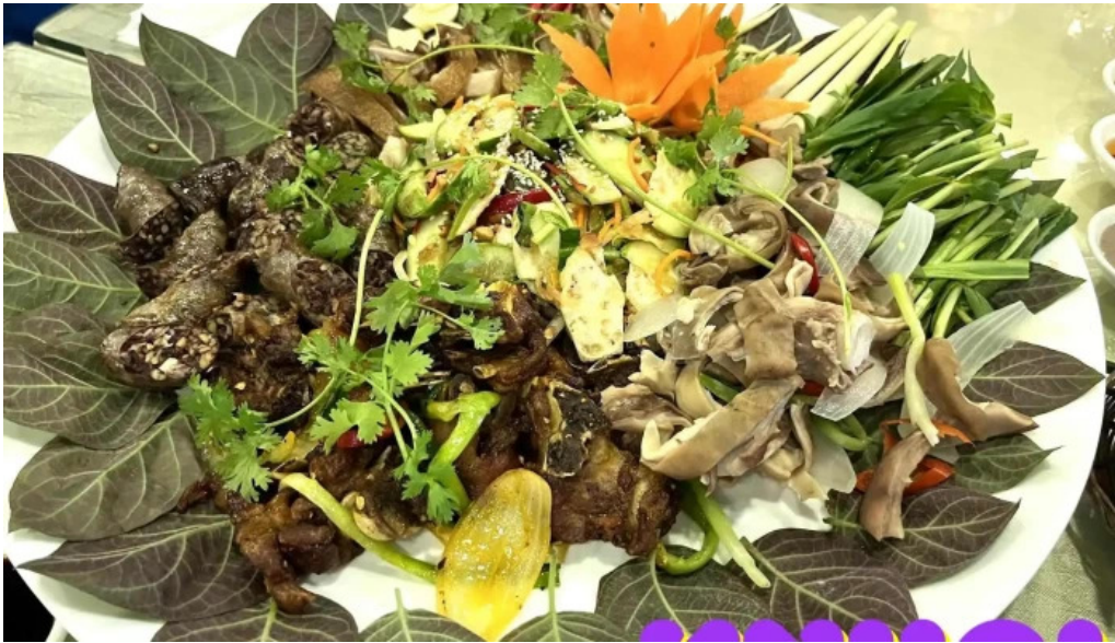
Lang co phuoc loc tho thuc pham va do uong