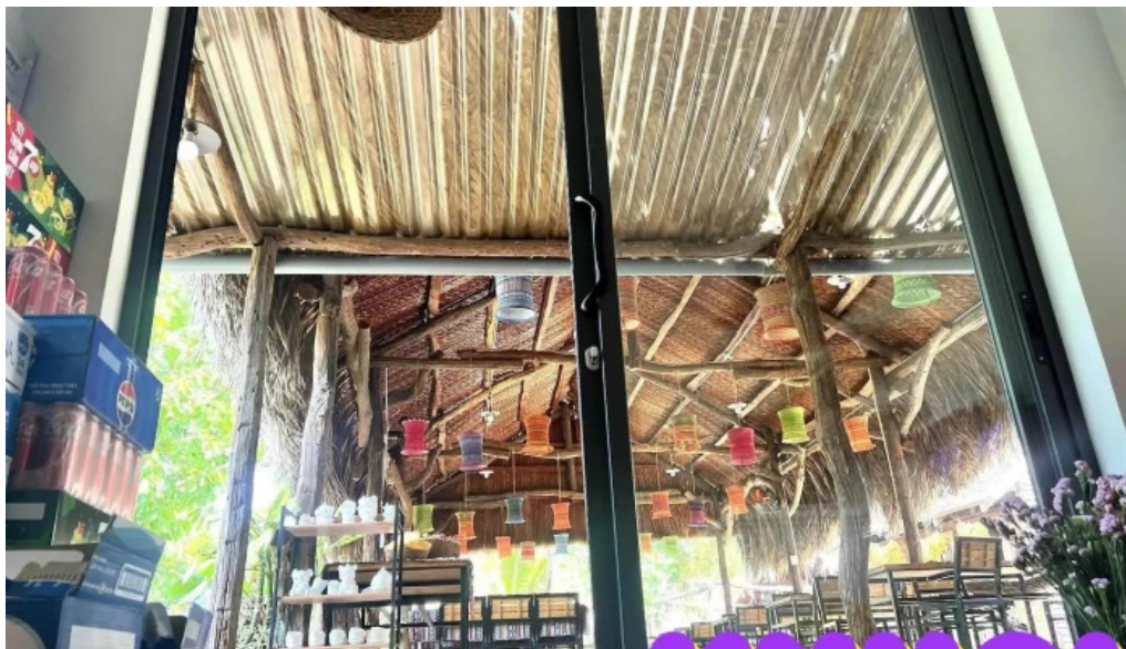
Vườn ba túi tát ca