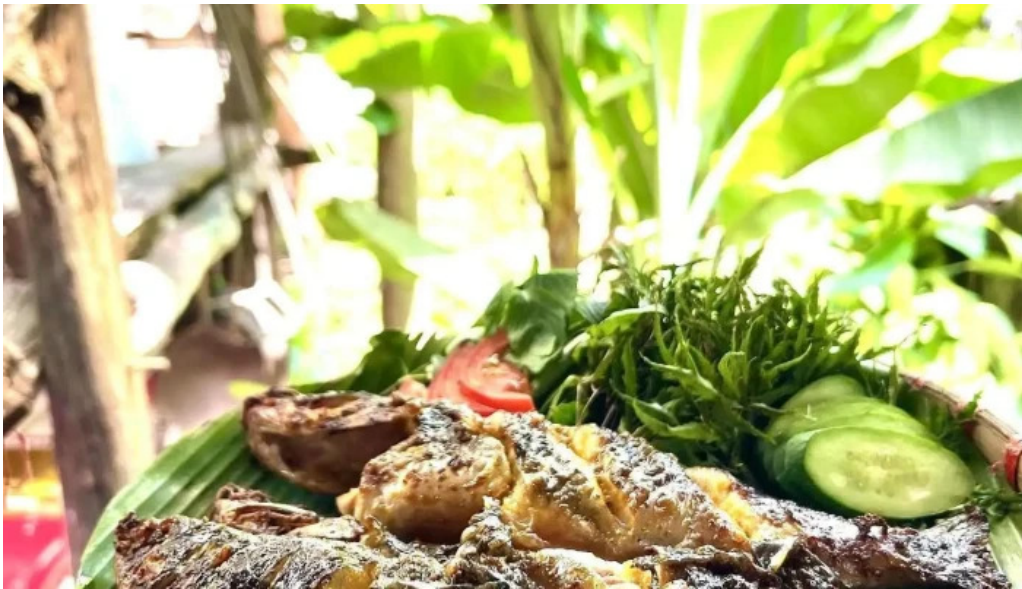
Vuon ba tui thuc pham va do uong