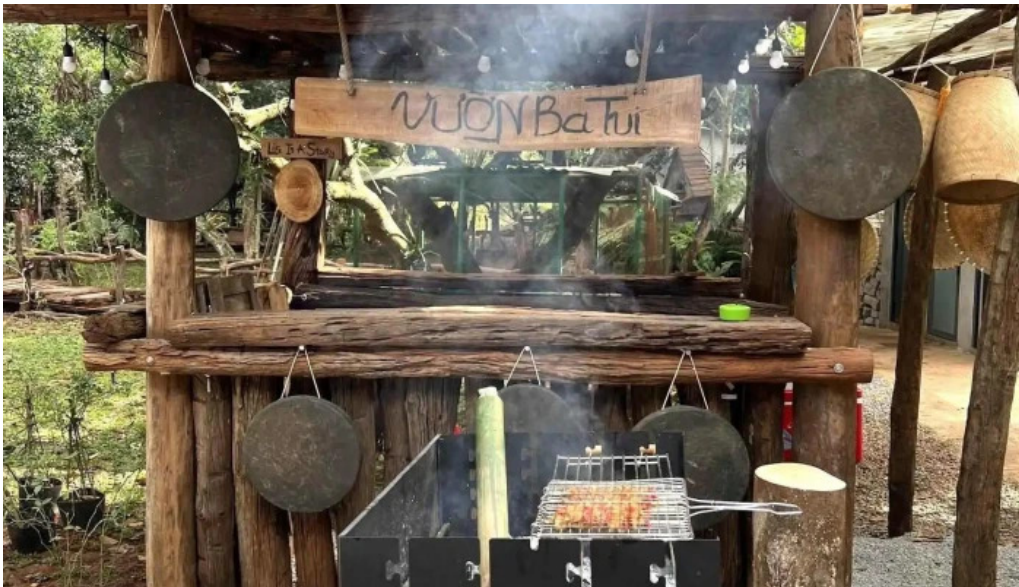
Vuon ba tui bau khong khi