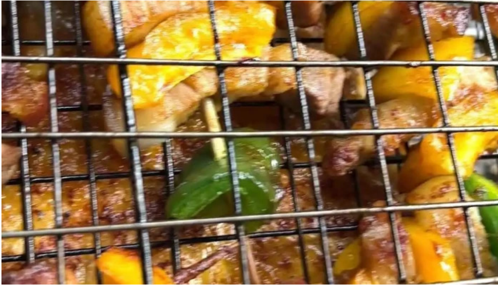
Vuon ba tui video