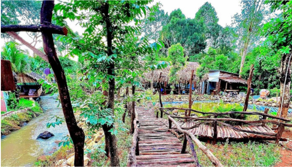
Vuon ba tui moi nhat