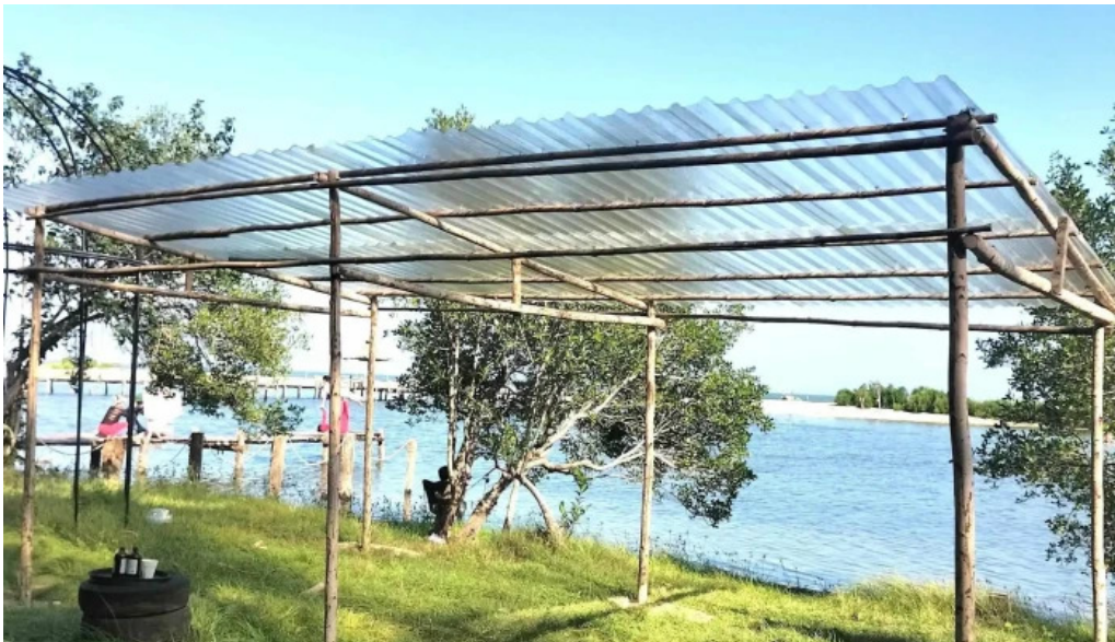
Camping rung va bien tat ca