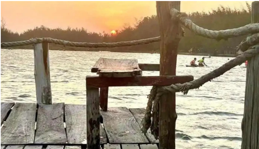
Camping rung va bien ho