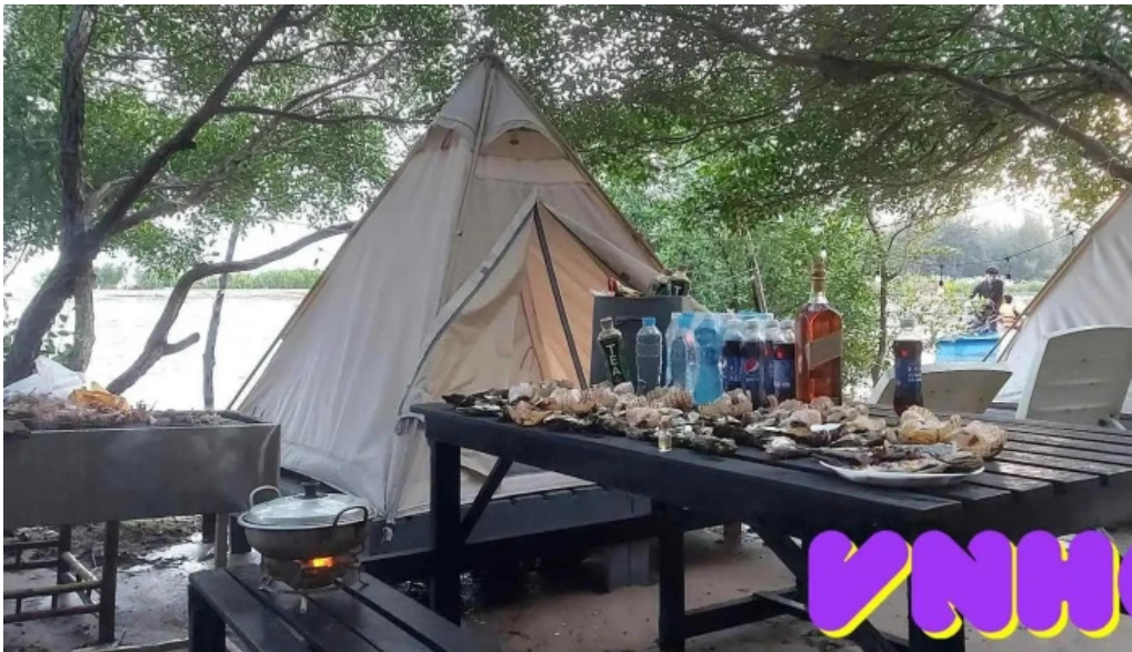
Camping rung va bien cam trai