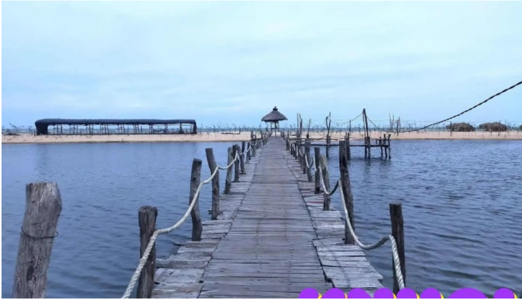
Camping rung va bien ngoai that