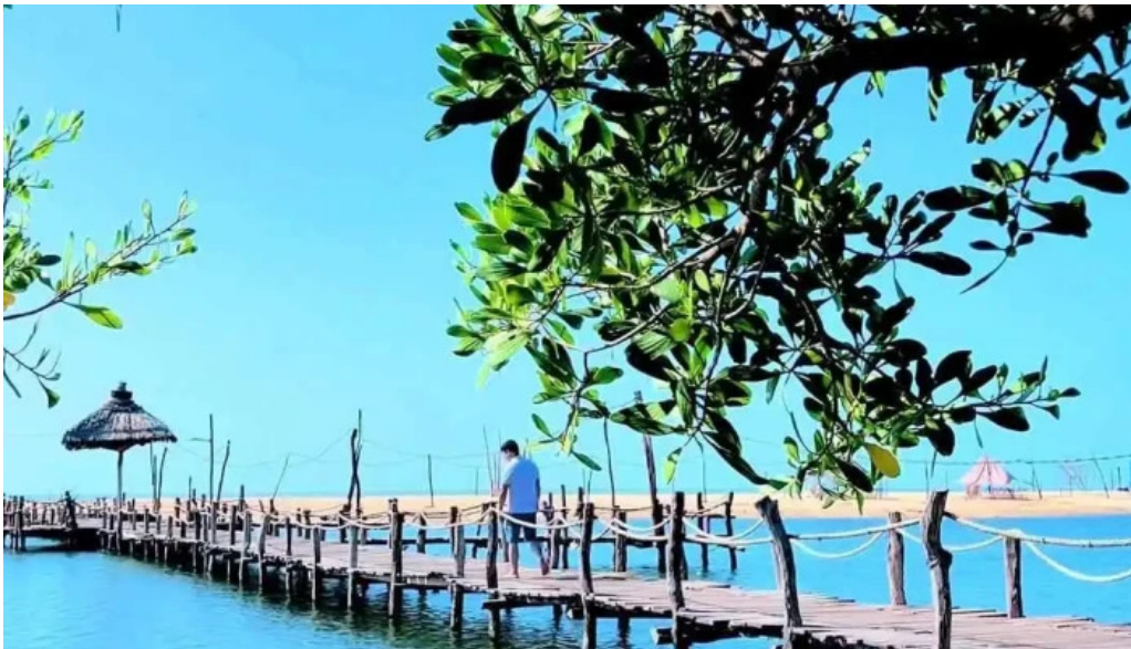
Camping rung va bien video