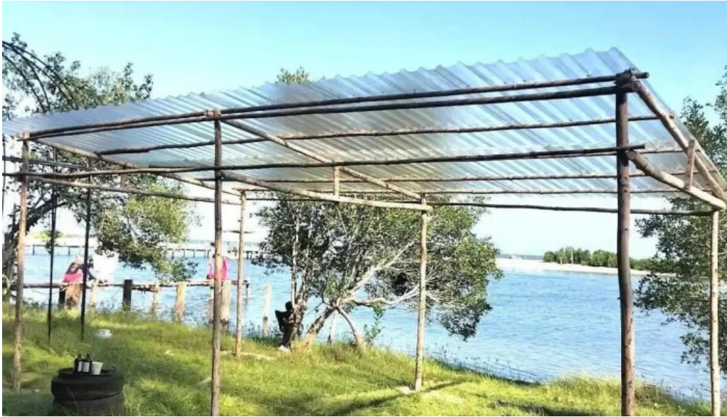
Camping r?ng va bi?n ba r?a v?ng tau