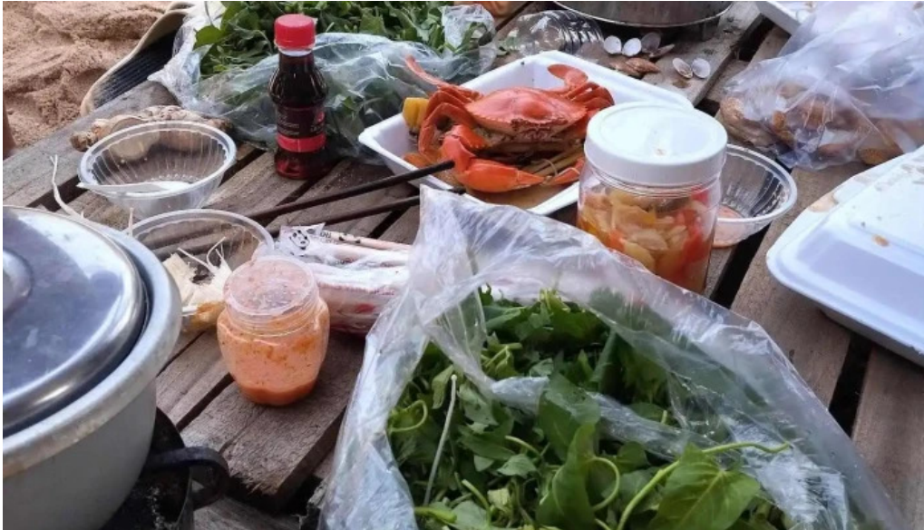
Camping rung va bien thuc pham va do uong