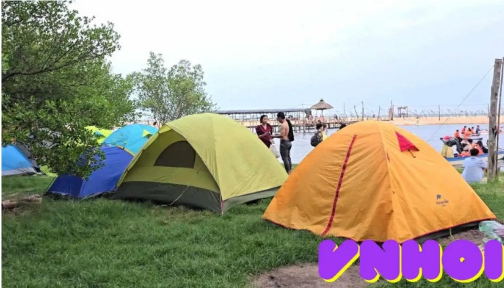
Camping rung va bien cua khach tro