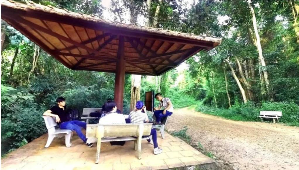
Tram kiem lam bau sau che do xem pho va 360deg