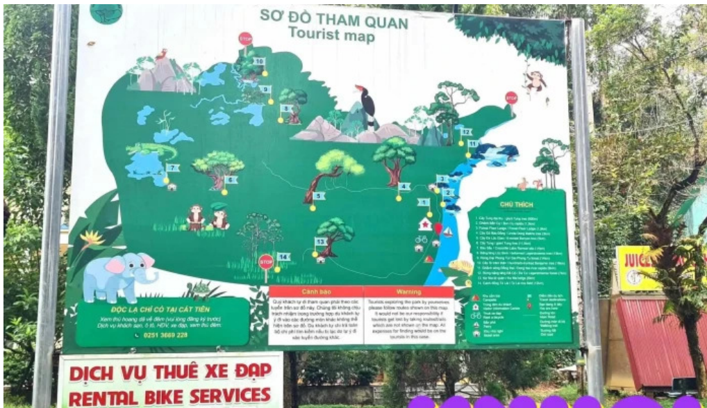
Tram kiem lam bau sau ban do co so luu tru