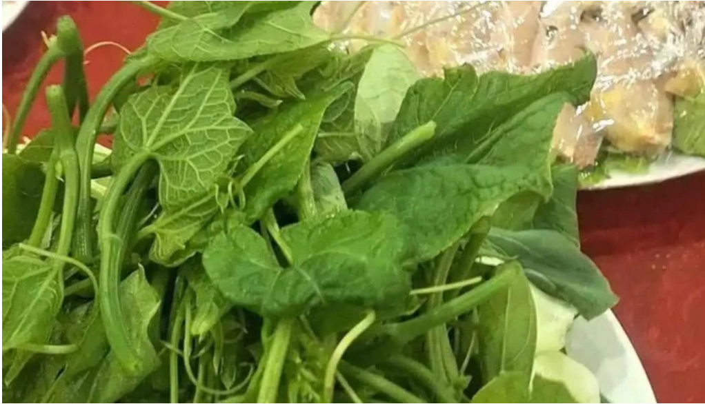
Khách sạn duc an duong pham van dong to dan pho 1 tt tam dao tam dao vinh phuc thuc pham va do uong