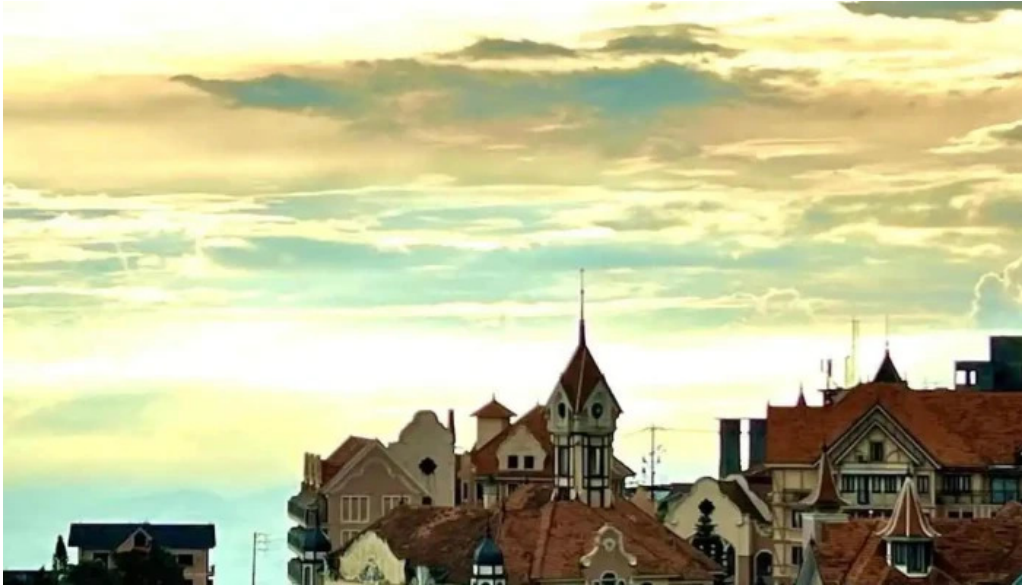
Khách sạn an dương pham van dong to dan pho 1 tt tam dao tam dao vinh phuc v?nh phuc