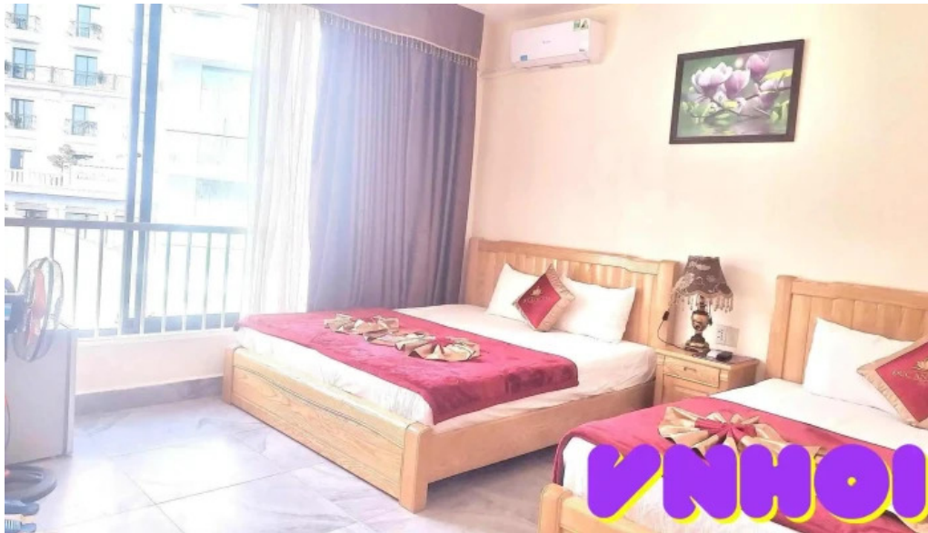
Khách sạn duc an duong pham van dong to dan pho 1 tt tam dao tam dao vinh phuc phong