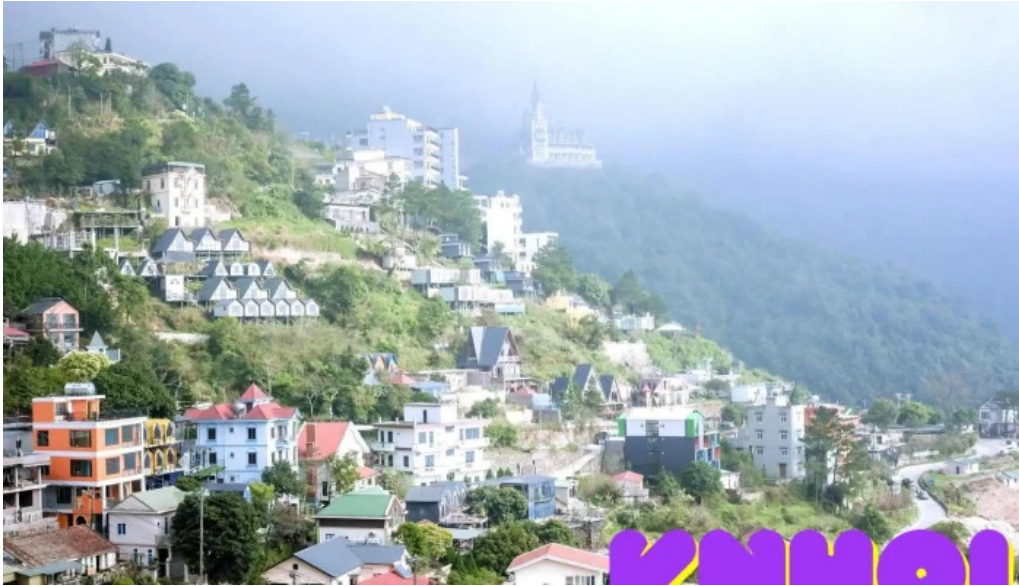
Khách sạn duc an duong pham van dong to dan pho 1 tt tam dao tam dao vinh phuc của khách trọ