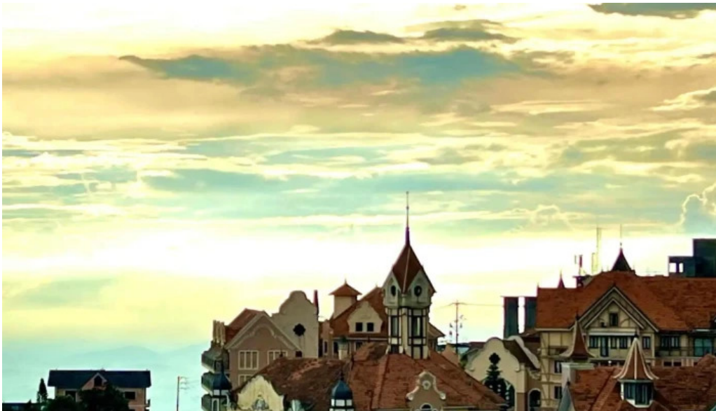
Khách sạn duc an duong pham van dong to dan pho 1 tt tam dao tam dao vinh phuc tat ca