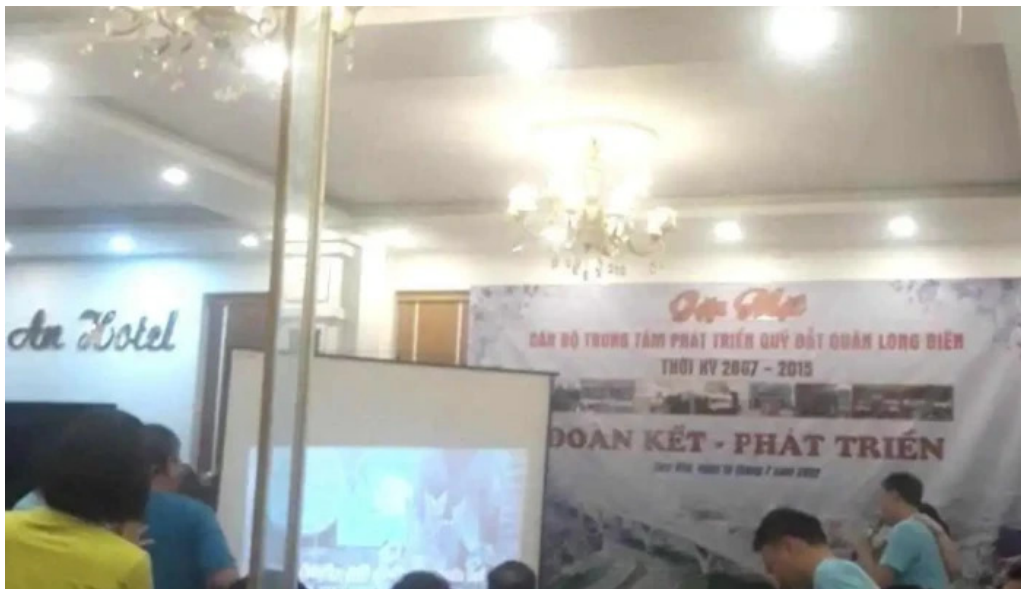
Khách sạn duc an duong pham van dong to dan pho 1 tt tam dao tam dao vinh phuc ngoai that