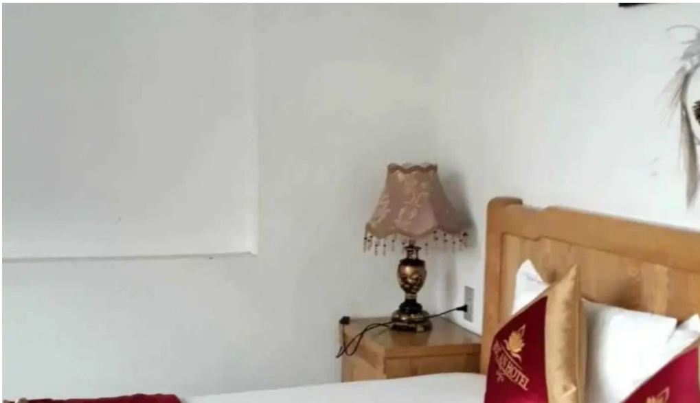
Khách sạn duc an duong pham van dong to dan pho 1 tt tam dao tam dao vinh phuc của chủ sở hữu