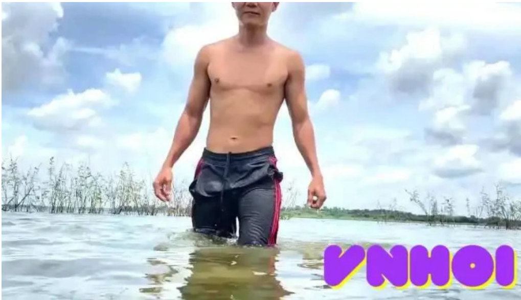
Ho da den video