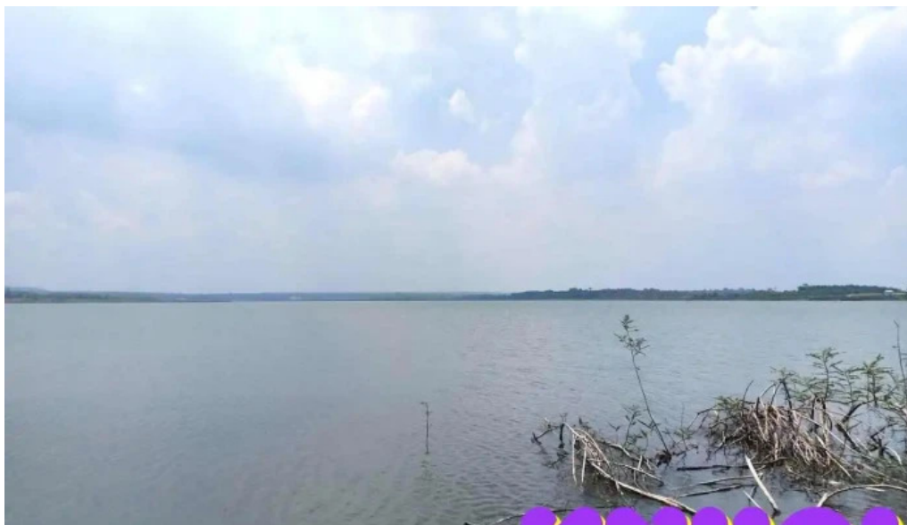
Homicide Án Bà Rịa Vũng Tàu