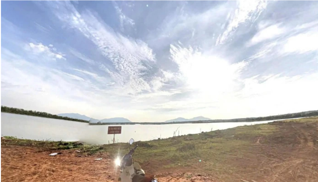
Ho da den che do xem pho va 360deg