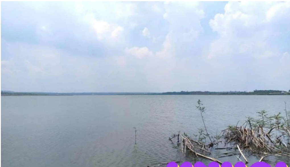
Ho da den tat ca