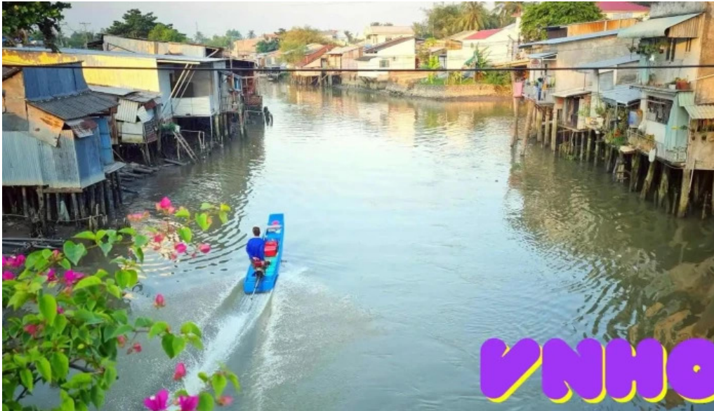
C?u ba khoi ??ng thap