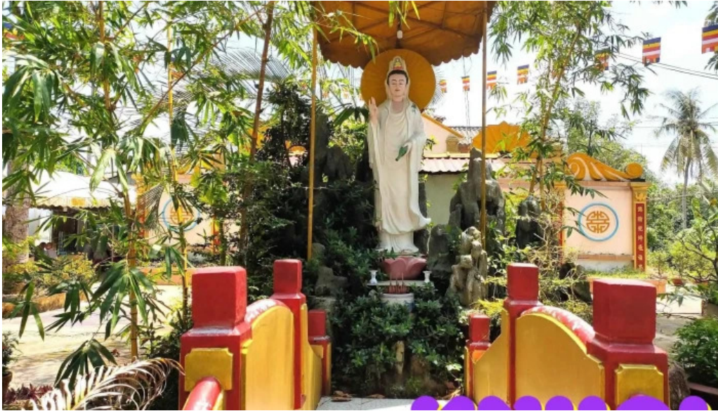
Cau ba khoi tat ca