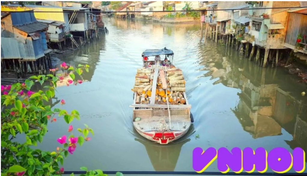
Cau ba khoi song