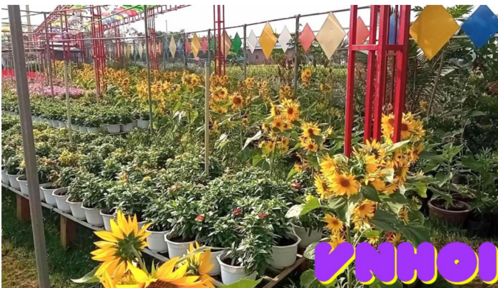
Dai ngam hoa vuon kieng ngoc lan video