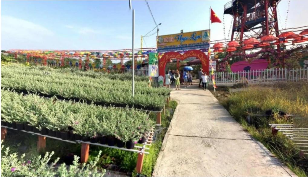
Dai ngam hoa vuon kieng ngoc lan che do xem pho va 360deg