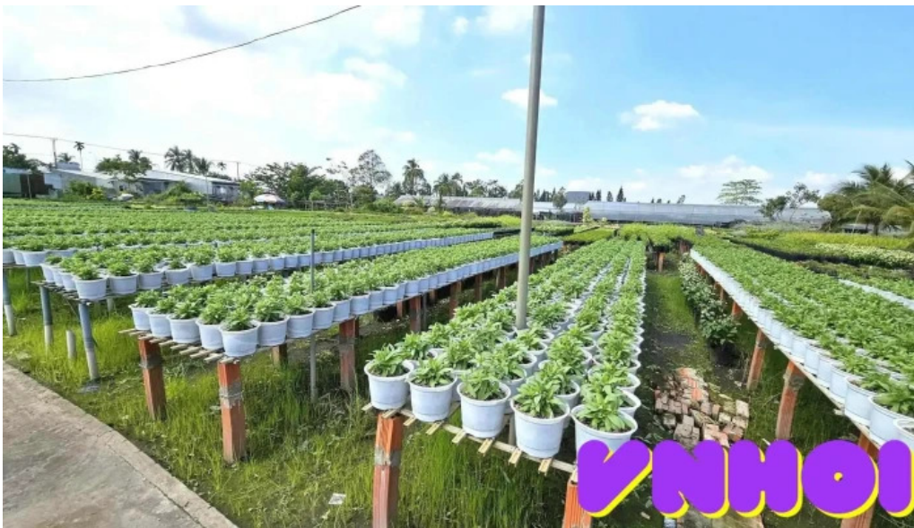
?ai ng?m hoa v??n ki?ng ng?c lan ??ng thap