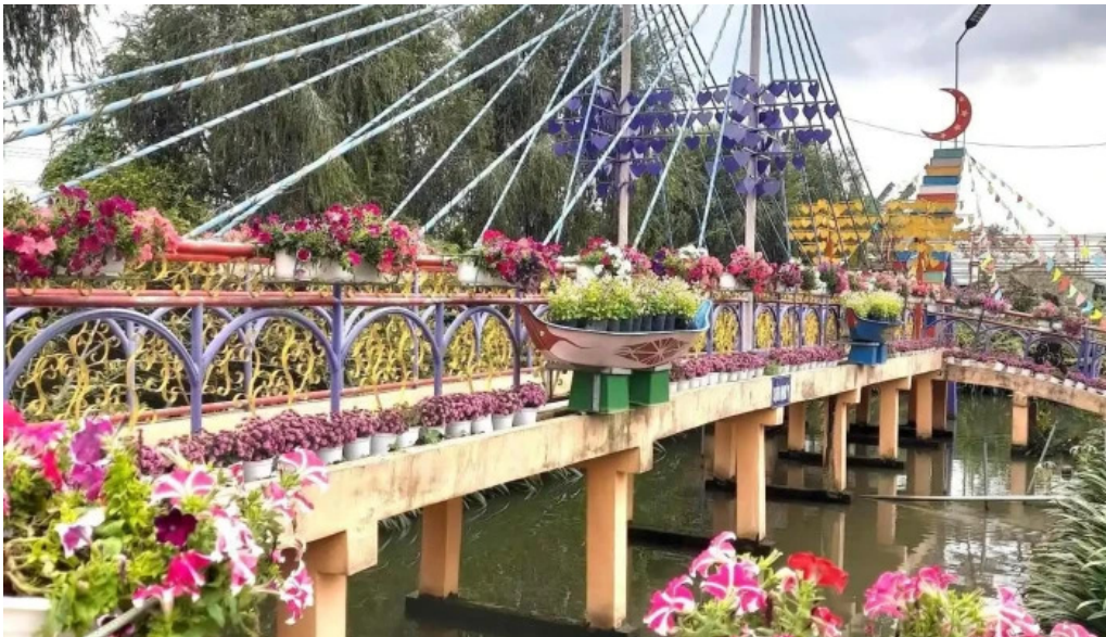
Dai ngam hoa vuon kieng ngoc lan moi nhat