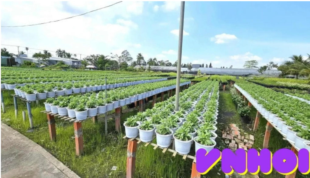
Dai ngam hoa vuon kieng ngoc lan tat ca