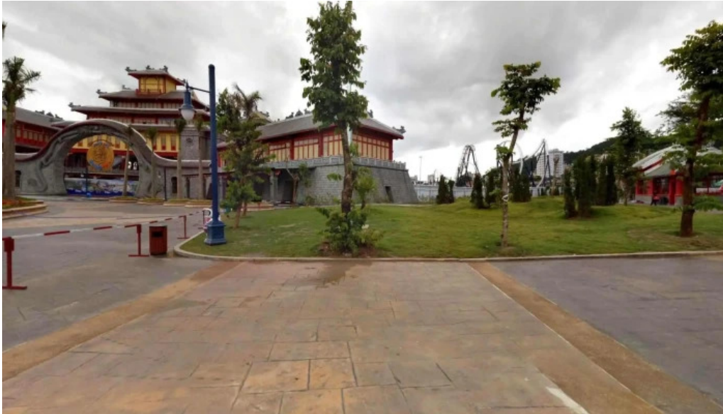
Cong vien dai duong ha long complex che do xem pho va 360deg