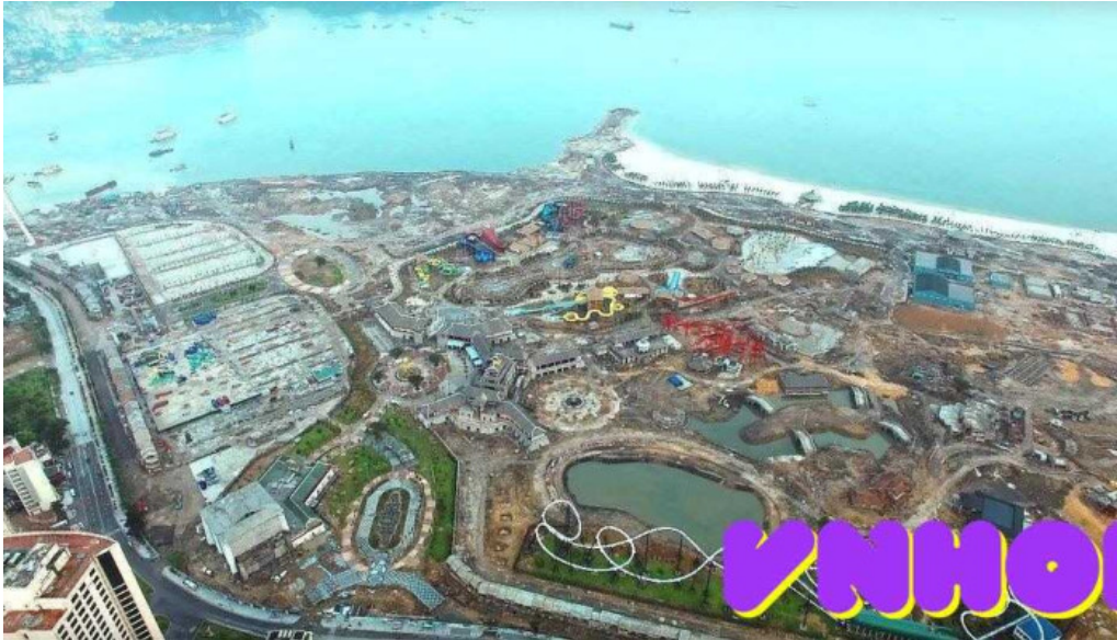
Công viên đại dương hải long complex bãi biển