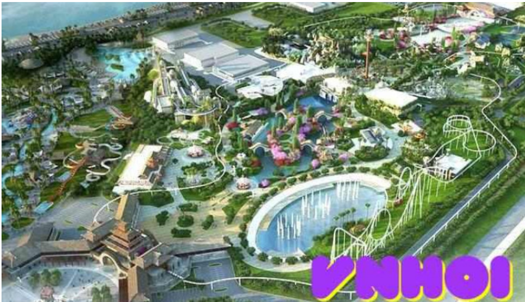
Cong vien dai duong ha long complex tieu khien