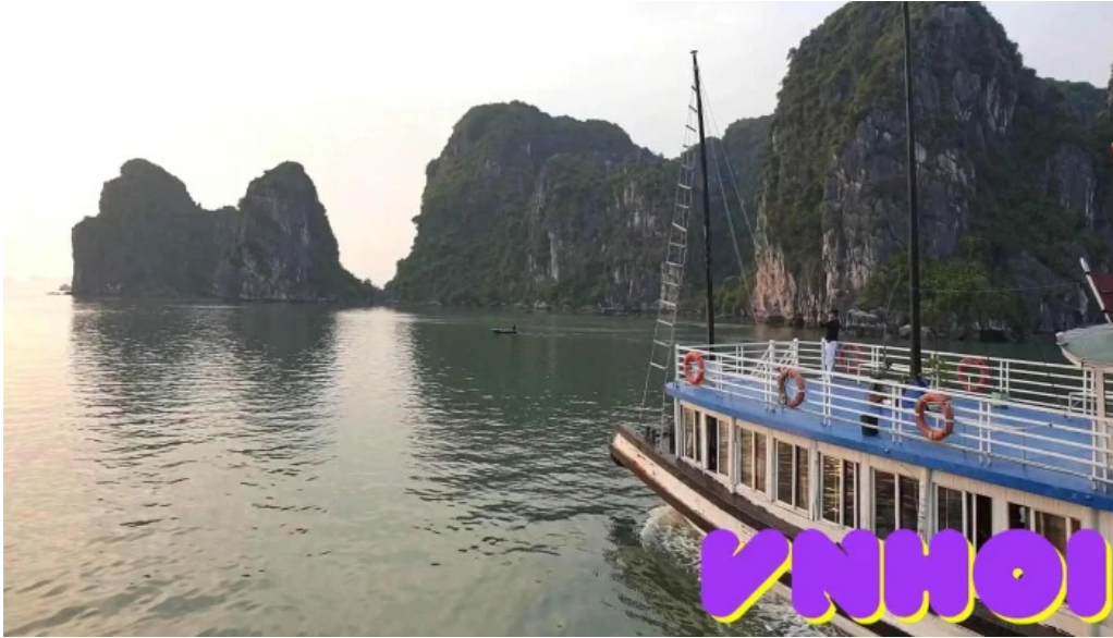
Cong vien dai duong ha long complex video