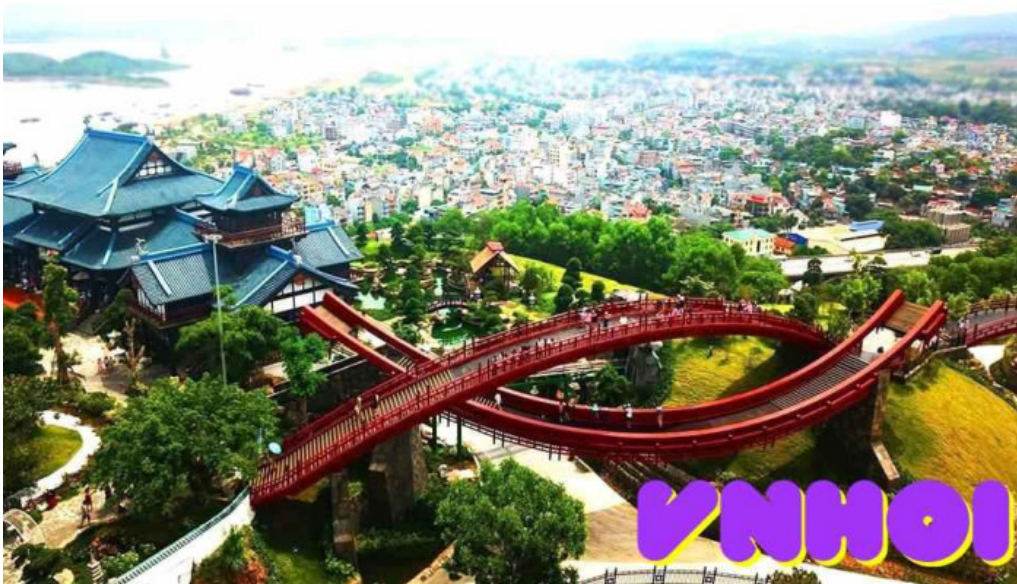
Công viên ?i d??ng h? long complex qu?ng ninh