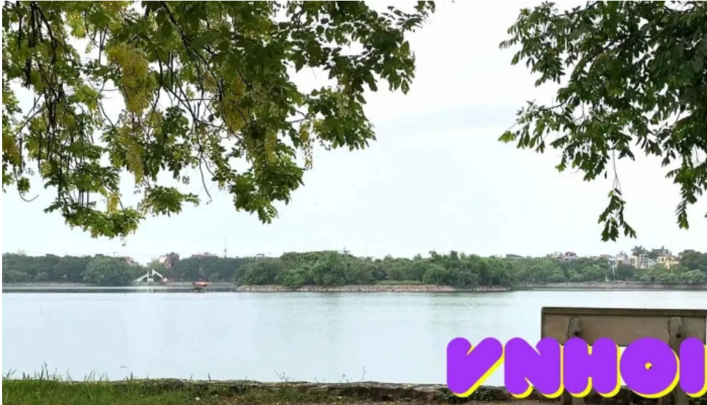
Cong vien nam hoa video