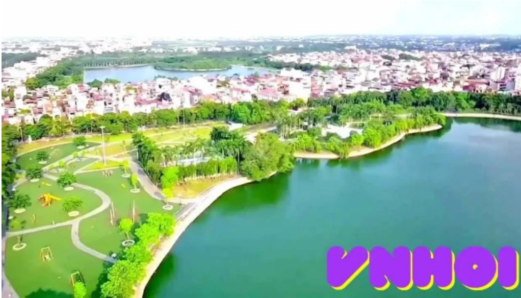
Cong vien nam hoa moi nhat