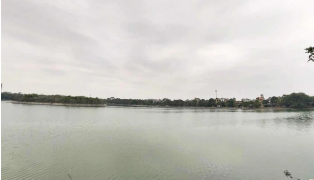
Cong vien nam hoa che do xem pho va 360