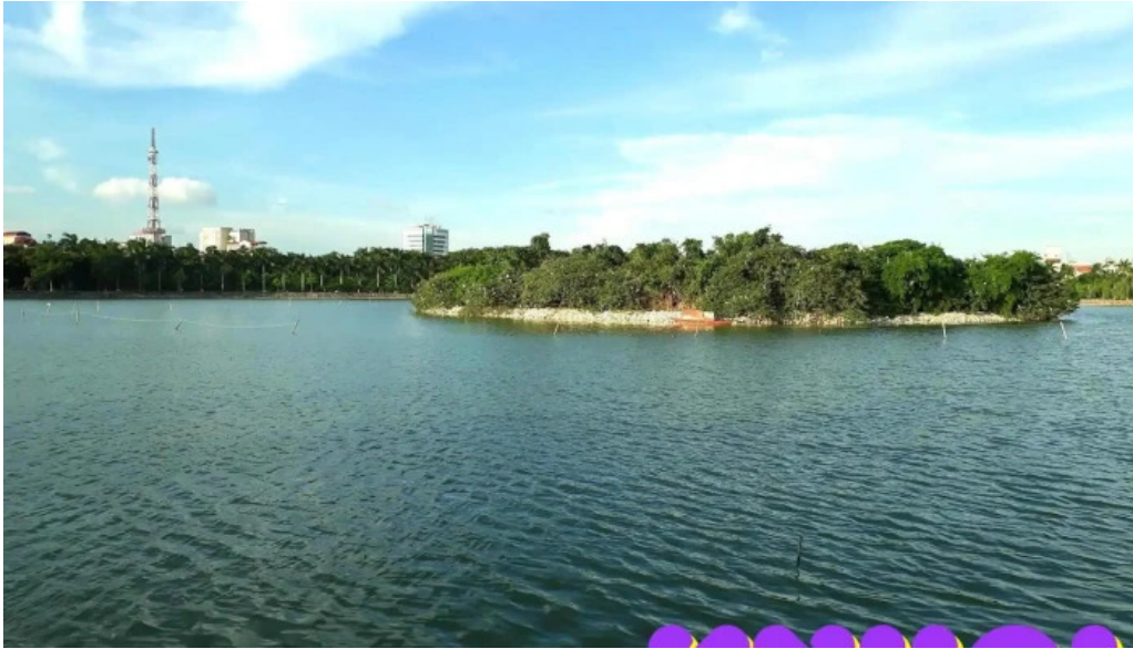
Cong vien nam hoa dao co