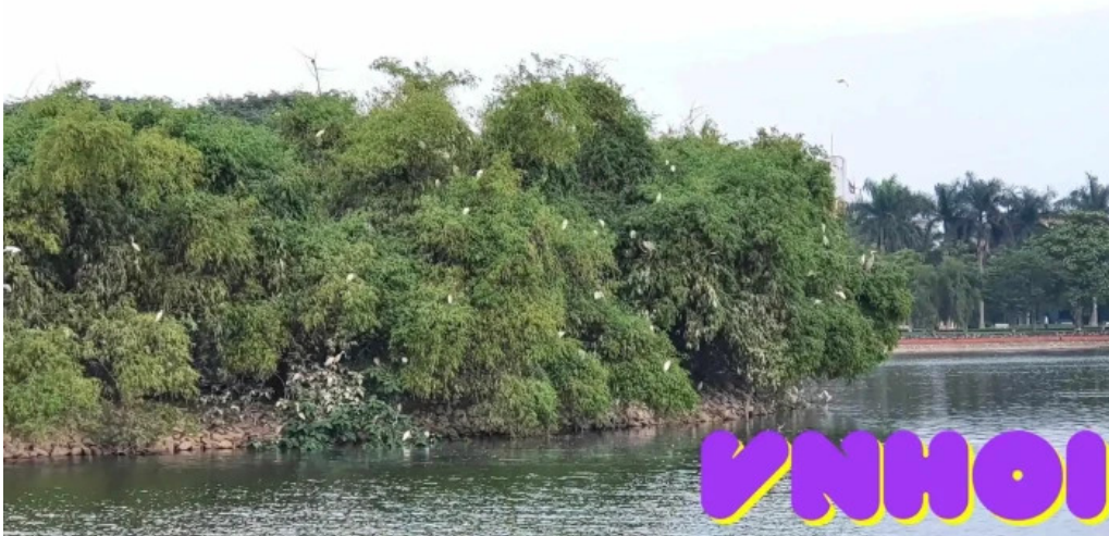
Cong vien nam hoa tat ca