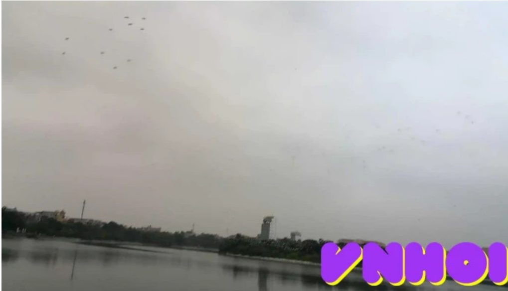
Cong vien nam hoa ban dao nam hoa