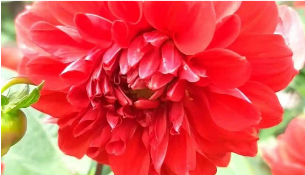
Cong vien nam hoa cua chu so huu