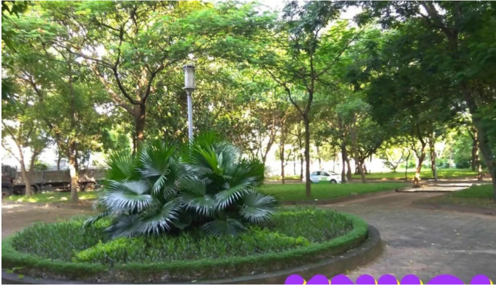
Cong vien tuoi tho tat ca