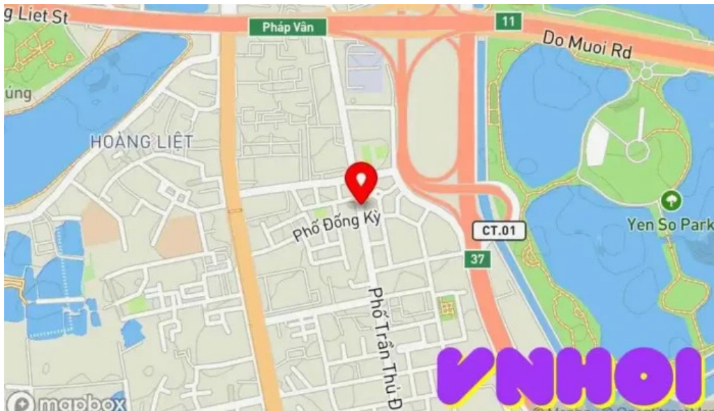
Cong vien tuoi tho b?n ??