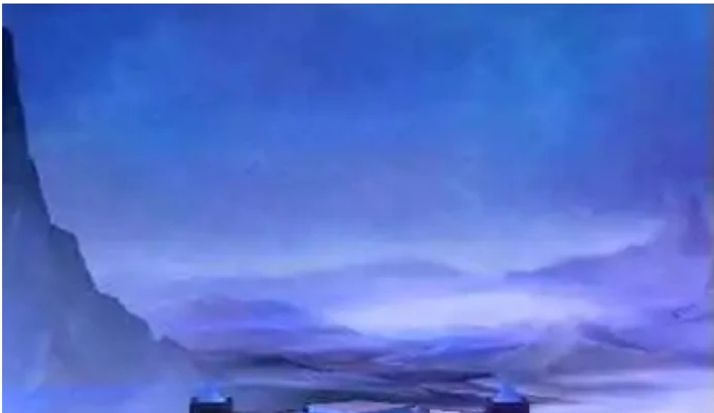
Cong vien tuoi tho video