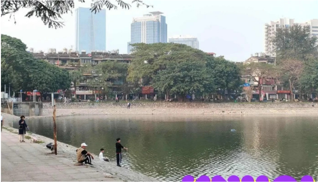
Cong vien indira gandhi moi nhat