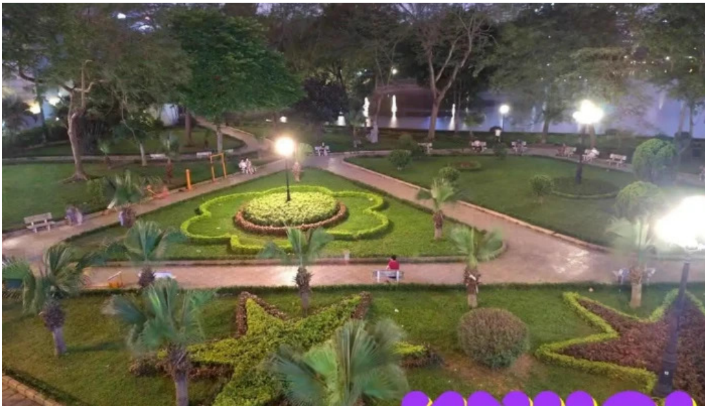
Cong vien indira gandhi ha n?i