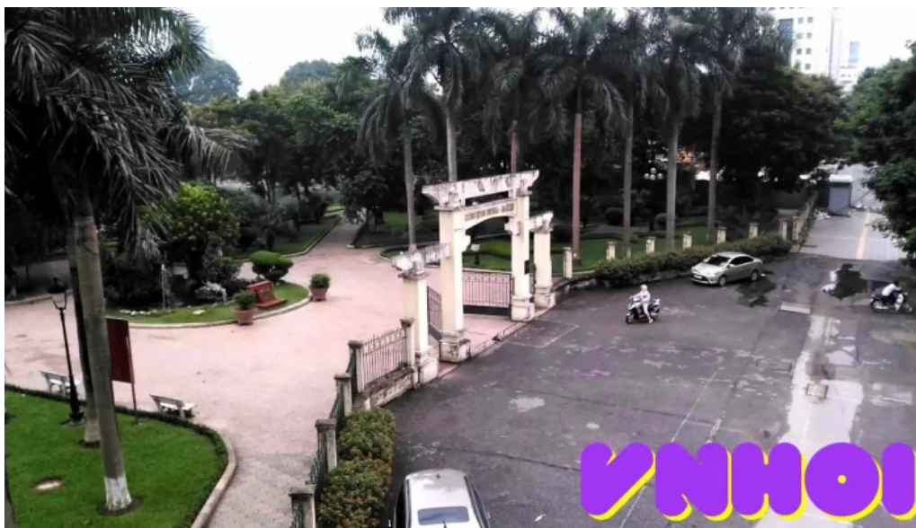
Cong vien indira gandhi video