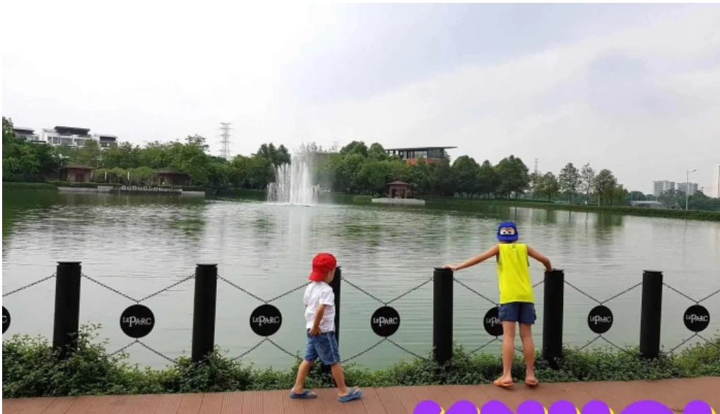
Cong vien indira gandhi gamuda land