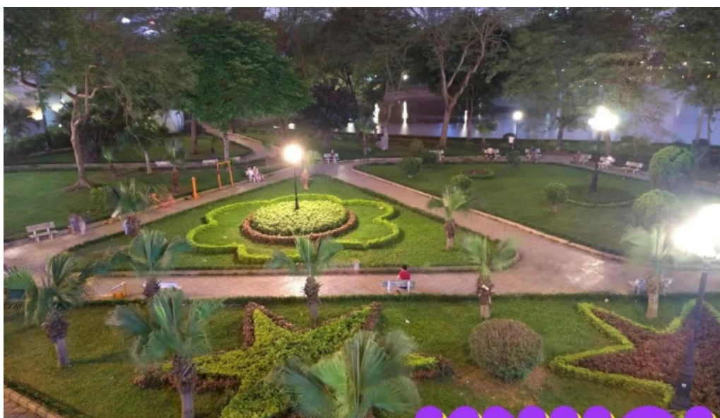
Cong vien indira gandhi tat ca