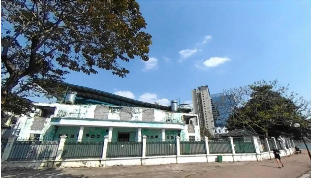
Cong vien indira gandhi che do xem pho va 360deg