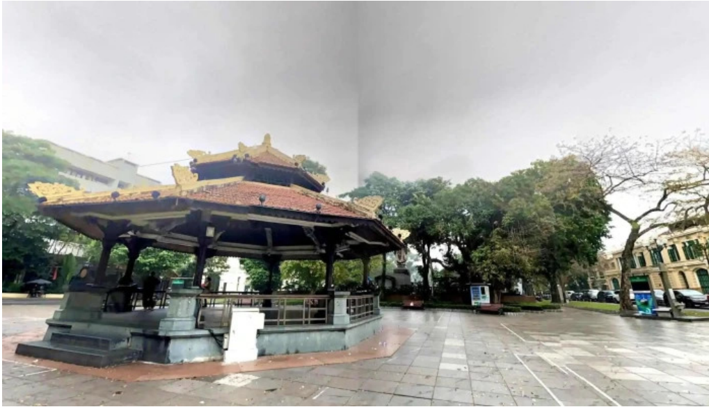
Vuon hoa ly thai to che do xem pho va 360deg