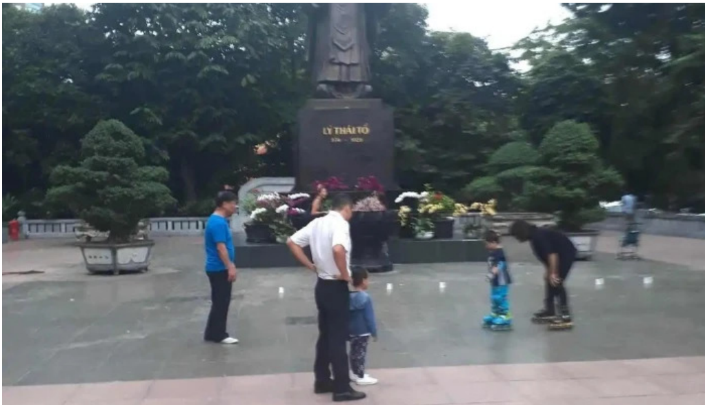
Vuon hoa ly thai to tieu khien