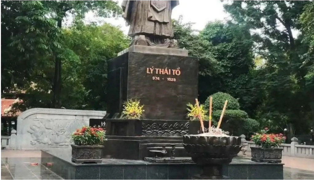
Vuon hoa ly thai to video