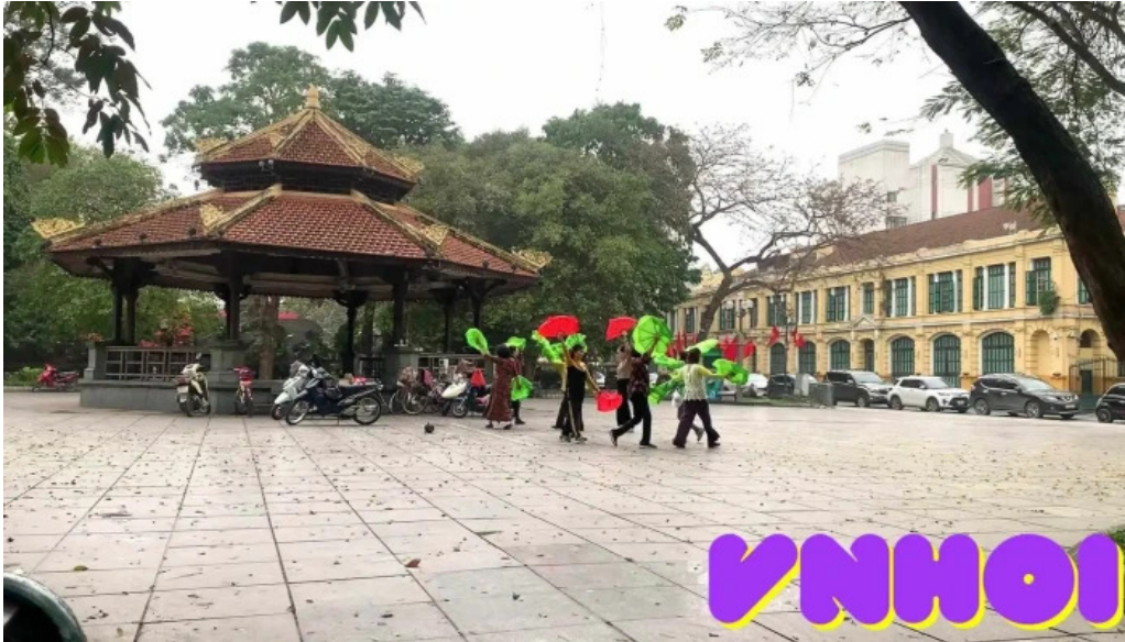
Vuon hoa ly thai to moi nhat