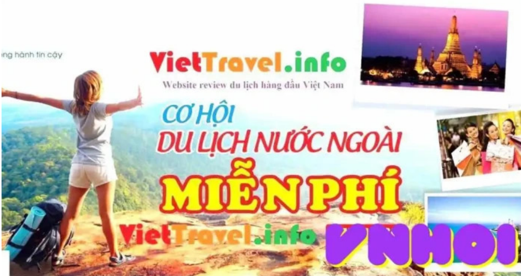
Vuon hoa ly thai to cua chu so huu