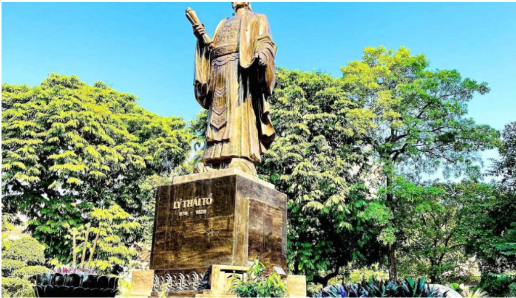
Vuon hoa ly thai to tat ca