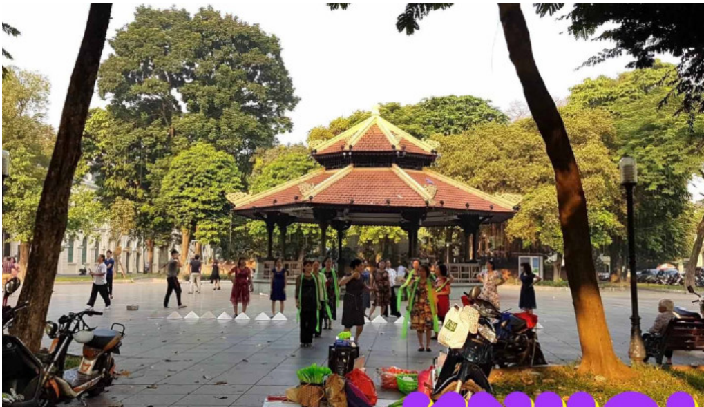
Vuon hoa ly thai to nha bat giac ho guom