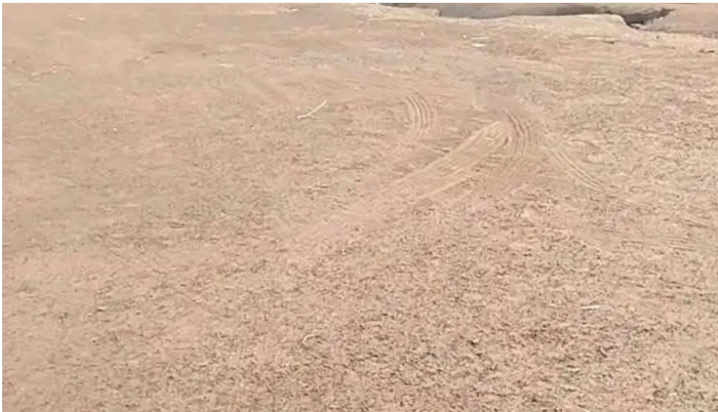
Doi cuu suoi nghe moi nhat