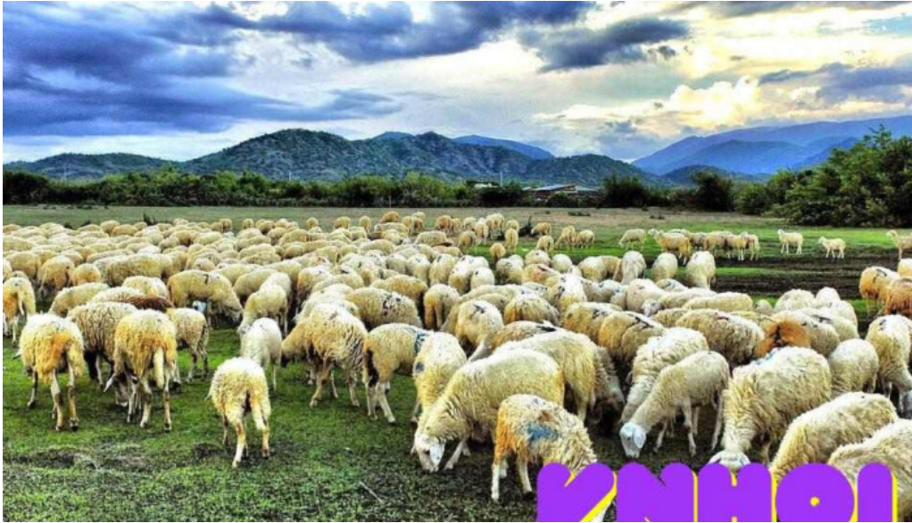
Doi cuu suoi nghe nui