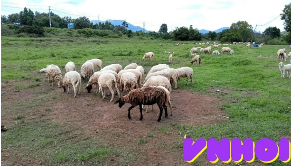
Doi cuu suoi nghe video