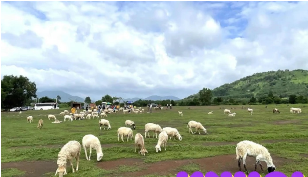
Doi cuu suoi nghe tat ca