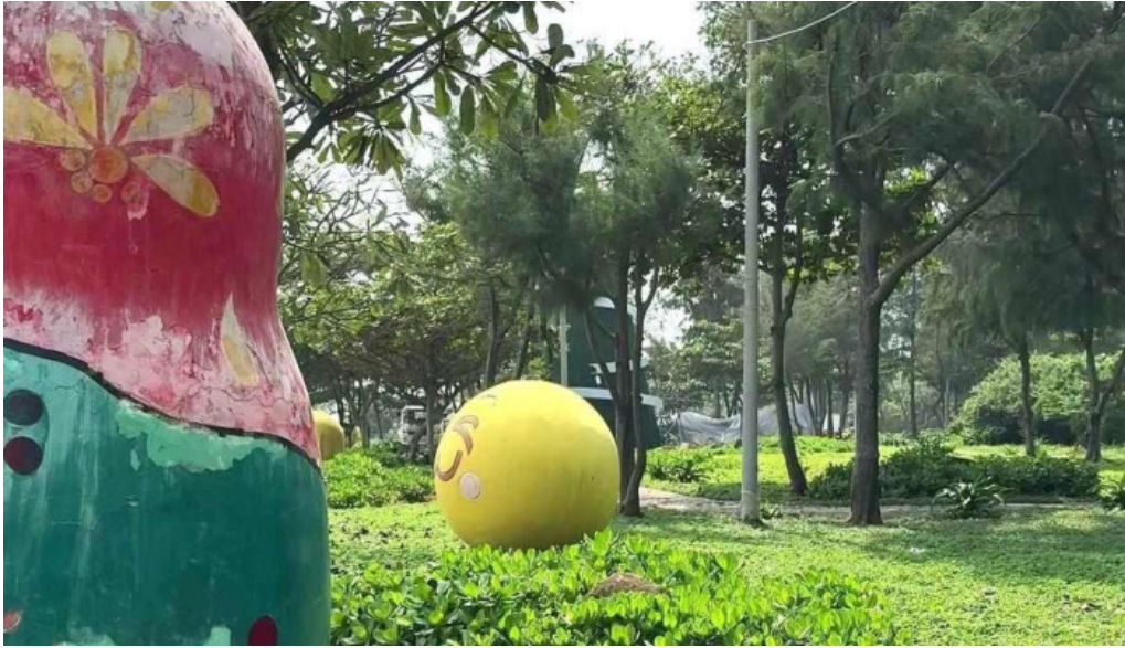
Cong vien tao phung video