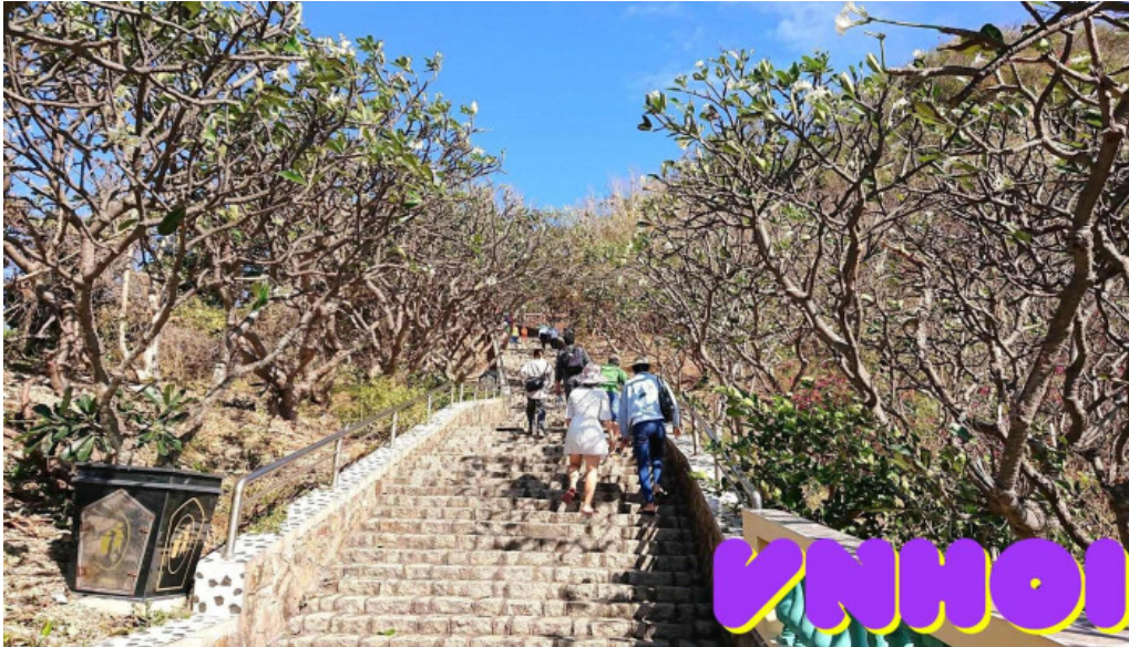
Công viên tạo phong ba r?a v?ng tau