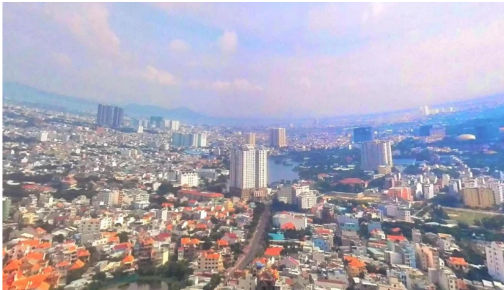
Cong vien tao phung che do xem pho va 360deg