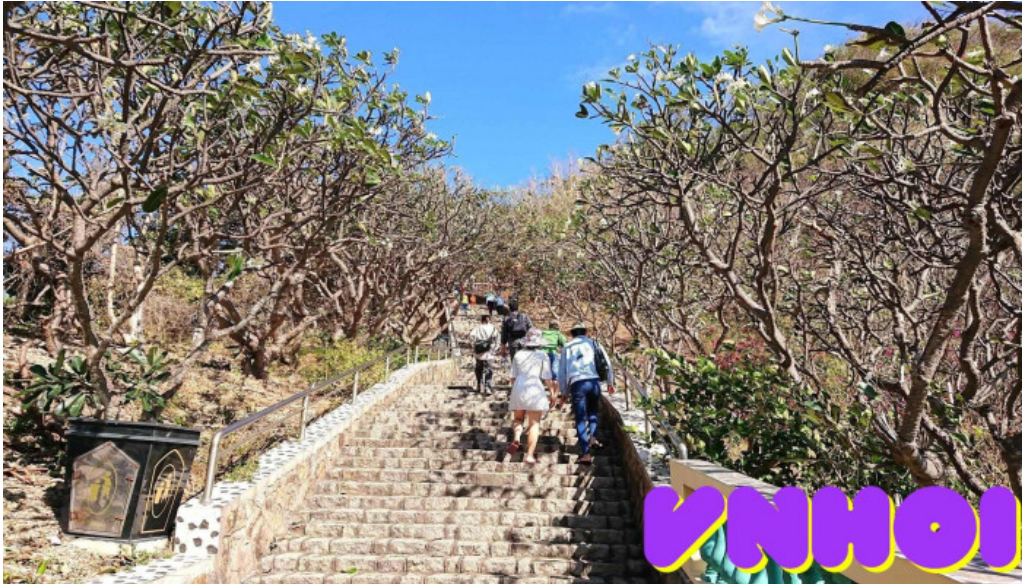
Cong vien tao phung tat ca