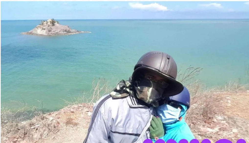
Cong vien tao phung tieu khien