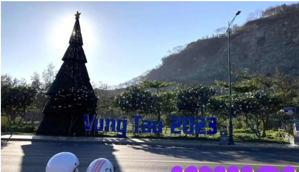
Cong vien tao phung nui