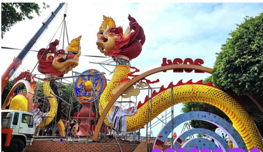
Cong vien tam giac tat ca