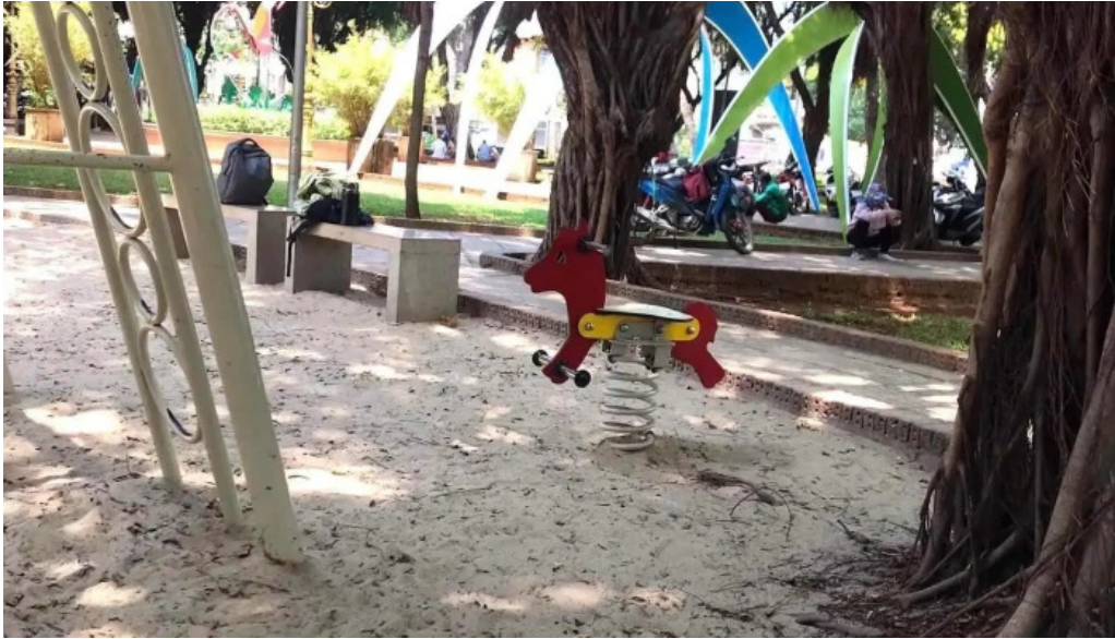
Cong vien tam giac moi nhat