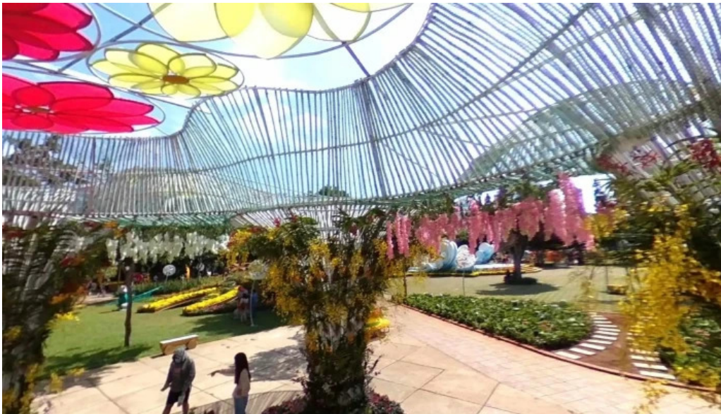
Cong vien tam giac che do xem pho va 360deg