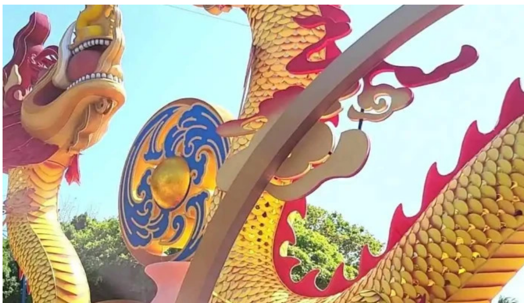
Cong vien tam giac video