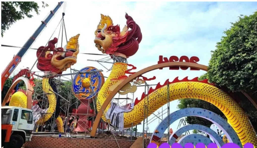
Cong vien tam giac ba r?a v?ng tau