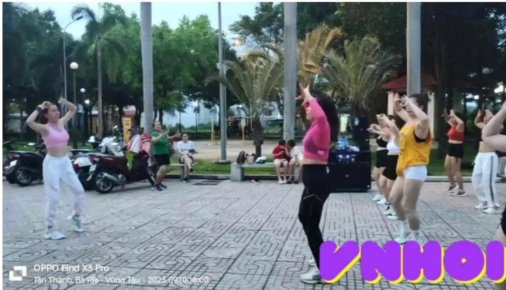
Cong vien phu my video