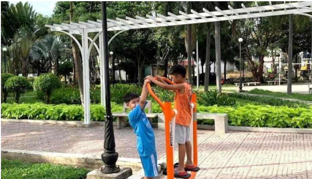
Cong vien phu m? ba r?a v?ng tau