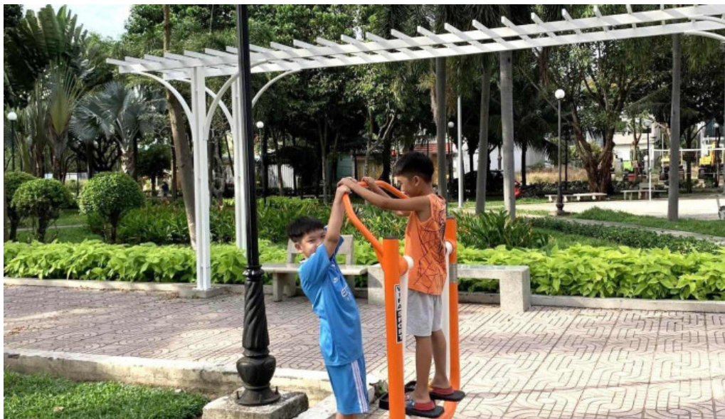
Cong vien phu my tat ca