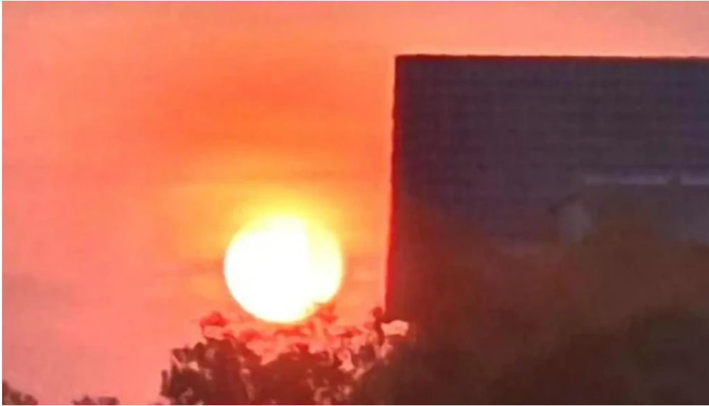
Cong vien bo ho ba to moi nhat