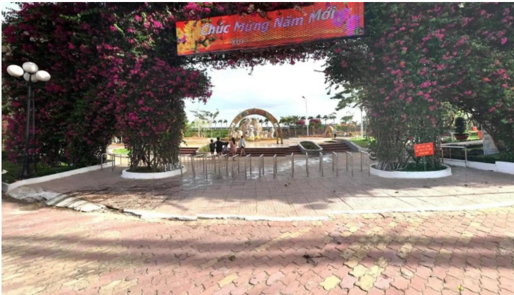
Cong vien bo ho ba to che do xem pho va 360deg