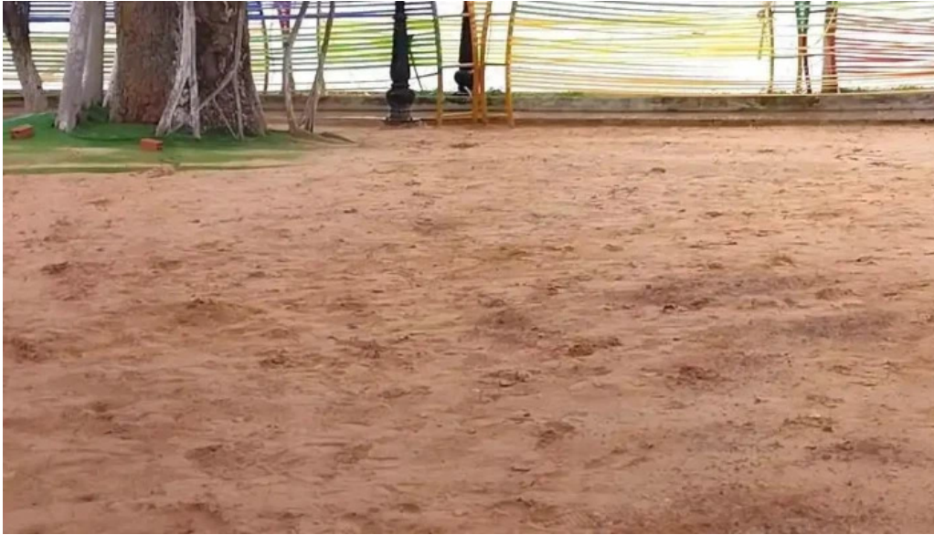
Cong vien bo ho ba to video