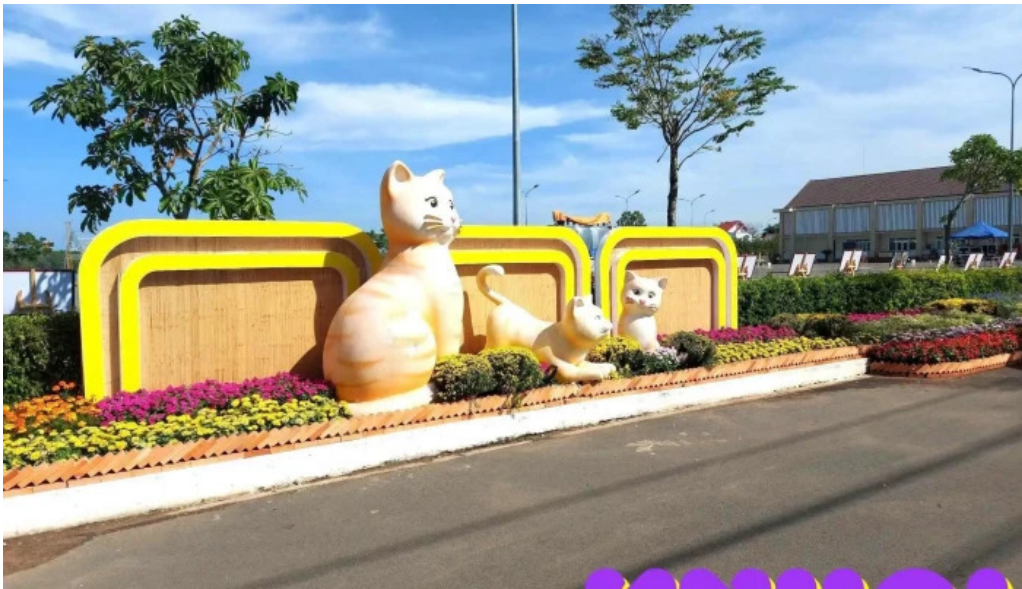
Cong vien bo ho ba to tat ca