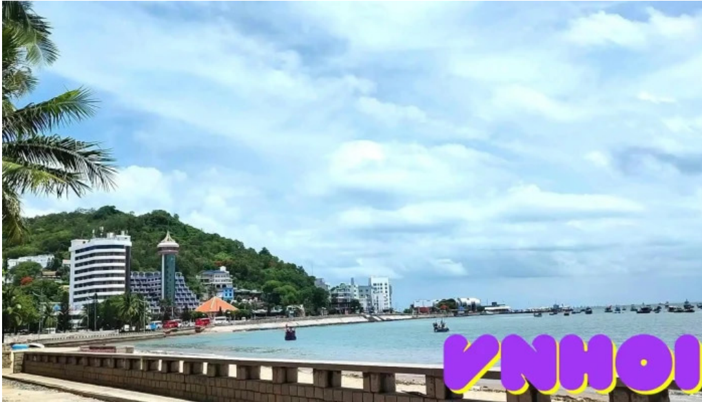
Cong vien bai truooc bai bien