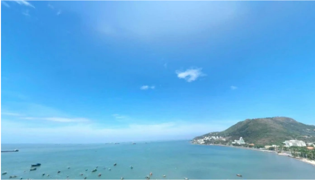
Cong vien bai truo che do xem pho va 360deg