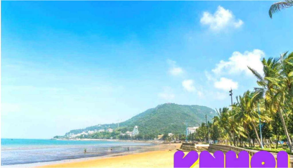
Cong vien bai truoC tat ca