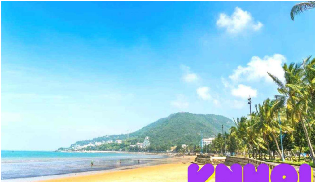
Cong vien bai tr??c ba r?a v?ng tau