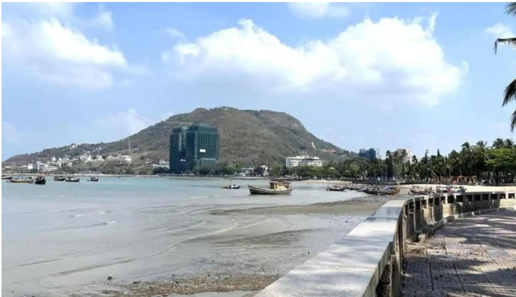
Cong vien bai truoC moi nhat