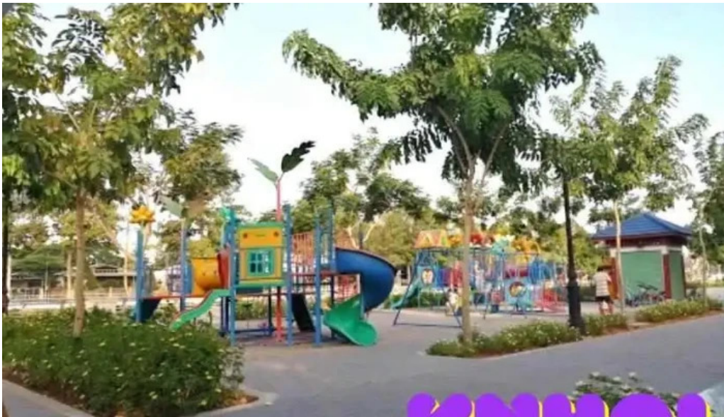
Cong vien hai ba trung thanh pho cao lanh tat ca