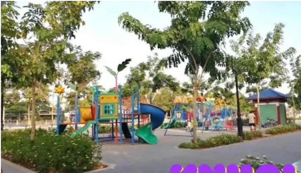
Cong vien hai ba tr?ng thanh ph? cao lanh ??ng thap