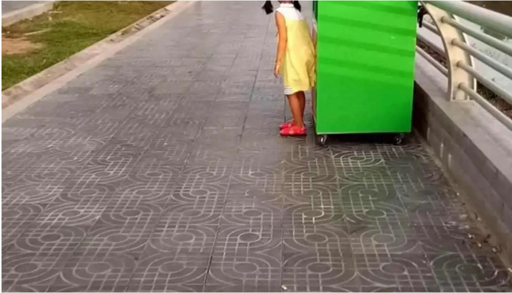
Cong vien hai ba trung thanh pho cao lanh video