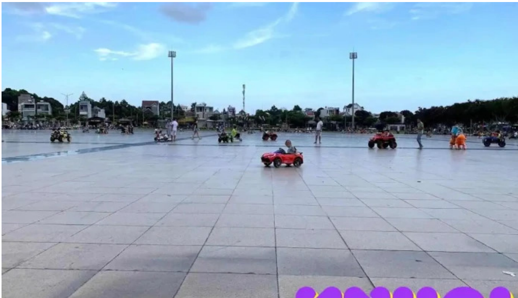
Qu?ng tr??ng cong vien ba r?a ba r?a v?ng tau