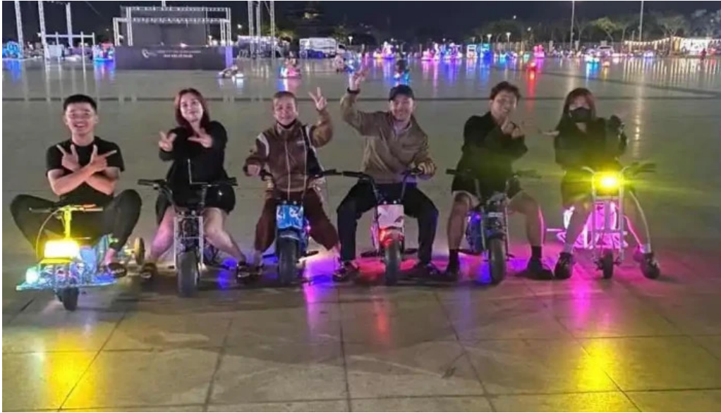
Quang trung cong vien ba ria moi nhat