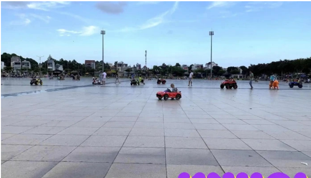
Quang truong cong vien ba ria tat ca