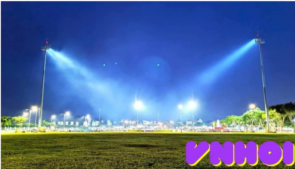
Quang trung cong vien ba ria cua chu so huu