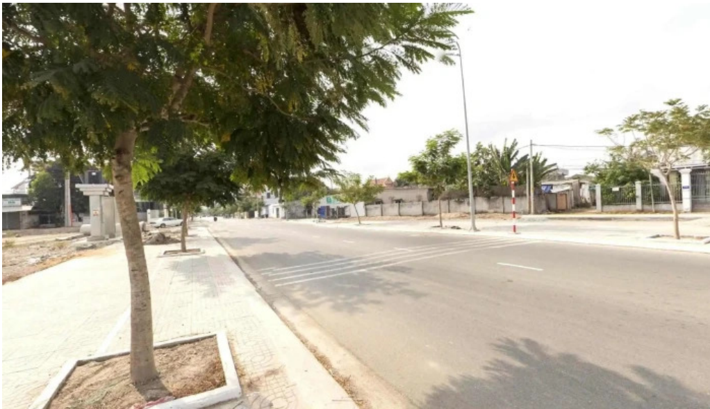
Quang truong cong vien ba ria che do xem pho va 360deg