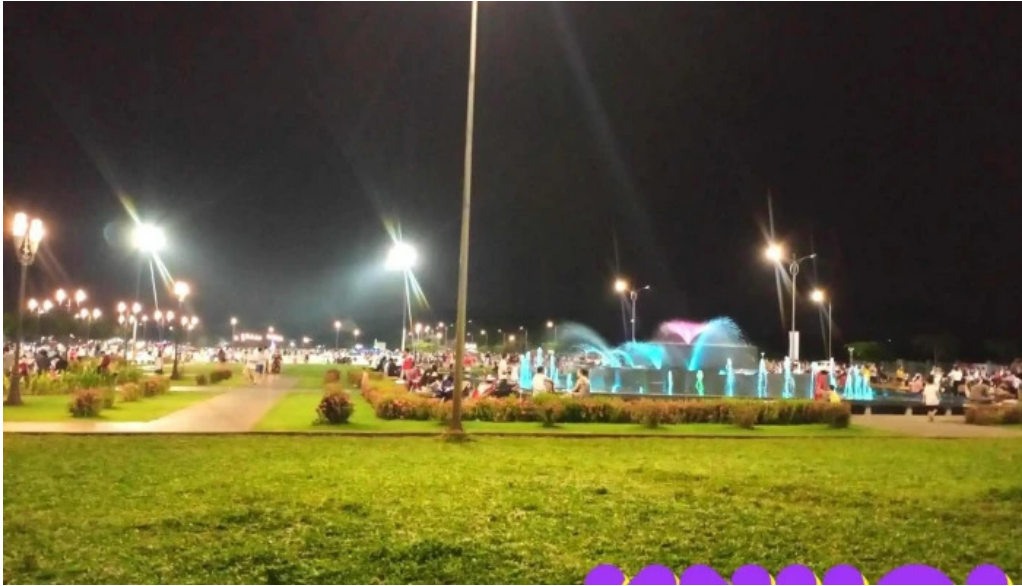
Quang truong cong vien ba ria cong vien