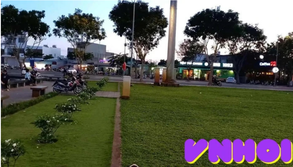
Quang truong cong vien ba ria video