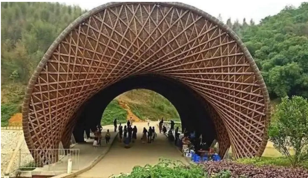
Cong vien sinh thai tre lu?ng thanh tam cong ty cp mia ???ng lam s?n thanh hoa