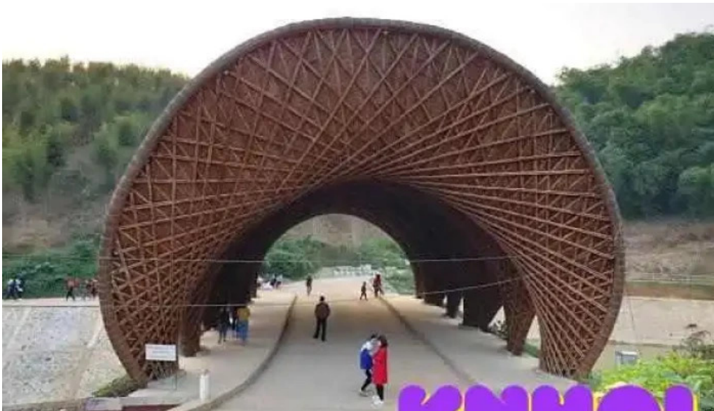
Cong vien sinh thai tre luong thanh tam cong ty cp mia duong lam son cua chu so huu