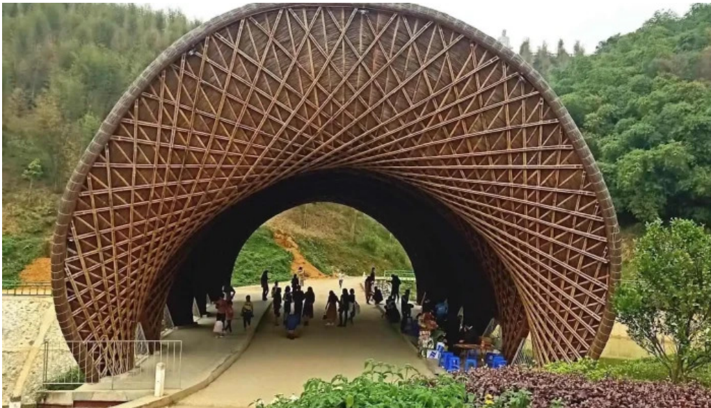
Cong vien sinh thai tre luong thanh tam cong ty cp mia duong lam son tat ca