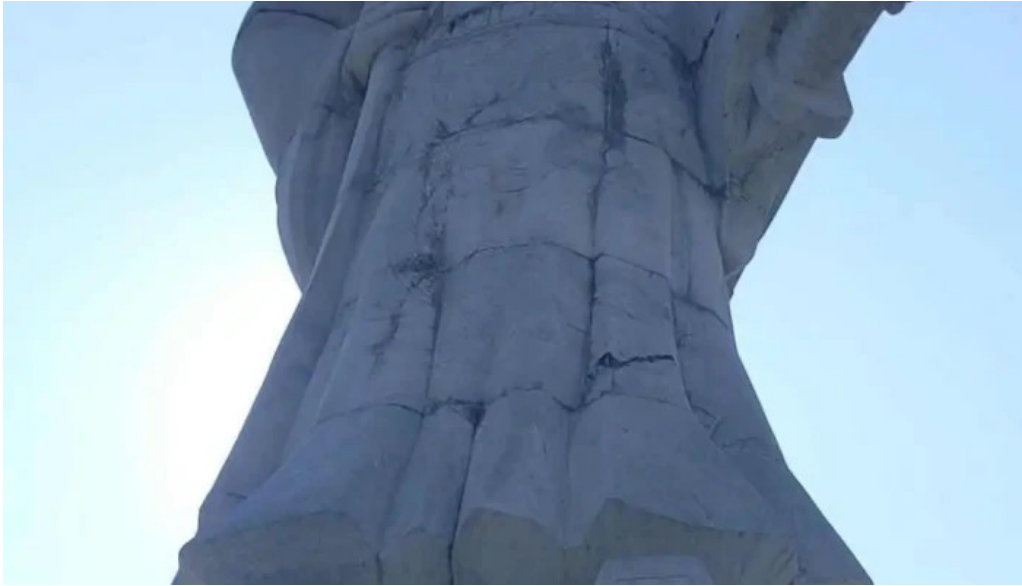
Cong vien sinh thai tre luong thanh tam cong ty cp mia duong lam son video