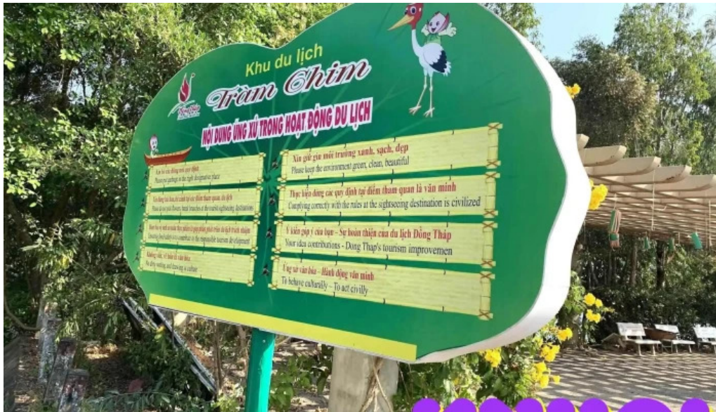
Khu du lịch tràm chim đồng tháp ban do cơ sở lưu trú