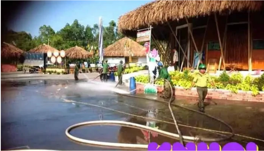
Khu du lịch tram chim ??ng thap ??ng thap