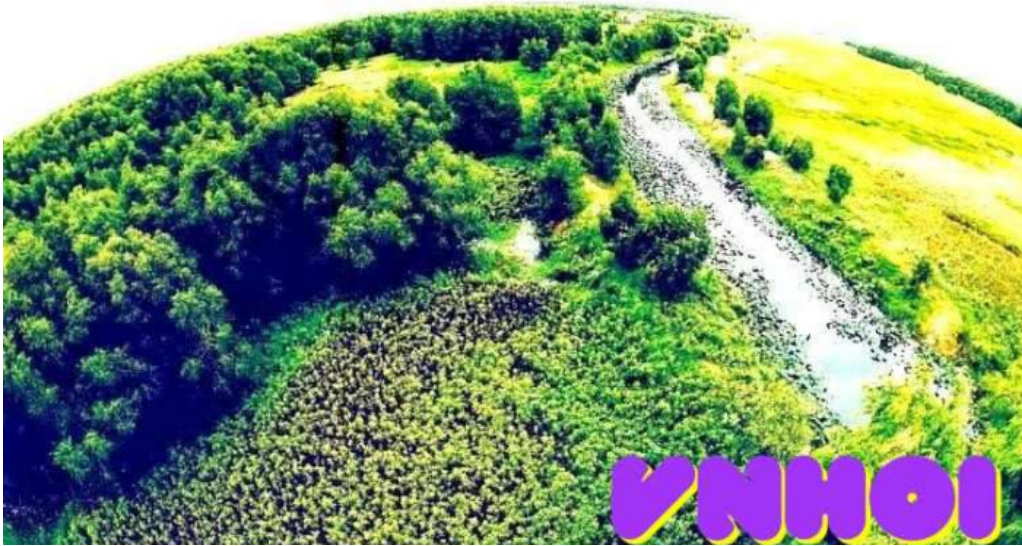
Khu du lịch tram chim dong thap cua chu so huu