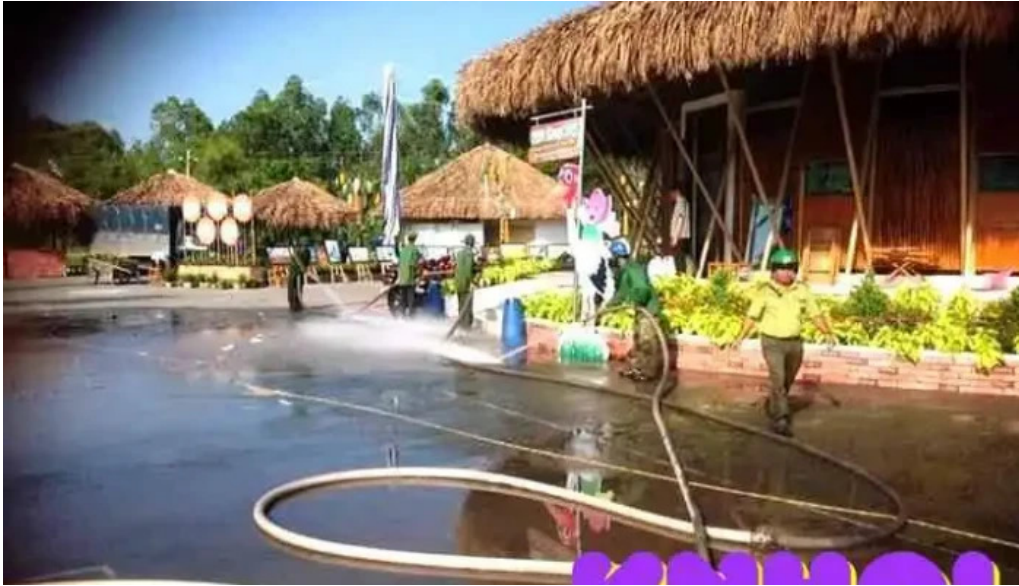
Khu du lịch tràm chim đồng tháp tát ca