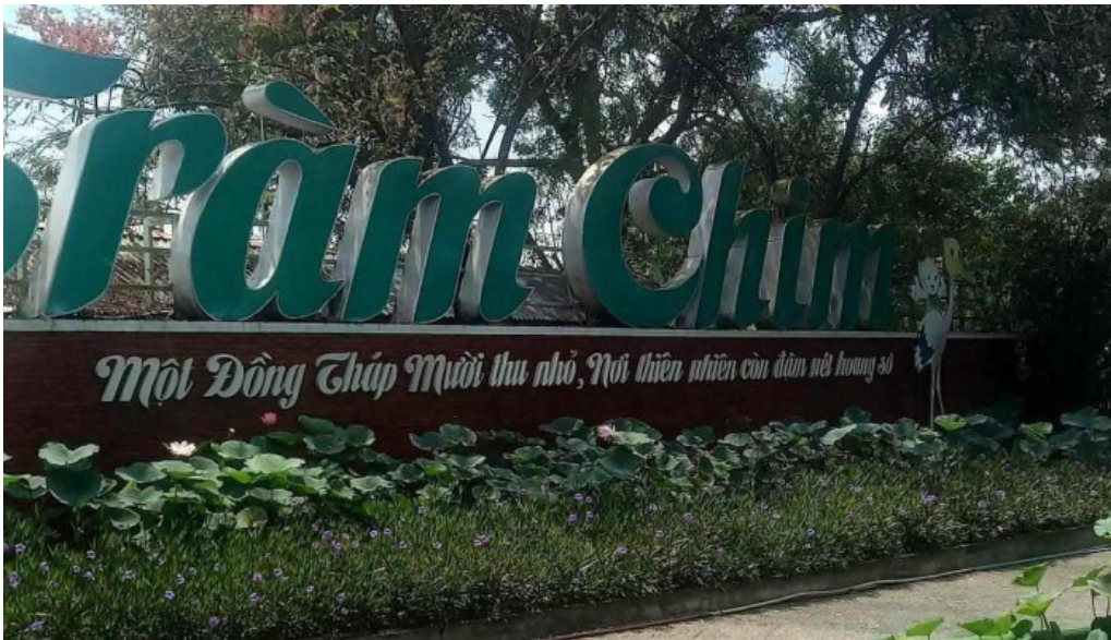
Khu du lịch tràm chim đồng tháp mọi nhat