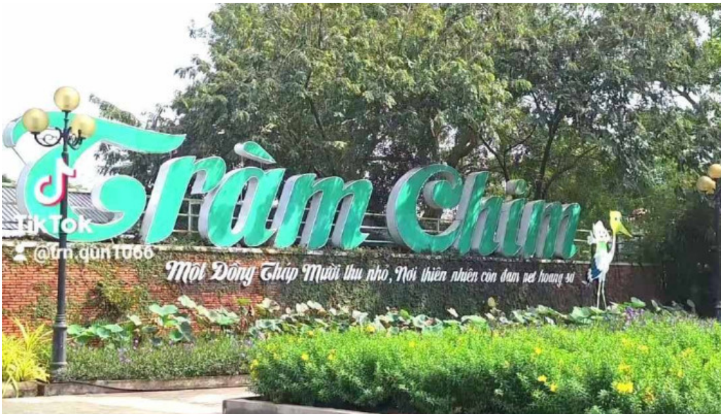
Khu du lịch tram chim dong thap video