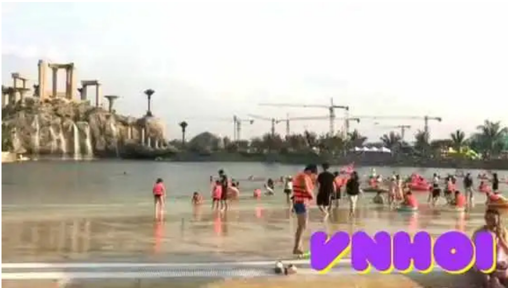
Cong vien nuoc royal wave park video