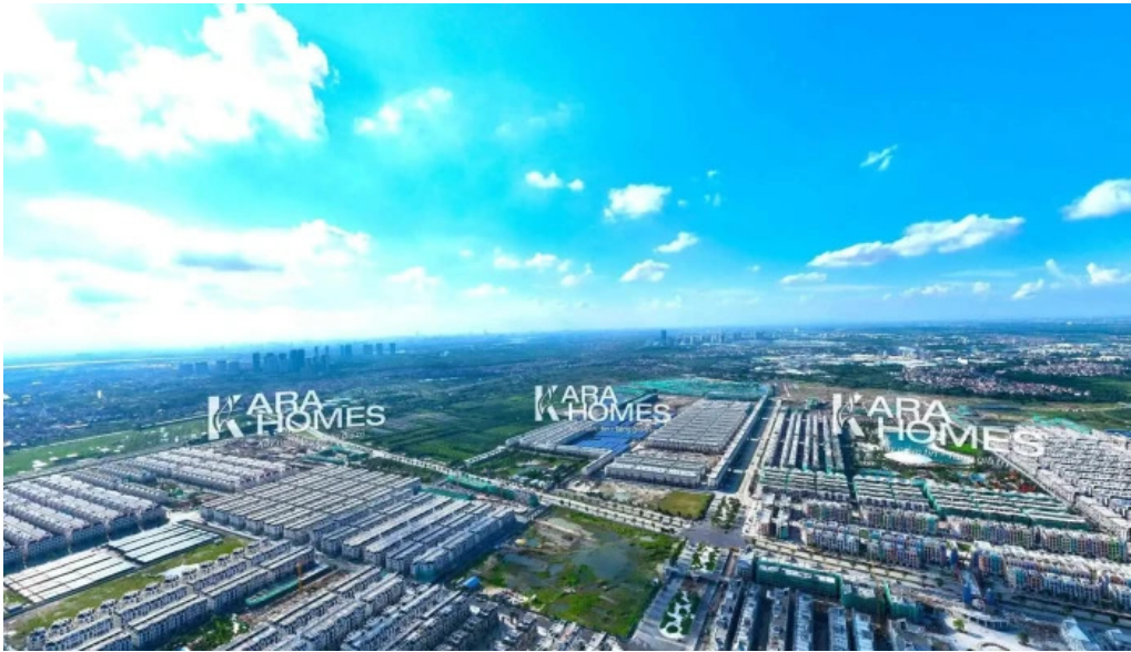
Cong vien nuoc royal wave park che do xem pho va 360deg

Cong vien nuoc royal wave park cong vien nuoc