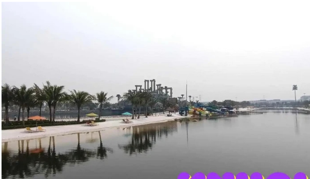
Cong vien n??c royal wave park h?ng yen