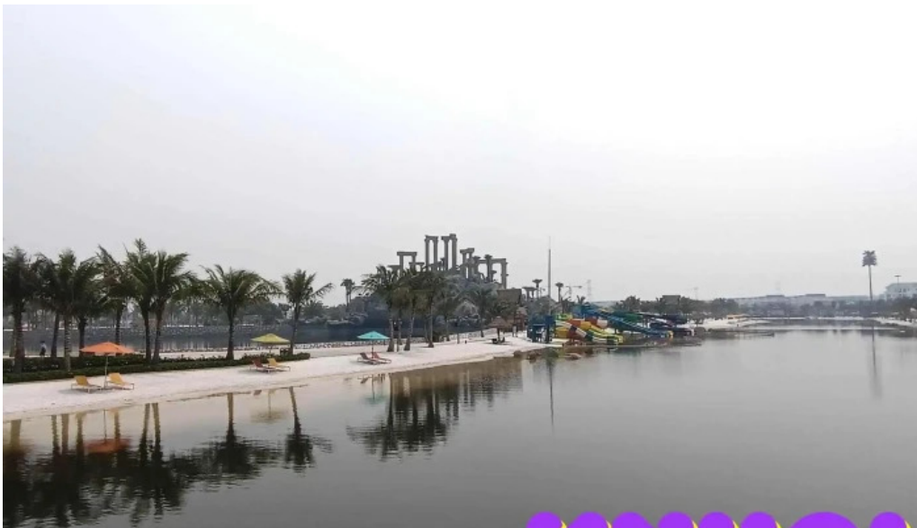
Cong vien nuoc royal wave park tat ca