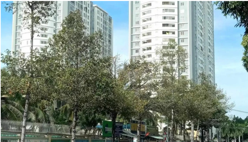
Cong vien nuoc vung tau moi nhat