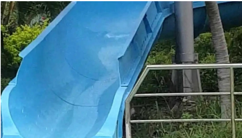
Công viên nước Vũng Tàu video