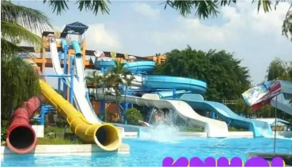
Cong vien nuoc vung tau tat ca