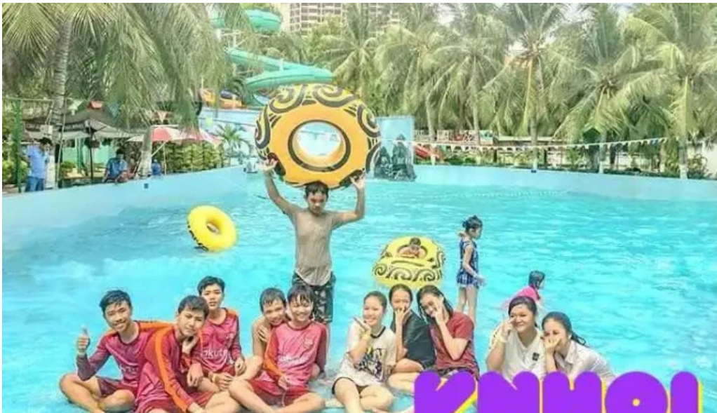
Cong vien nuoc vung tau cong vien nuoc