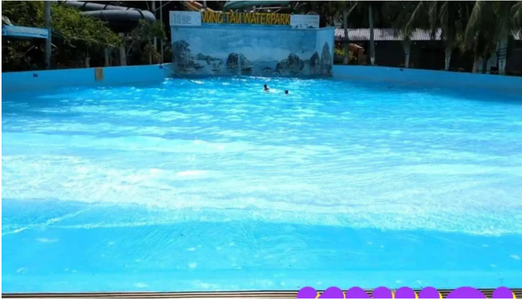
Cong vien nuoc vung tau ho boi