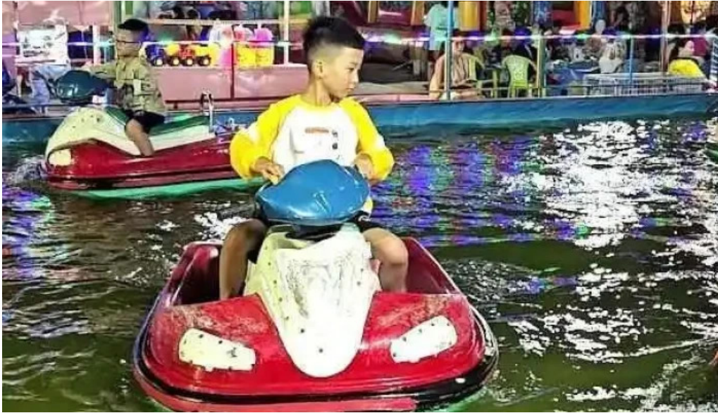
Công viên thú rừng ba rịa vũng tau