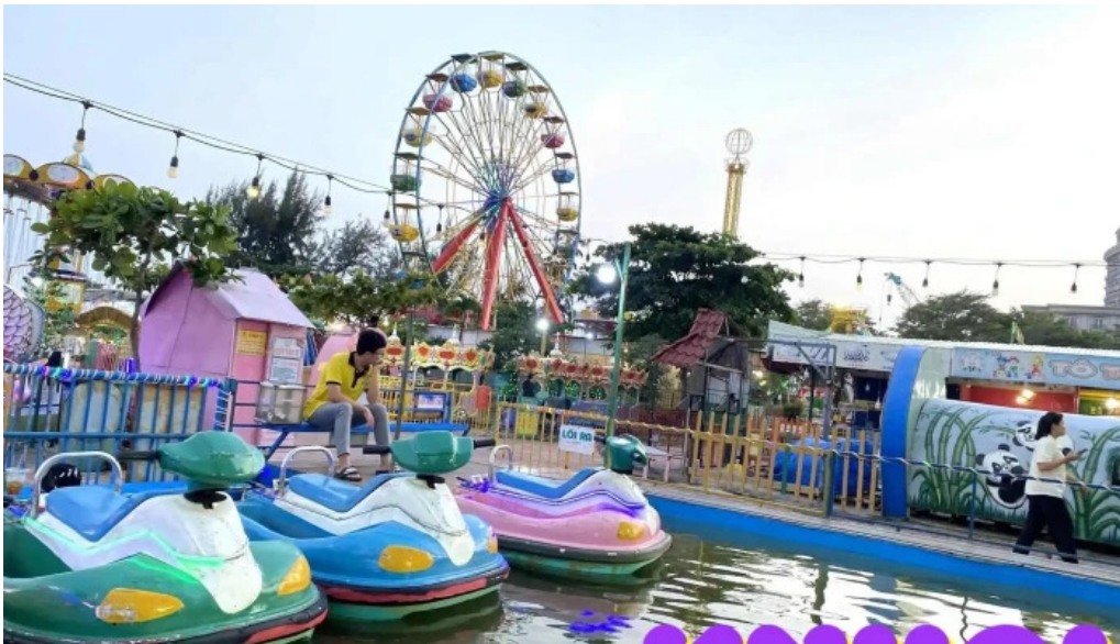
Công viên thơ trang vòng đu quay