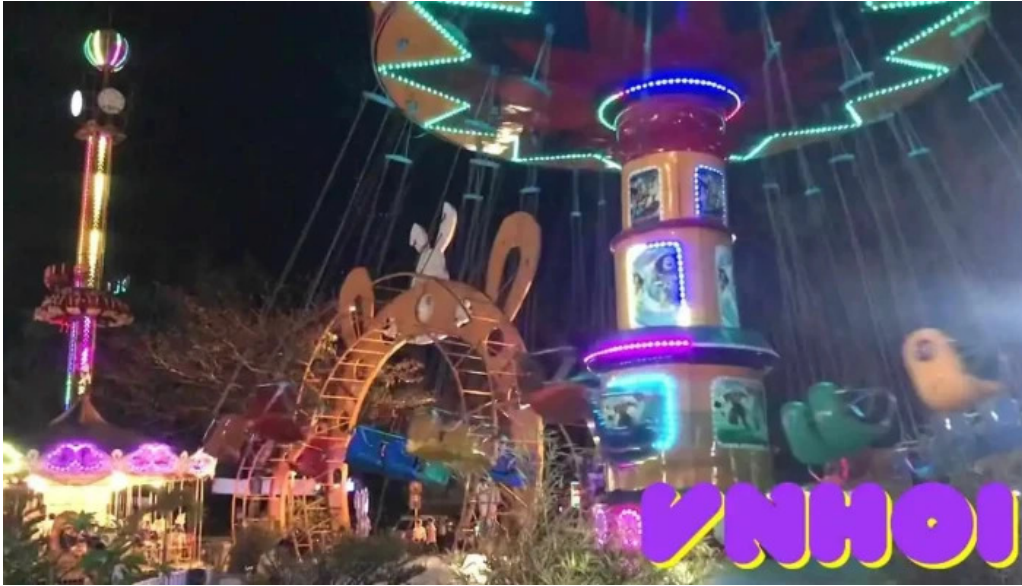
Cong vien tho trang video