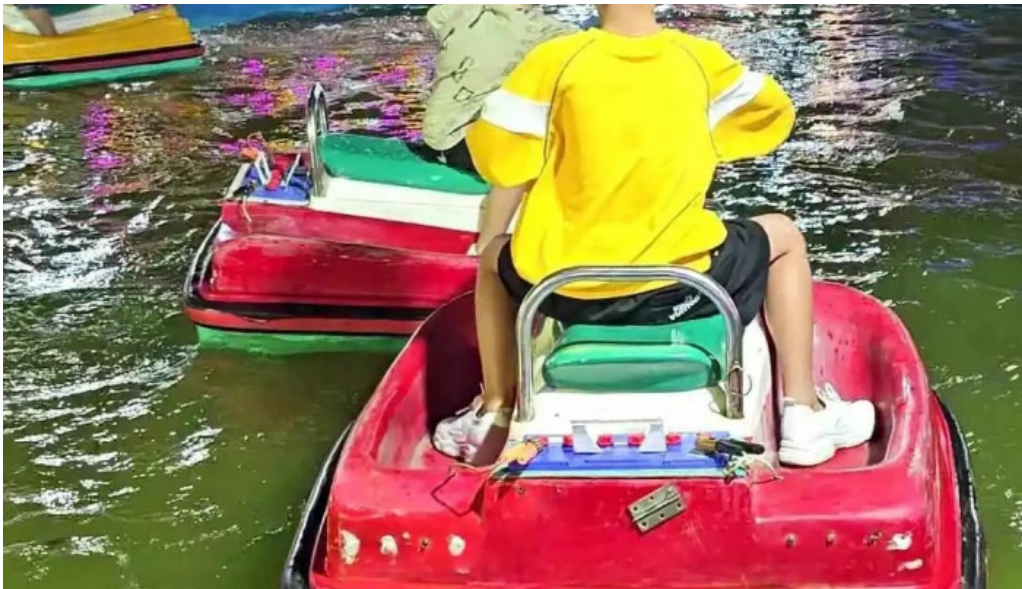
Cong vien tho trang tat ca