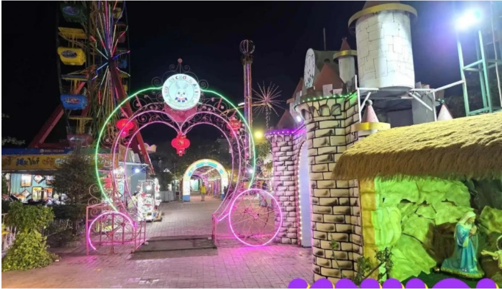
Cong vien tho trang moi nhat