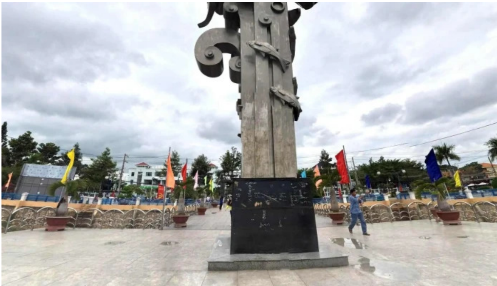
Cong vien 304 che do xem pho va 360deg