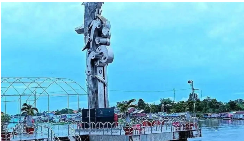
Cong vien 304 tat ca