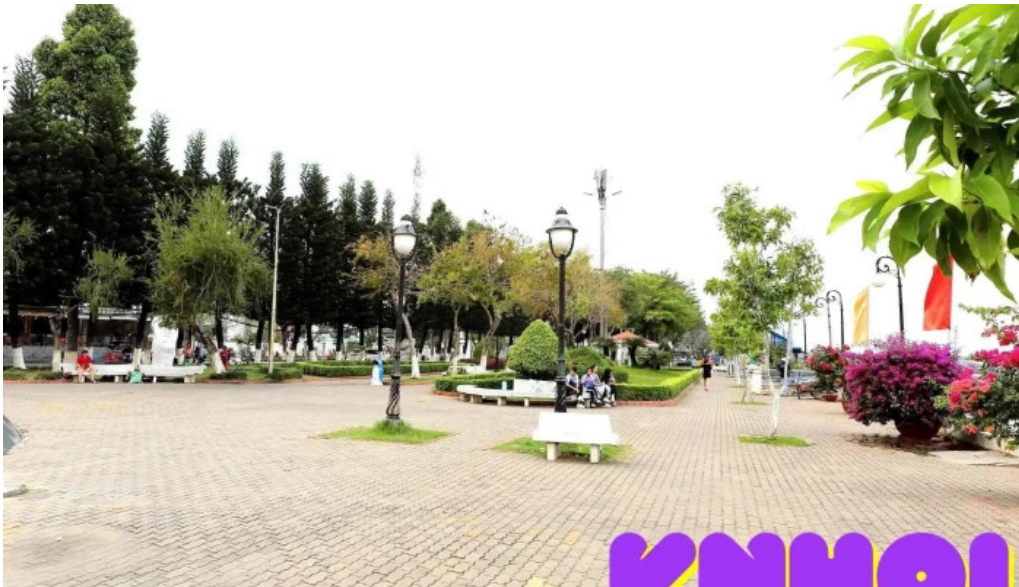
Cong vien 304 moi nhat