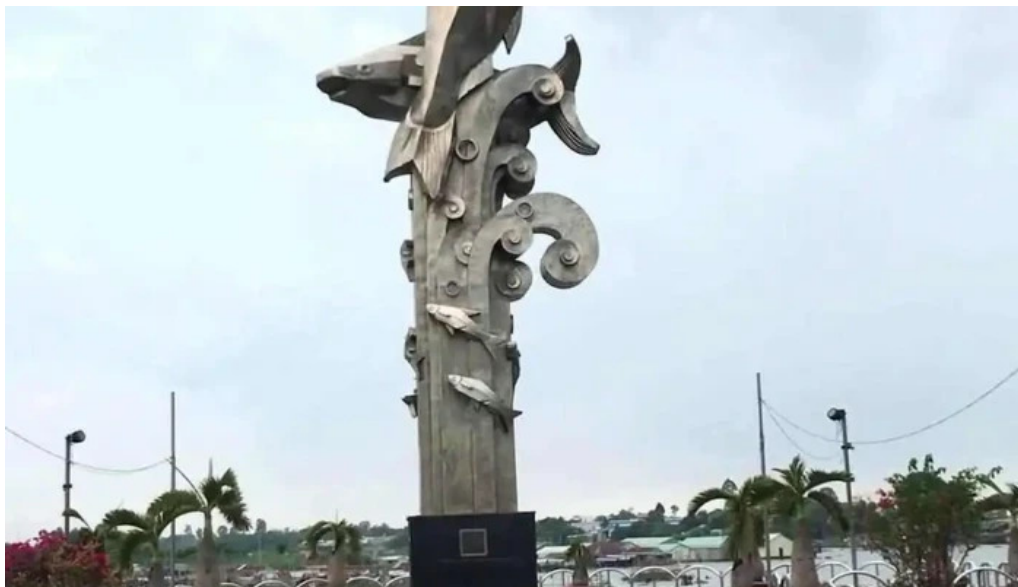
Cong vien 304 video