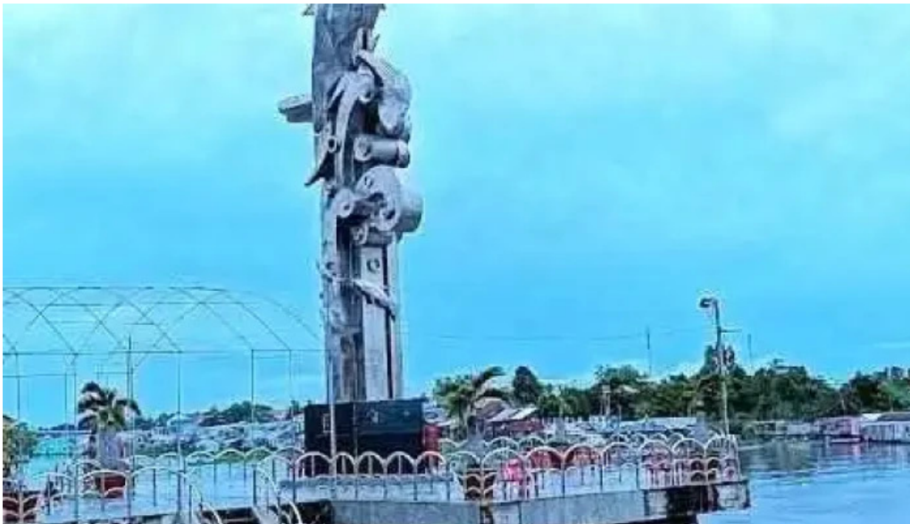
Công viên 30 4 an giang