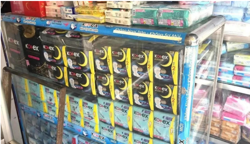
Cho lap vo moi nhat