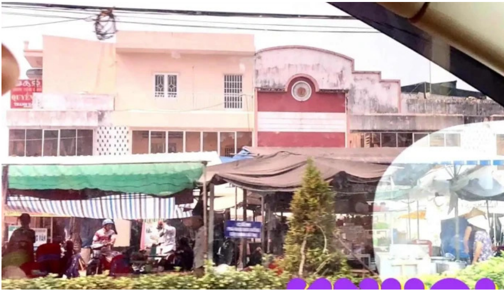
Ch? l?p vò ??ng thap