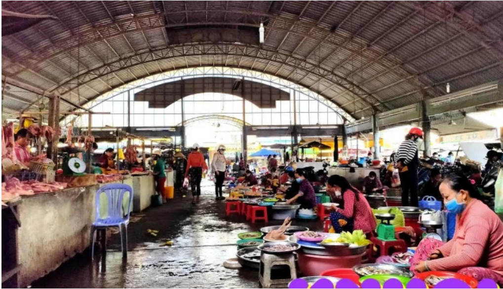
Cho lap vo khong gian ben trong