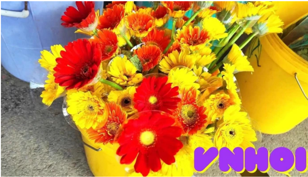
Cho lap vo tat ca