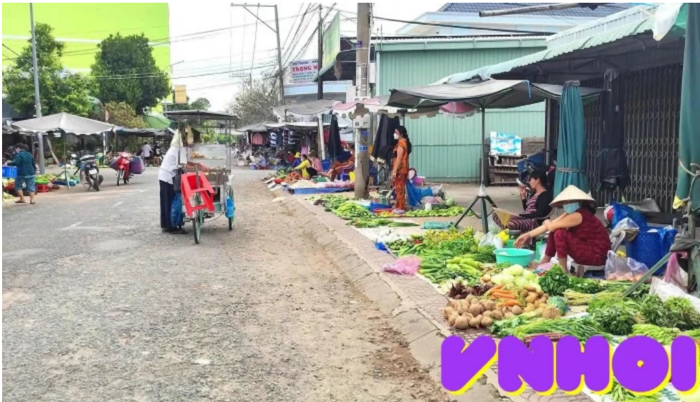
Cho lap vo video