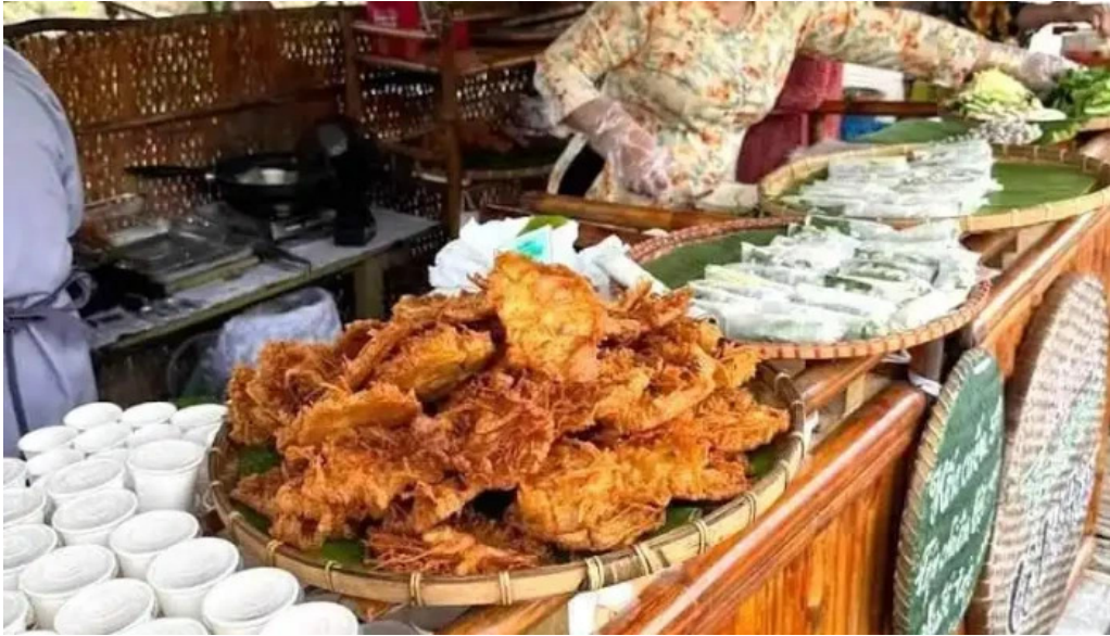
Ch? cu lao tan thu?n ?ong ??ng thap