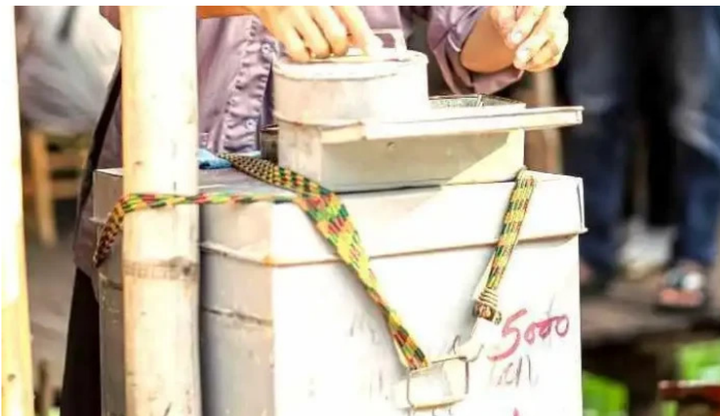
Cho cu lao tan thuan dong khong gian ben trong