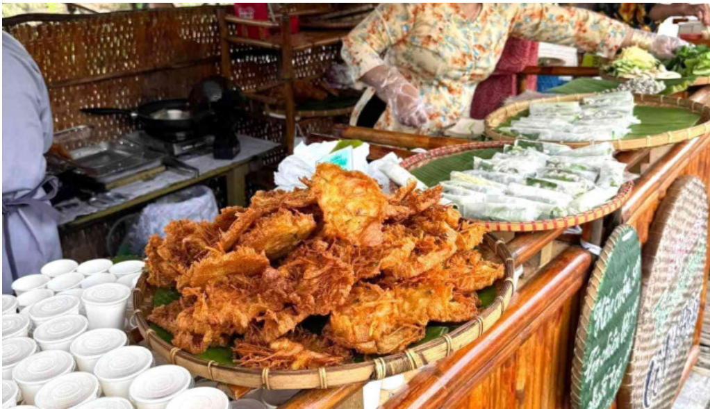
Cho cu lao tan thuan dong tat ca