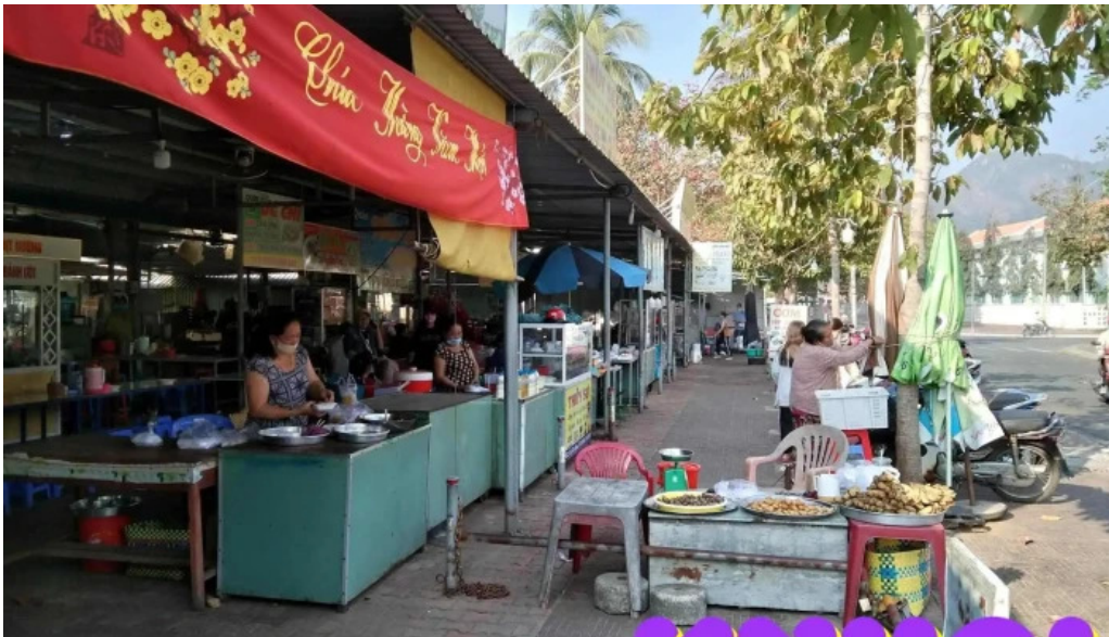
Cho con dao khong gian ben trong