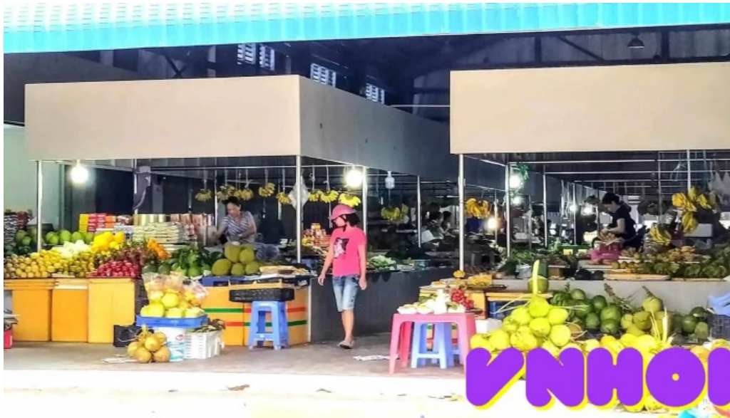
Cho con dao thuc pham