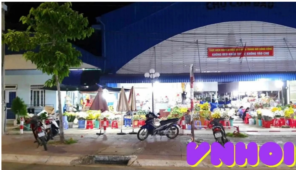
Cho con dao tat ca