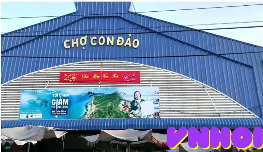
Cho con dao video