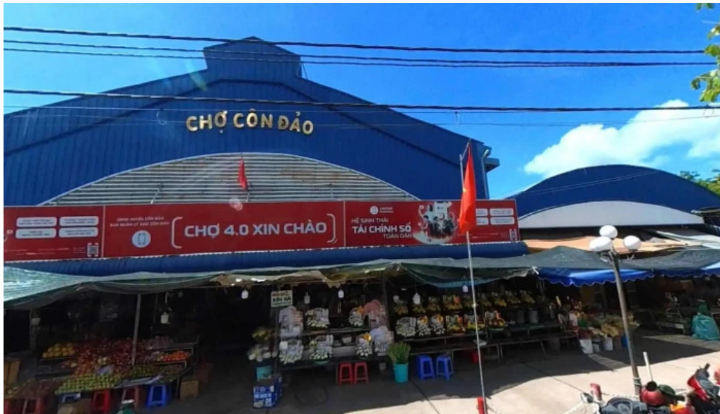
Cho con dao che do xem pho va 360deg