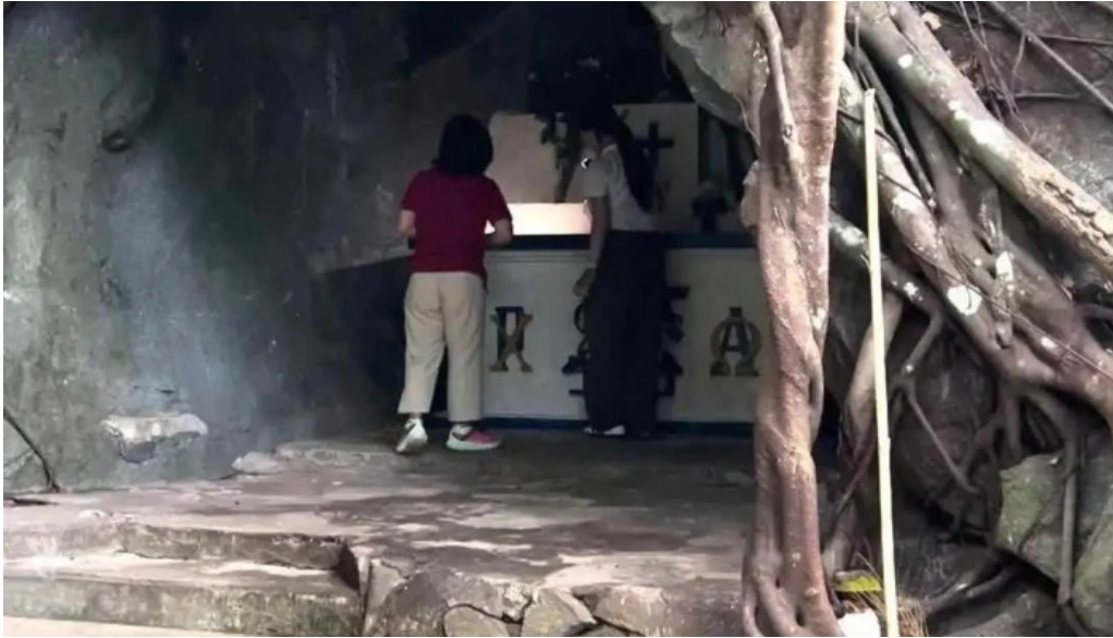
Cho con dao moi nhat