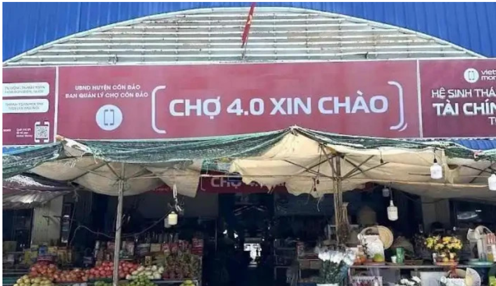
Chợ con đảo ba rùa vũng tau