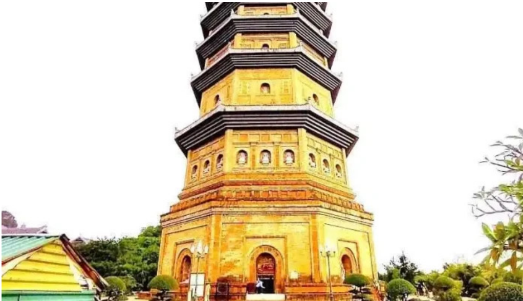
Thap bao thien ninh binh