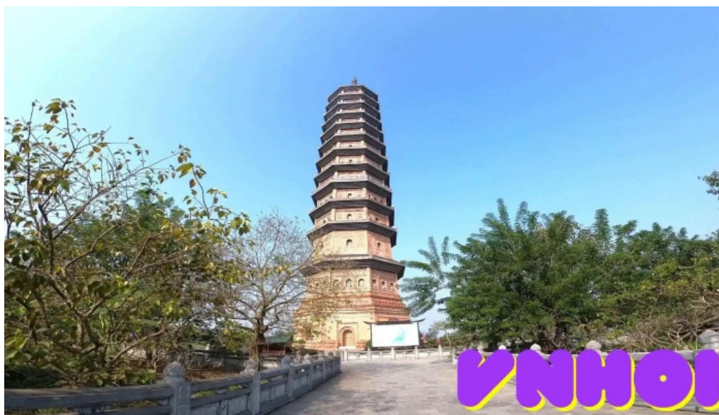
Tháp báo thiên video