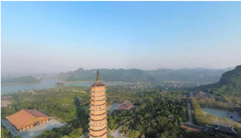
Thap bao thien che do xem pho va 360deg