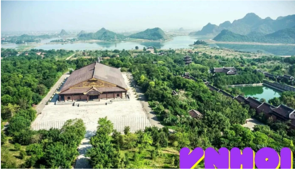
Thap bao thien nui