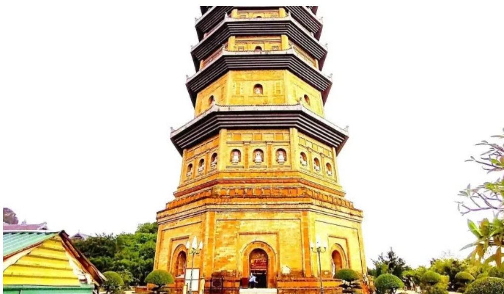
Tháp báo thiên tất cả