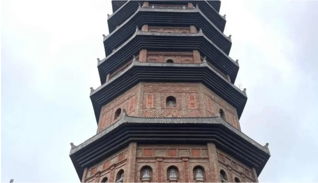
Thap bao thien moi nhat