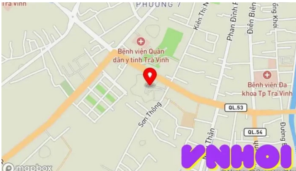
Chùa phương vtt cmpkmaas wat khuone campakamasa b?n ??