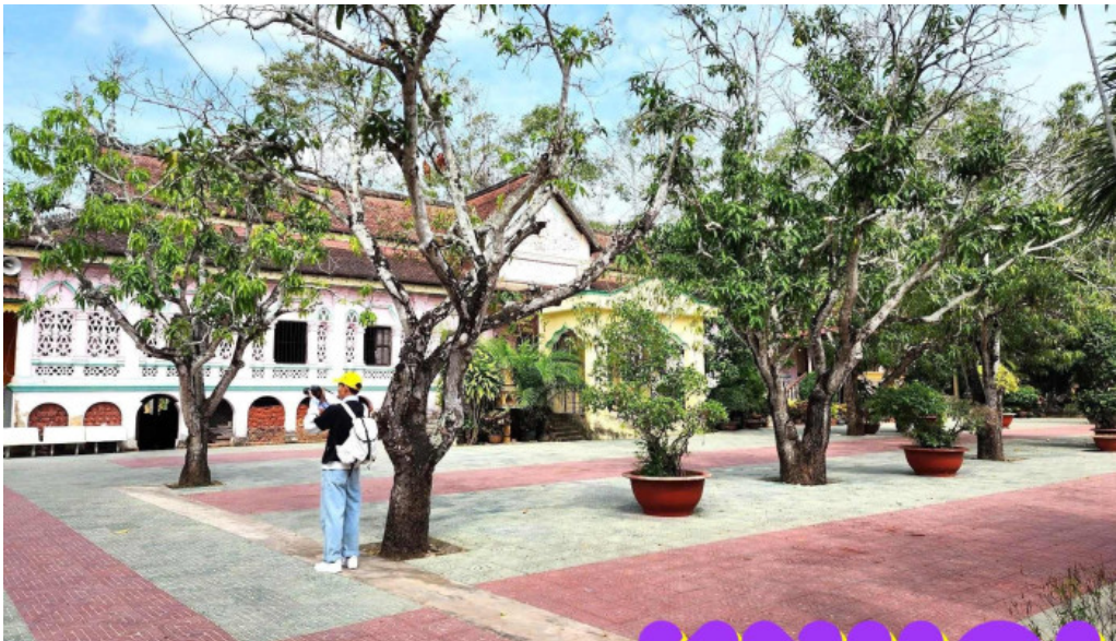
Chua phuong vtt cmpkmaas wat khuone campakamasa moi nhat