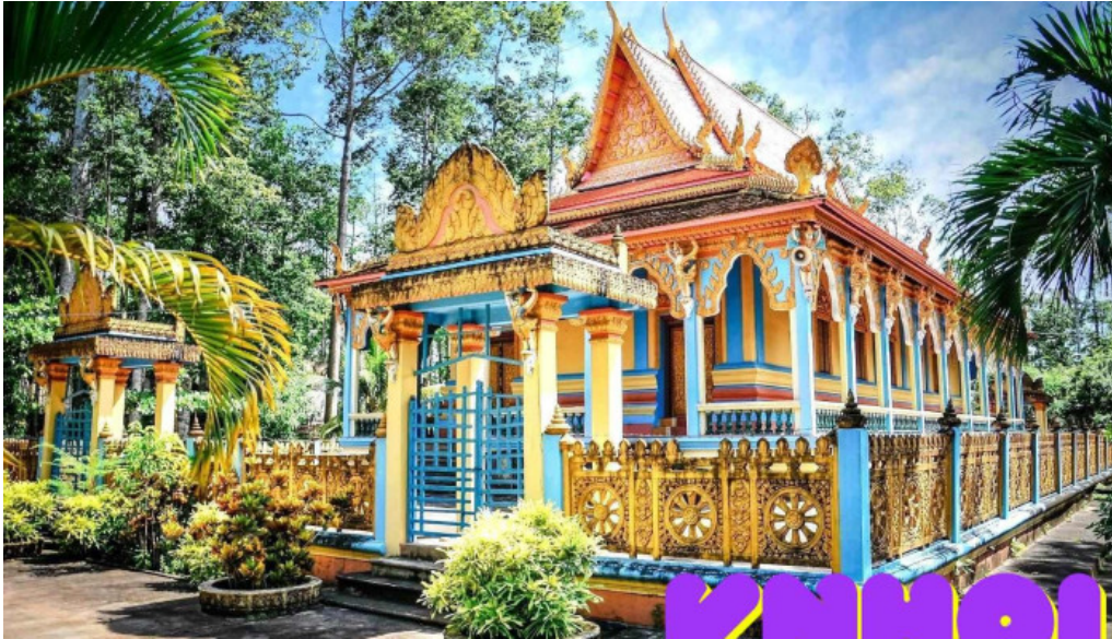
Chùa ph??ng ????? ?????????? wat kh??ne campakamasa tra vinh