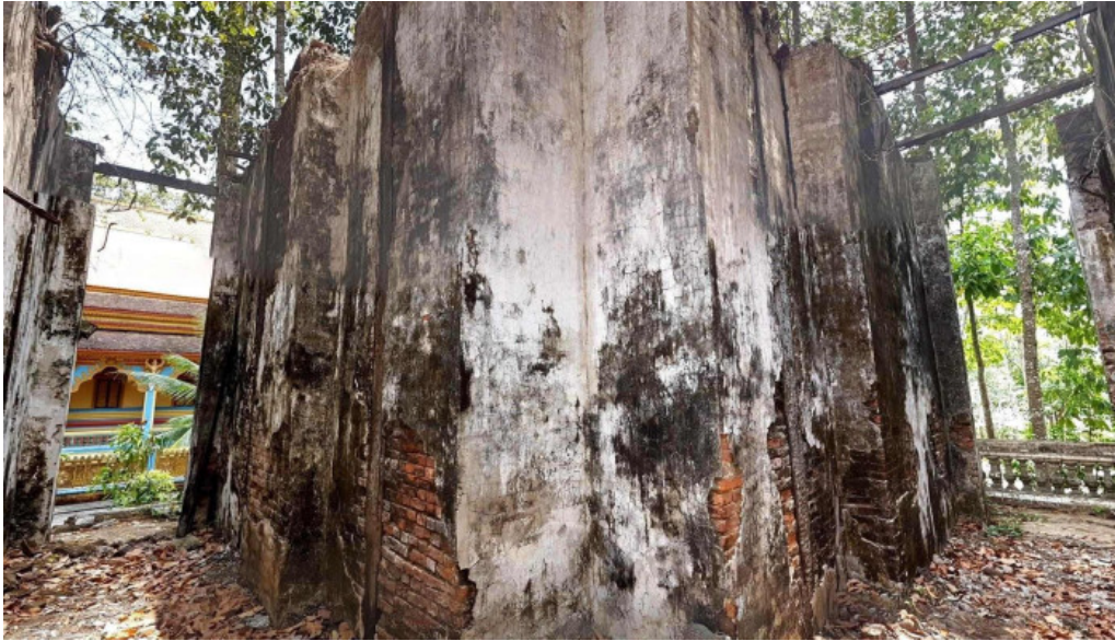
Chùa phương vtt cmpkmaas wat khuone campakamasa che do xem pho va 360deg