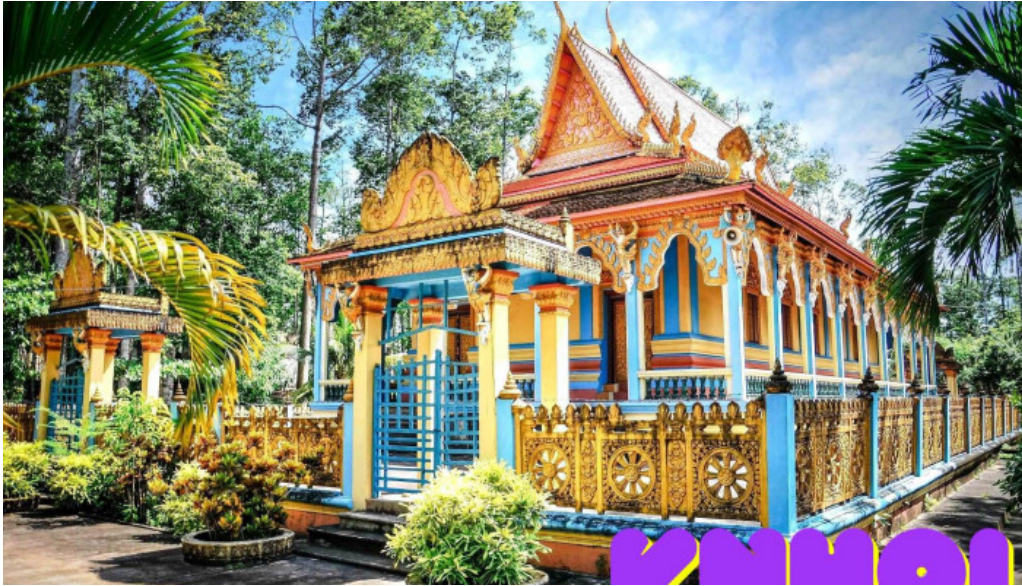
Chua phuong vtt cmpkmaas wat khuone campakamasa tat ca