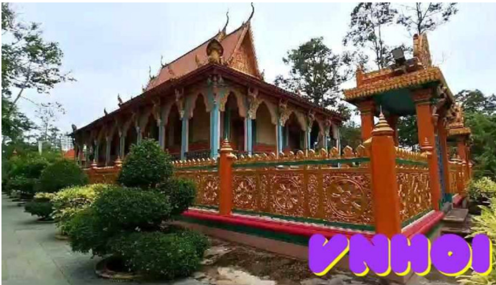
Chùa phuong vtt cmpkmaas wat khuone campakamasa video