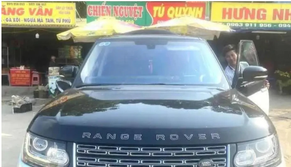
??ng thanh s?n ch? trì mai th? thuy?t thanh hoa