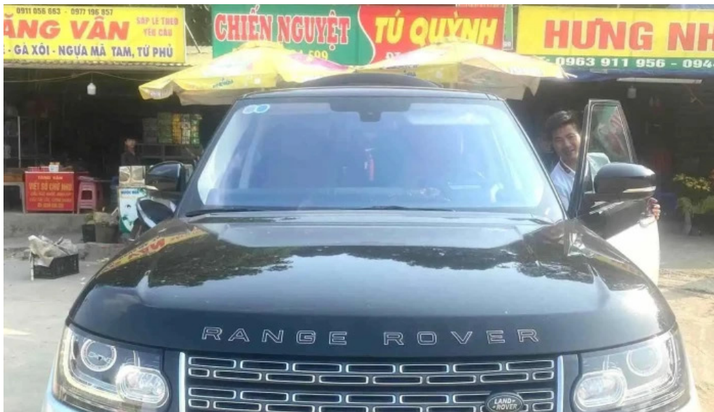
Dong thanh son chu tri mai thi thuyet tat ca