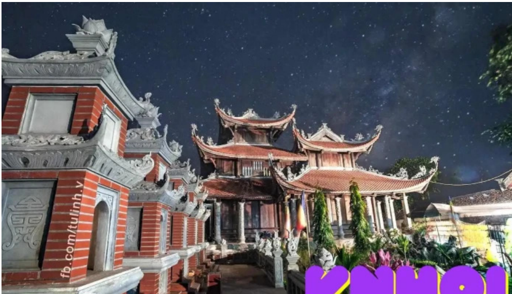
Chua thiên quý thái bình