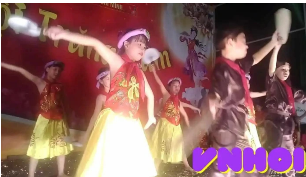
Chua thiên quý video