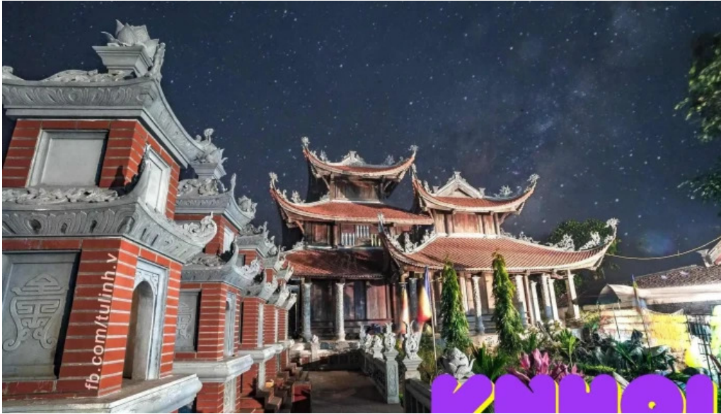
Chua thien quy tat ca