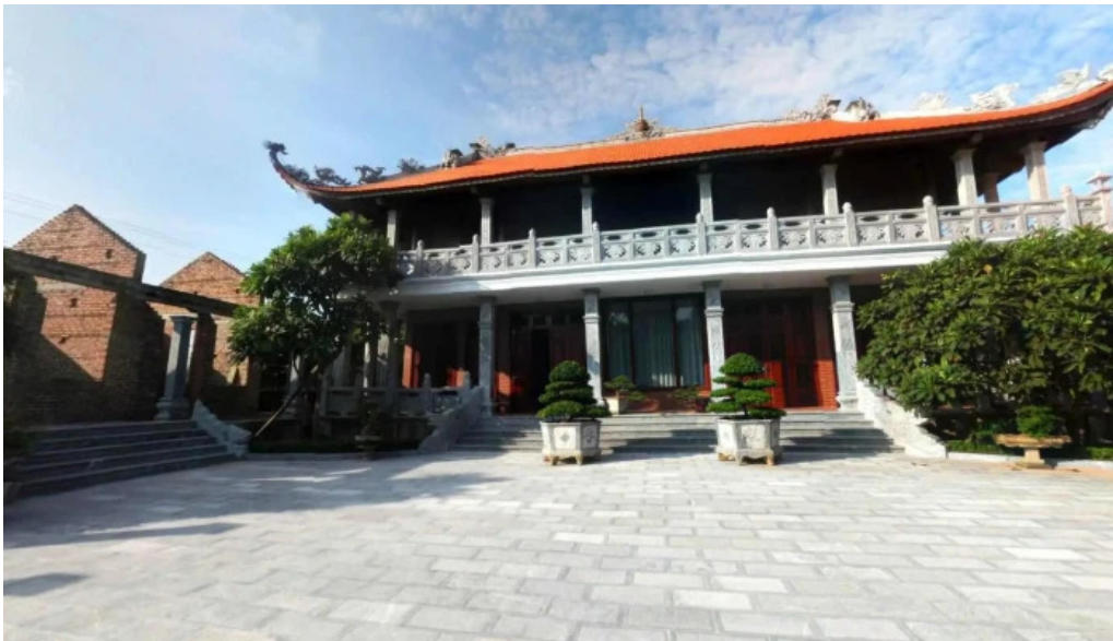
Chua thien quy che do xem pho va 360deg