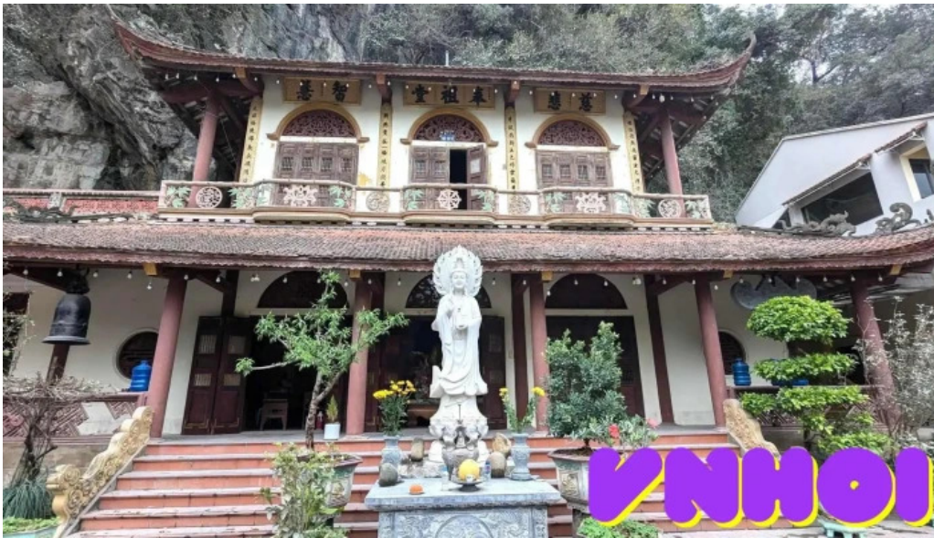
Dong va chua dich long moi nhat