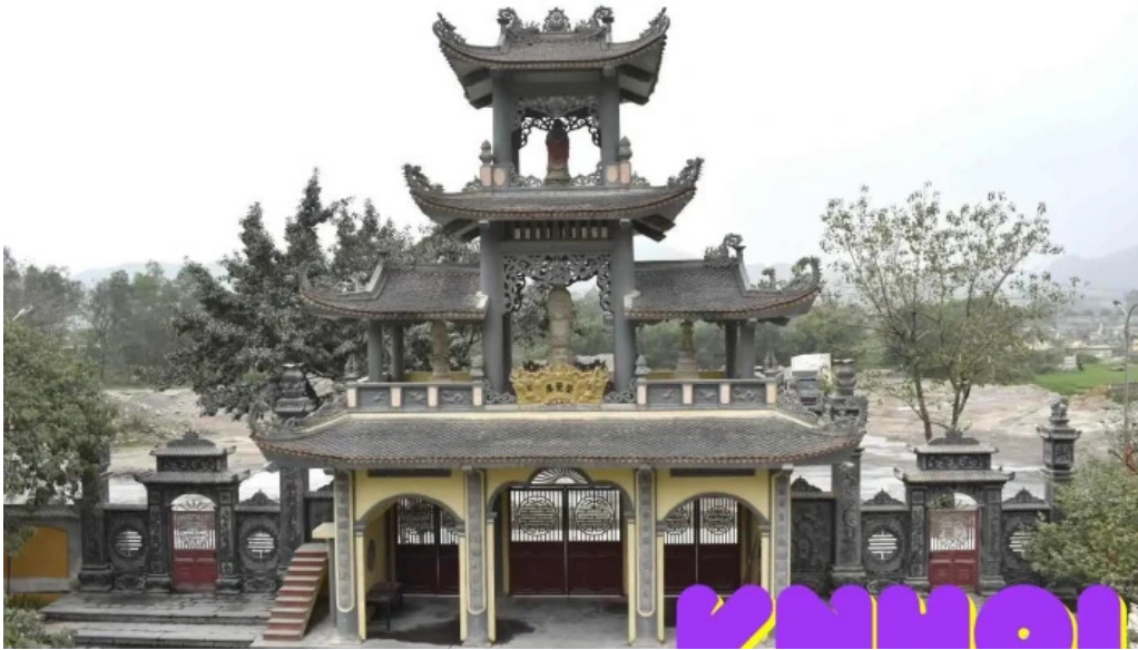
Dong va chua dich long tat ca