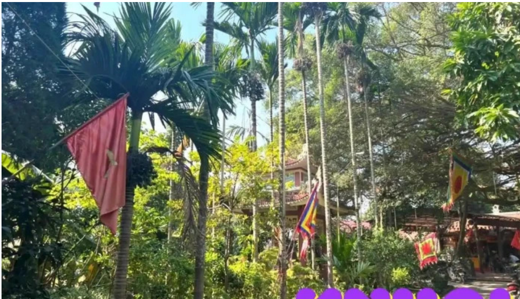
Di tich lich su phu diem tat ca