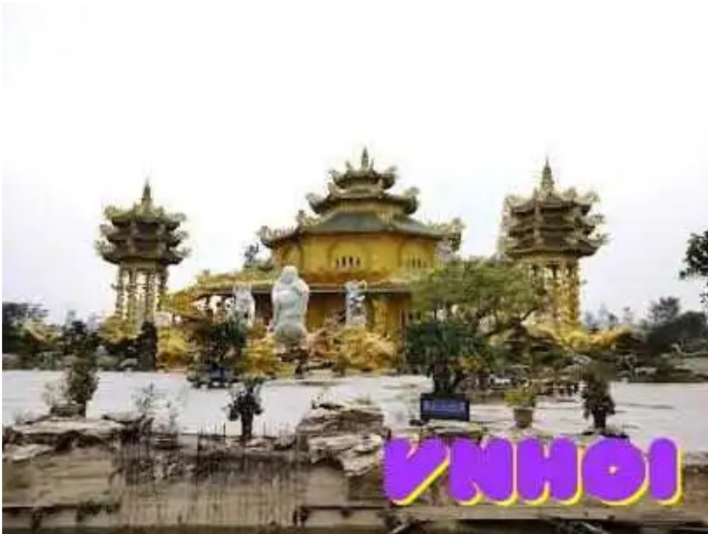
Chua phuc lam la mat tat ca