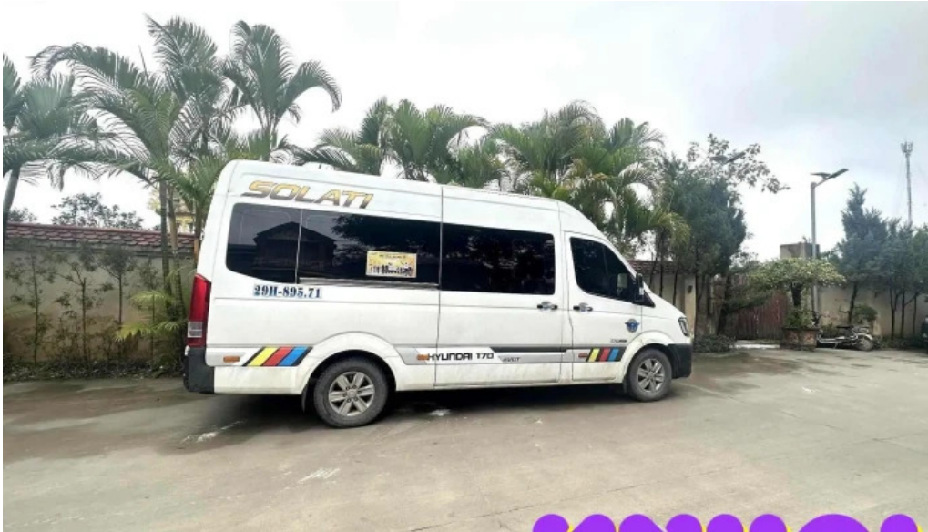
Chua phuc lam la mat moi nhat