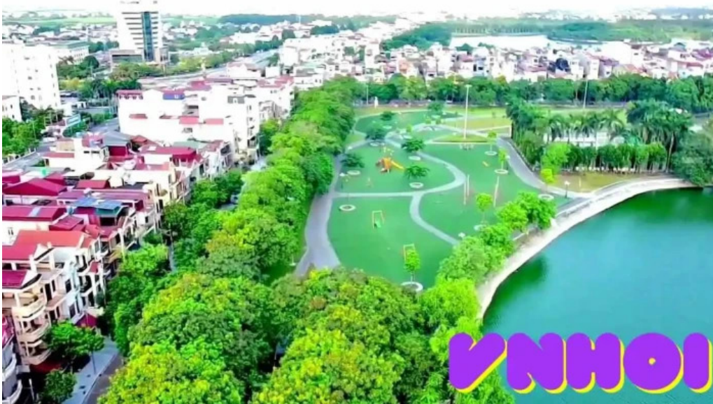
Chua chuong moi nhat