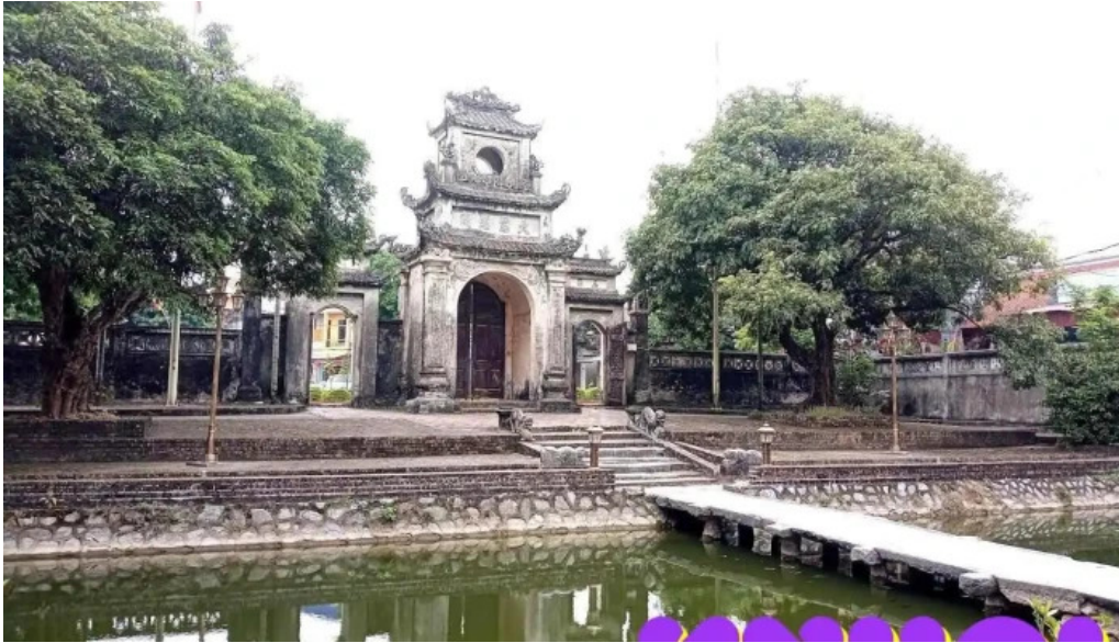
Chua chuong h?ng yen