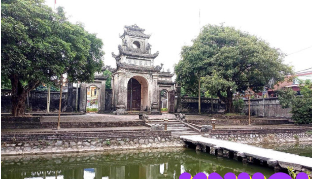
Chua chuong tat ca