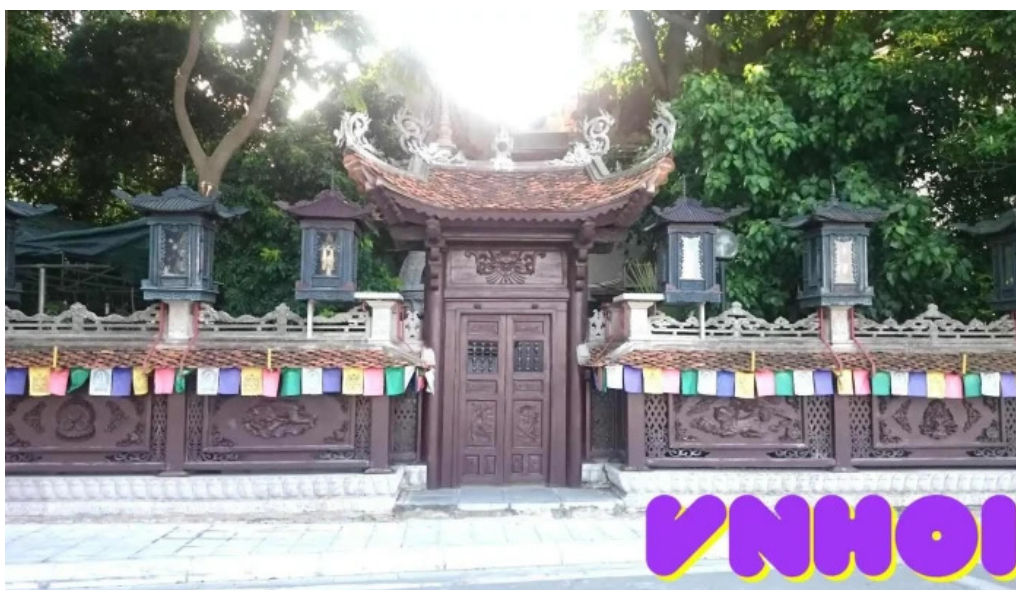
Chùa v?n niên ha n?i