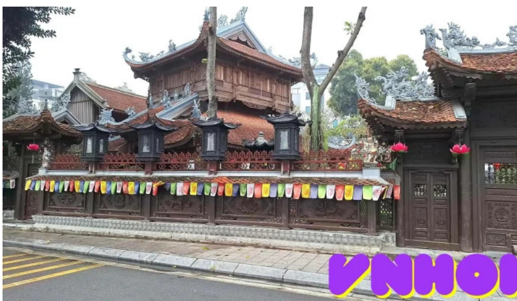
Chùa van niên video