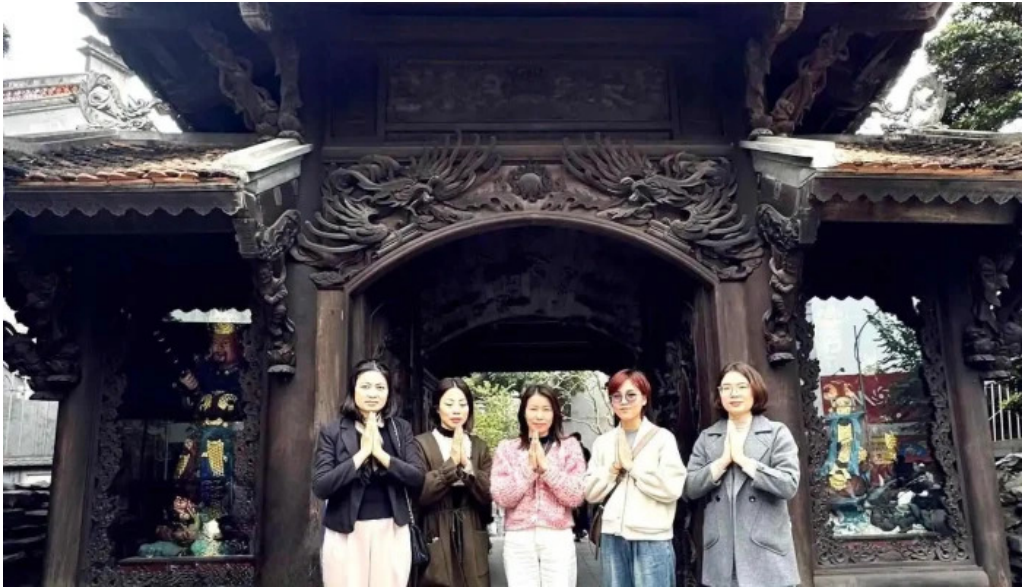
Chua van nien moi nhat