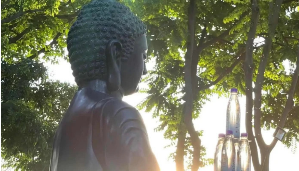
Chua van nien cua chu so huu