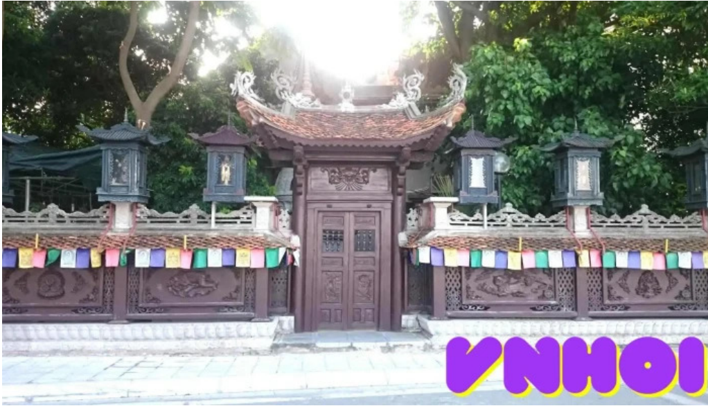
Chua van nien tat ca