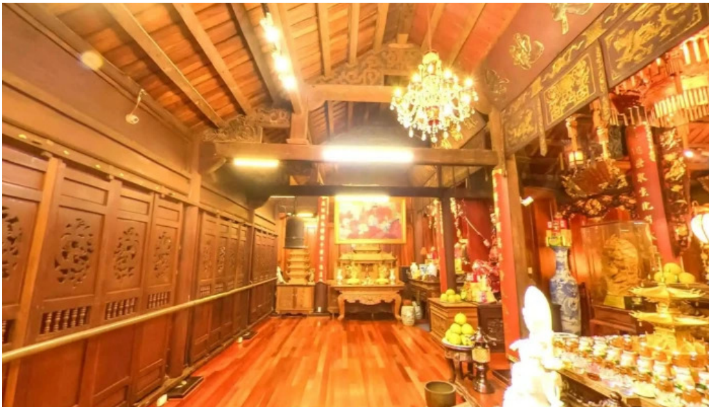
Chua van nien che do xem pho va 360deg