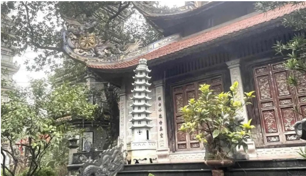
Chua ngau moi nhat