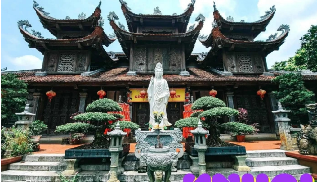
Chua ngau tat ca