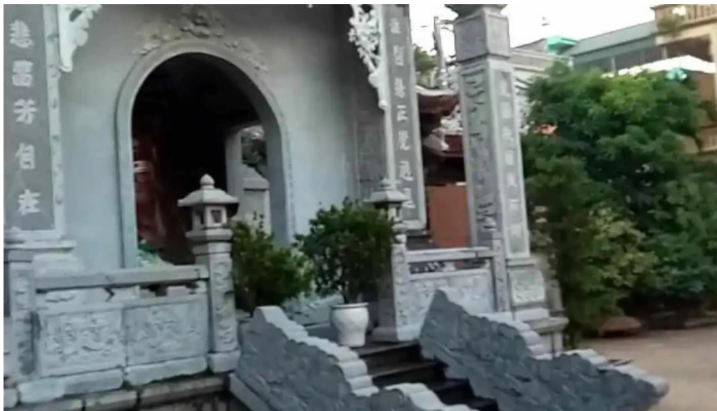
Chua ngau video