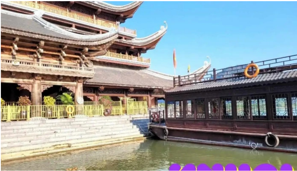
Khu du lich quoc gia tam chuc tat ca