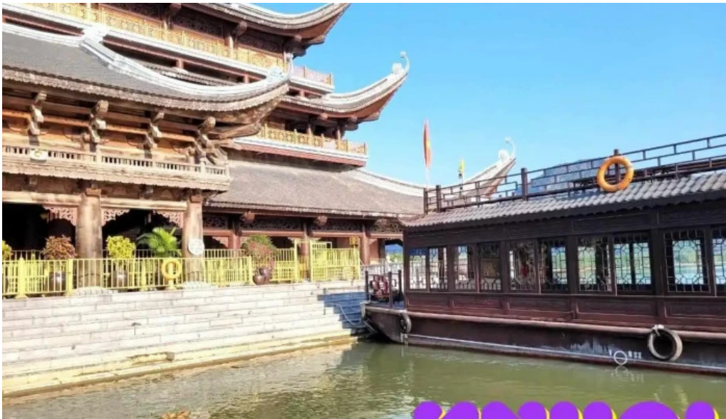
Khu du l?ch qu?c gia tam chuc ha nam