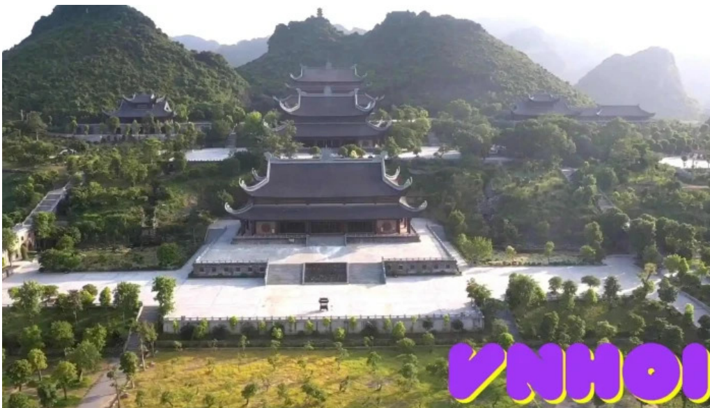
Khu du lich quoc gia tam chuc video