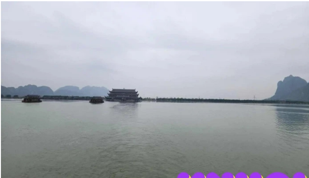
Khu du lich quoc gia tam chuc moi nhat