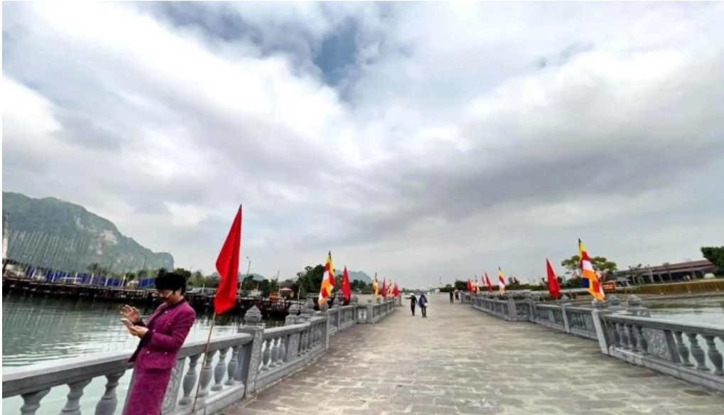
Khu du lịch quốc gia tam chuc che do xem pho va 360