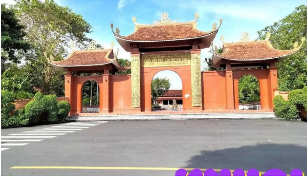
Thiên viên trúc lâm phương nam cảnh?