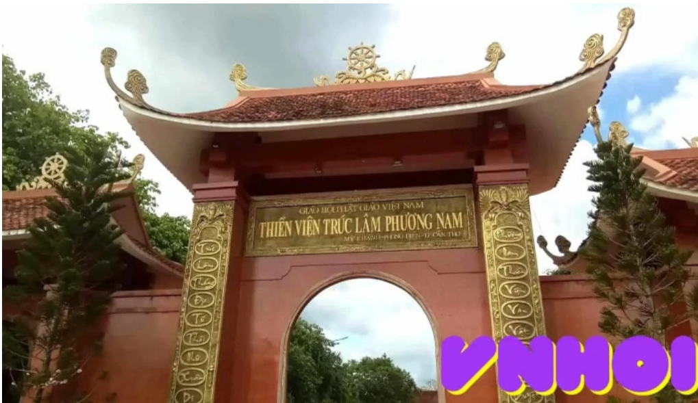
Thiên viên trúc lâm phương nam video