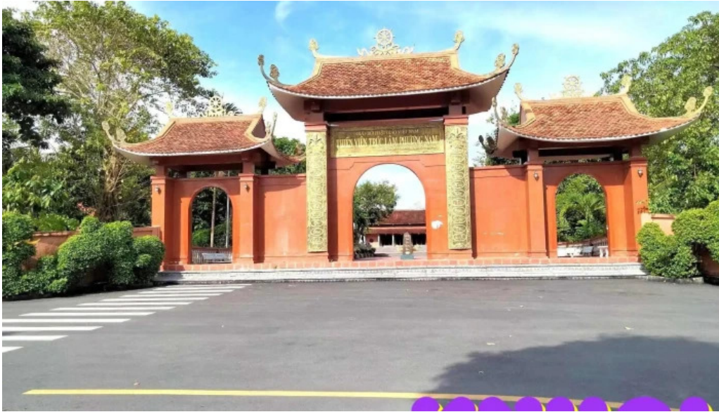
Thien vien truc lam phuong nam tat ca