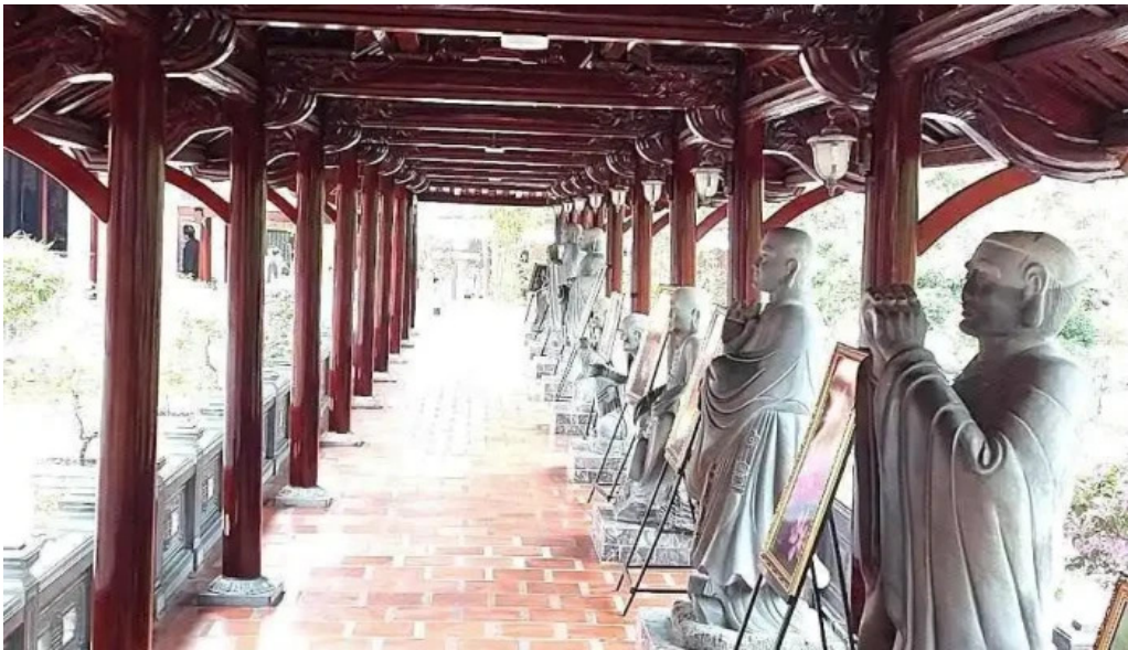
Thien vien truc lam phuong nam moi nhat