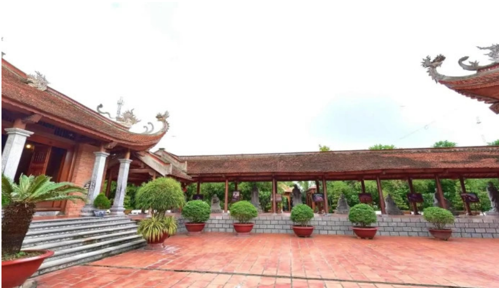
Thiên viện trúc lâm phương nam che do xem pho va 360deg